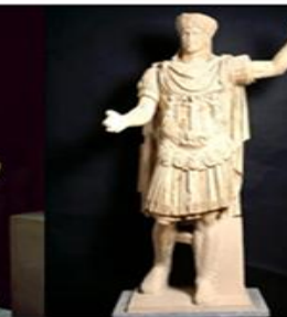
Μαρμάρινο άγαλμα του αυτοκράτορα Αδριανού