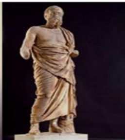
Άγαλμα ώριμου άνδρα