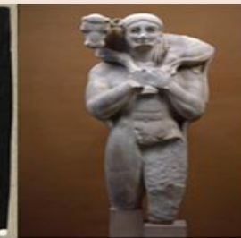
Ο Μοσχοφόρος. Μαρμάρινο αρχαϊκό άγαλμα