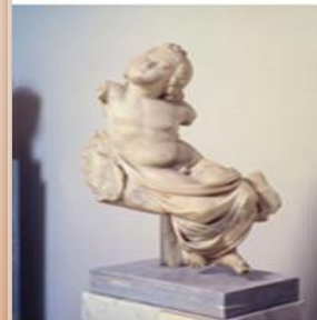
Άγαλμα μικρού Πλούτου