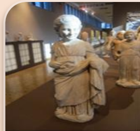
Μαρμάρινο άγαλμα κοριτσιού