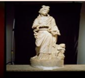
Μαρμάρινο άγαλμα της Υγείας-Αφροδίτης με τον Έρωτα- Ύπνο