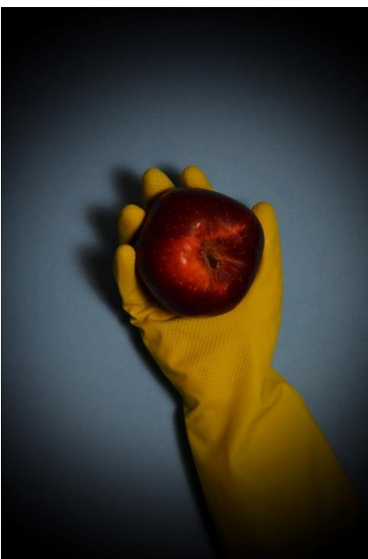
Κολιγκιώνη Πολυξένη, "Spring isolation", 2021

Τα θετικά αυτής της τεχνικής φωτογράφισης είναι σαφώς το γεγονός ότι ο φωτογράφος έχει τον πλήρη έλεγχο της λήψης, σε αντίθεση με μια εικόνα δρόμου για παράδειγμα. Μπορεί να ελέγξει πλήρως τον φωτισμό την σύνθεση το στήσιμο τα χρώματα και γενικά όλη την επιμέλεια του θέματος.