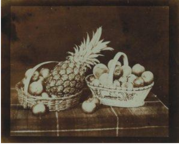
"A Fruit Piece" from The Pencil of Nature, 1845,