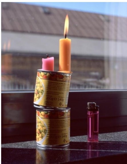
Same Paper: Still Life, Antje Peters

Η καλλιτέχνη Antje Peters, είναι ακόμα μια φωτογράφος η οποία πήρε μέρος στο συγκεκριμένο φωτογραφικό project. Η ίδια δήλωσε, πως οι καταστάσεις τους εγκλεισμού δεν της επέτρεψαν να πάει στο στούντιο της για να φωτογραφίσει, οπότε περιορίστηκε στο να δημιουργήσει, εικόνες με φυσικό φωτισμό στο περβάζι του διαμερισμάτος της, χρησιμοποιώντας μόνο τον εξοπλισμό που διέθετε στο σπίτι της. Το συγκεκριμένο παράδειγμα μάλιστα, το βίωσαν και άλλοι προφανώς καλλιτέχνες και θα μπορούσαμε να πούμε πως ταιριάζει απόλυτα με την αισθητική του πειραματισμού πάνω στον τομέα της νεκρής φύσης. 20