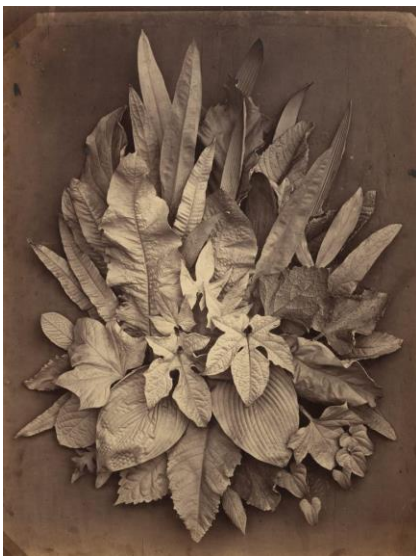
Charles Aubry, Untitled (A Study of Leaves) , 1864

Οι εικόνες του αντικατοπτρίζουν την κατανόηση της υφής του. Για παράδειγμα σε αυτή του την εικόνα έβαλε μέσα σε γύψο φύλλα και λουλούδια πριν τα τοποθετήσει και τα στήσει για φωτογράφιση. Αυτή η τεχνική βοήθησε στην ανάδειξη λεπτομερειών των αντικειμένων και στην εμφάνιση της τρίτης διάστασης. Η συγκεκριμένη εικόνα δημιουργήθηκε λίγες δεκαετίες αργότερα από εκείνες των ευεργετών της νεκρής φύσης το 1864. Αυτό αποδεικνύει και το γεγονός πως οι καλλιτέχνες αγκάλιασαν άμεσα αυτό το είδος φωτογράφισης. 9