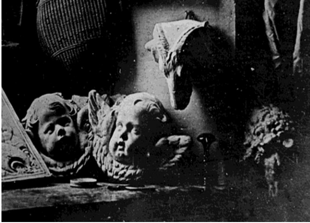
Louis-Jacques-Mandé Daguerre, The Artist's

Studio / Still Life with Plaster Casts (detail) , 1837