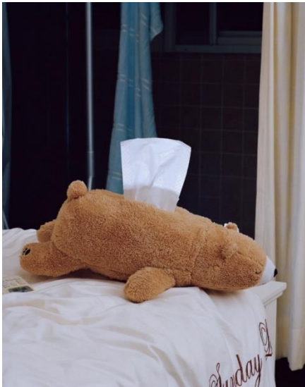
Xiaopeng Yuan, Selfie, Still Life, 2020

Αντικείμενα όπως παιχνίδια, σαπούνια, πατατάκια στο ράφι κ.α. μπορούν να γίνουν συναρπαστικά θέματα για φωτογράφιση αυτής της περιόδου. Παρά την στασιμότητα και τον εγκλεισμό, η ομορφιά μπορεί να βρεθεί παντού γύρω μας ακόμα και από αυτά τα μικροαντικείμενα.