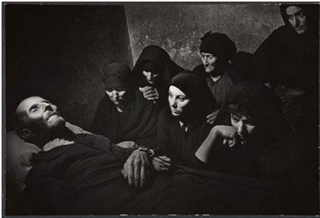
Eugene Smith, "Spanish Wake"

Ένας πρωτότυπος τρόπος απόδοσης της νεκρής φύσης είναι και αυτός που προσέγγισε σχεδόν έναν αιώνα αργότερα, ο φωτογράφος Eugene Smith. Προβληματίζεται φωτογραφικά με τις έννοιες της θνησιμότητας και του θανάτου. Χαρακτηριστικό παράδειγμα αποτελεί η εικόνα του με τίτλο "Spanish Wake", όπου βλέπουμε να απαθανατίζεται ένας νεκρός και γύρω του γυναίκες να μοιρολογούν 10 .