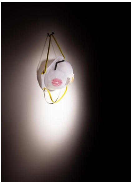
Elinor Carucci, "The impossible kiss", Corona days, 2020

Η ίδια λοιπόν δημιουργεί μια φωτογραφική σειρά για να αποδώσει την δική της προσωπική πτυχή μέσα στις μέρες του κορονοϊού . Χρησιμοποιεί μάσκες και προσωπικά αντικείμενα καθώς και πρόσωπα του κύκλου της, ώστε να δώσει έναν πιο προσωπικό χαρακτήρα σε αντίθεση με αυτόν τον απρόσωπο ιό που αντιμετωπίζουμε.