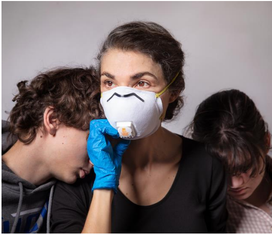
Elinor Carucci, "Love in the Time of Corona", 2020

Η συγκεκριμένη εικόνα είναι εμφανώς τραβηγμένη με δραματικό τρόπο, ώστε να περιγράψει την κατάσταση που βιώνουμε όλοι μας, καθώς είναι καθαρή η θεματολογία της με την επιλογή της μάσκας. Σύμφωνα με την ίδια η συγκεκριμένη μάσκα δεν είναι τυχαία. Όπως δήλωσε ανήκει στον άντρα της Έραν . Με το χαρακτηριστικό σημάδι από φιλί πάνω στο πρωταγωνιστικό αντικείμενο της εικόνας, η ίδια θέλει να δείξει την έλλειψη συναισθηματικής συναναστροφής που έχουμε αναπτύξει ένα χρόνο τώρα με τους γύρω μας. Ακόμα και τα πιο κοντινά μας άτομα πλέον δεν μπορούμε να τα αγγίξουμε ούτε να τα φιλήσουμε, έτσι λοιπόν αφού προτρέπει πρώτα η υγεία, δείχνει την αγάπη της με ένα σημάδι στοργής πάνω στην μάσκα. 13