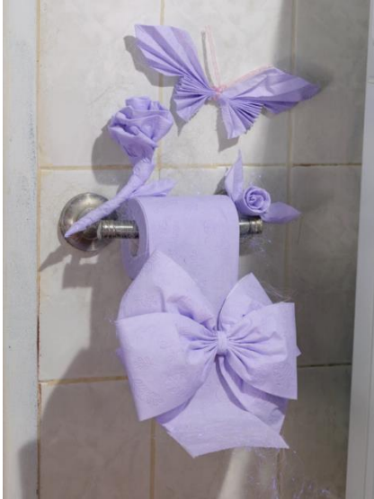
David Brandon Geeting, " Magic Roll ", 2020

Ο David Brandon Geeting είναι ένας ακόμα φωτογράφος με έδρα την Νέα Υόρκη. Μέσα από τις χαρακτηριστικές πολύχρωμες εικόνες του, προσπαθεί να τοποθετηθεί και αυτός σχετικά με τα τεκταινόμενα.