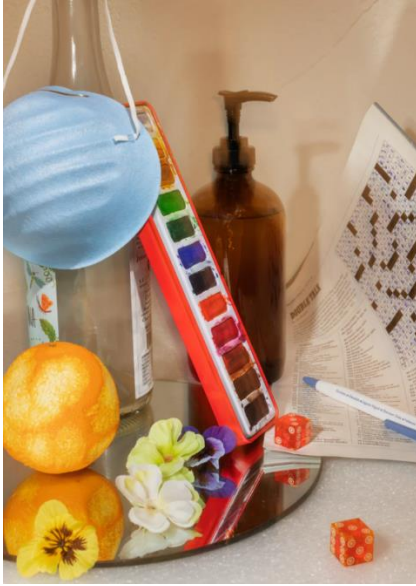
Maggie Shannon, "At Home", 2020

Η μάσκα, είναι η χρυσή τομή της εικόνας όπως φαίνεται, για να τονίσει το θέμα για το οποίο τραβήχτηκε. Η φωτογράφος δηλώνει, πως όλα αυτά τα στοιχεία στην εικόνα είναι καθημερινά της αντικείμενα. Βλέπουμε ένα σταυρόλεξο που ολοκλήρωσε ο άντρας της, χρώματα για ζωγραφική, καθώς ίδια λέει πως με την ζωγραφική προσπαθούσε να κρατήσει τον εαυτό της αποσπασμένο κ.α. Όλα αυτά τα μικρά αντικείμενα λοιπόν, τους κρατούσαν σε εγρήγορση κατά την διάρκεια αυτής της δύσκολης περιόδου.