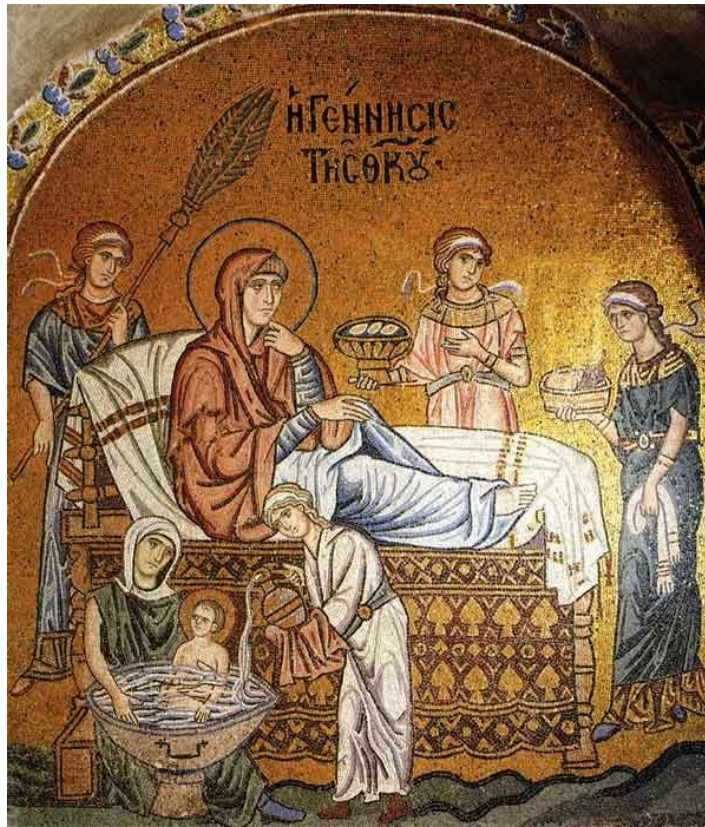
Εικόνα 5 - Ψηφιδωτό στο ανατολικό τμήμα του Καθολικού