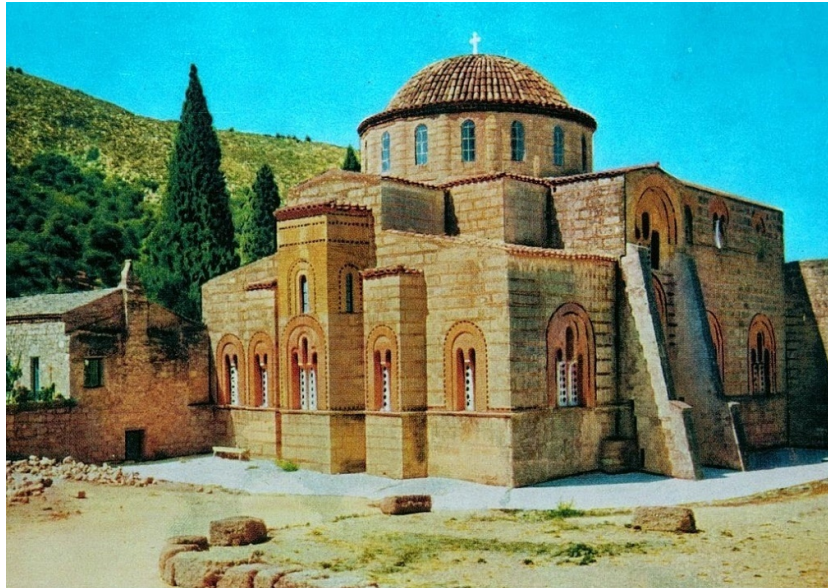
Εικόνα 1 – Η Μονή Δαφνίου 1

Η Μονή Δαφνίου είναι κτισμένη στις παρυφές του όρους Αιγάλεω και ειδικότερα στο άλσος Χαϊδαρίου. Πιο συγκεκριμένα, είναι χτισμένη σε κομβικό σημείο, όπου ενώνονται η Αθήνα και η Ελευσίνα. Πρόκειται για έναν βυζαντινό ναό, ενώ ο Πausanias υποστήριζε πως στην εν λόγω περιοχή υπήρχε το αρχαίο ιερό του Δαφνίου Απόλλωνα(Εφορία Αρχαιοτήτων Δυτικής Αττικής, 2021).