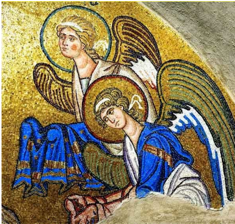
Εικόνα 4 - Ψηφιδωτό στο νοτιοδυτικό τμήμα του Καθολικού