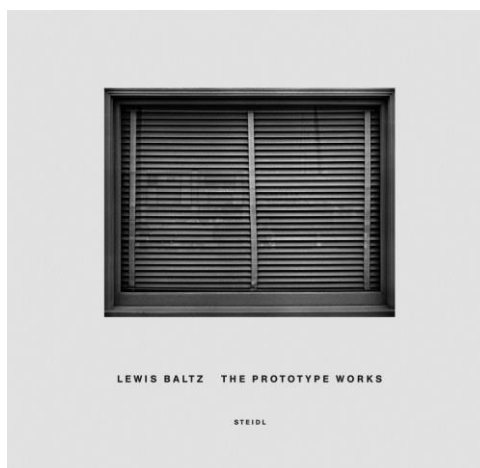
« The Prototype Works »

Βλέπε λινκ: https://steidl.de/Books/The-Prototype-Works-0207222356.html