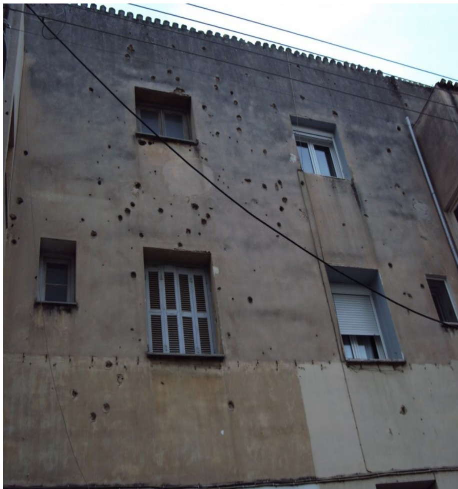
Εικόνα 3 – Κτίριο στο Μεταξουργείο με εμφανή τα σημάδια στους τοίχους από τις οδομαχίες των Δεκεμβριανών – φωτογραφία από www.aftodioikisi.gr

Μία άλλη περίπτωση που αξίζει να αναφερθεί, είναι το Εθνικό Μνημείο και Μουσείο για τα θύματα της τρομοκρατικής επίθεσης της 11ης Σεπτεμβρίου του 2001 στη Νέα Υόρκη. Ο χώρος που στεγάζονταν οι δίδυμοι πύργοι του Παγκόσμιου Κέντρου Εμπορίου, μετά την καταστροφή τους από την τρομοκρατική επίθεση παρέμεινε άδειος και δέκα χρόνια μετά την επίθεση, στις 11 Σεπτεμβρίου του 2011, το Εθνικό Μνημείο και Μουσείο της 11ης Σεπτεμβρίου αφιερώθηκε