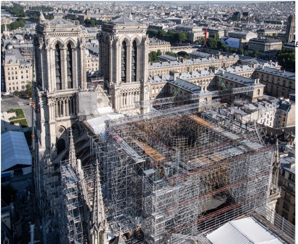
Εικόνα 1 – Εργασίες αποκατάστασης στην Παναγία των Παρισίων μετά την πυρκαγιά του 2019

Στο παραπάνω απόσπασμα αντικατοπτρίζεται μία από τις βασικές αρχές ηθικής και δεοντολογίας στον τομέα της Συντήρησης που αποτελεί την αρχή της ελάχιστης επέμβασης . Οι άλλες τρεις βασικές αρχές είναι η αρχή της αναστεψιμότητας , η αρχή των διακριτών επεμβάσεων και νέων υλικών και η αρχή της συμβατότητας . Θα μπορούσαμε επίσης να συμπεράνουμε πως ο Ουγκώ θέτει ως προτεραιότητα την ιστορική αξία των μνημείων ως την αξία που υπερέχει σε αυτά και στην οποία άρα θα πρέπει να δοθεί και η μεγαλύτερη έμφαση. Η περίπτωση του καθεδρικού ναού της Παναγίας των Παρισίων είναι μάλιστα περισσότερο επίκαιρη σήμερα μετά την πρόσφατη πυρκαγιά του 2019, κατά την οποία σημαντικό μέρος του ναού υπέστη ολοσχερή καταστροφή. Το έργο της ανοικοδόμησης και αποκατάστασης των ζημιών αποτελεί σίγουρα μία πολυδιάστατη πρόκληση.