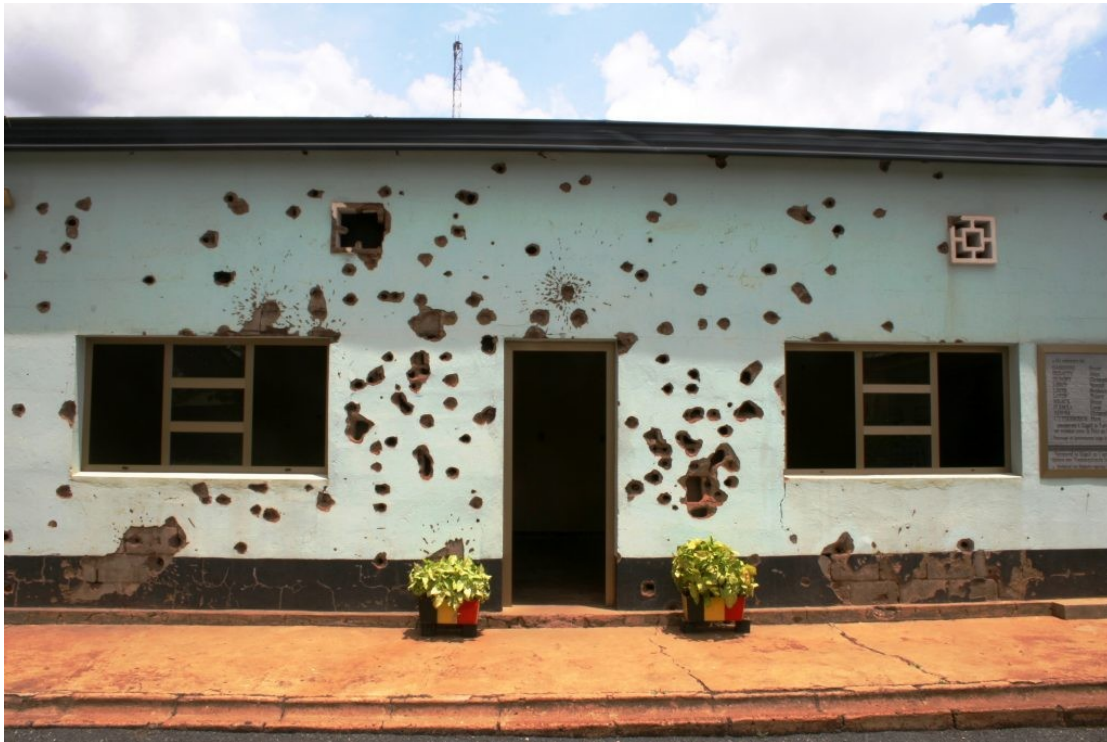
Εικόνα 5 – Το στρατιωτικό κέντρο στο Κιγκάλι της Ρουάντα ως μνημειακός χώρος της γενοκτονίας του 1994 – φωτογραφία από www.hmd.org.uk

Τέλος, τα Εθνικά Μνημεία Γενοκτονίας στη Ρουάντα που τοποθετούνται σε όλη την έκταση της χώρας, δημιουργήθηκαν για να τιμήσουν τη γενοκτονία που διαδραματίστηκε στη Ρουάντα το 1994 και κατά την οποία εκτιμάται πως πάνω από 800.000 άνθρωποι έχασαν τη ζωή τους σε διάστημα 100 ημερών από τον Απρίλιο του 1994. Οι μνημειακοί χώροι περιλαμβάνουν φωτογραφίες, εκθέματα λειψάνων και προσωπικά αντικείμενα των θυμάτων της γενοκτονίας. Αποτελούν σημαντικής ιστορικής και κοινωνικοπολιτικής αξίας τόπους παρηγοριάς, πένθους και σύνδεσης των επιζώντων με τους νεκρούς συγγενείς και φίλους τους. Η επισκεψιμότητα των μνημείων κορυφώνεται κατά τη διάρκεια του εθνικού πένθους της Ρουάντα τον Απρίλιο κάθε έτους.