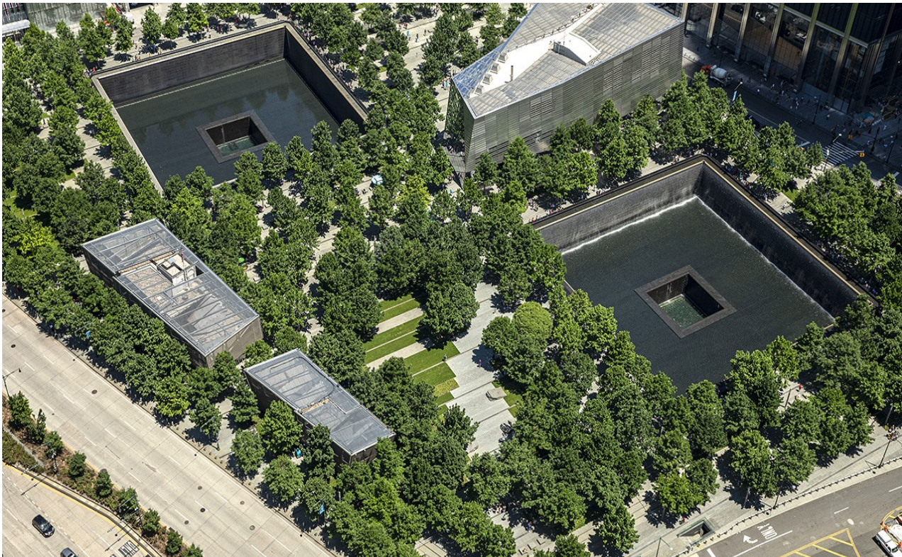
Εικόνα 4 – Το Εθνικό Μνημείο και Μουσείο για τα θύματα της 11ης Σεπτεμβρίου στη Νέα Υόρκη

σε επίσημη τελετή στη μνήμη των θυμάτων της τρομοκρατικής επίθεσης και άνοιξε για το κοινό την επόμενη μέρα. Το μνημείο τοποθετείται σε μια μεγάλη έκταση γύρω από τον αρχικό χώρο του Παγκόσμιου Κέντρου Εμπορίου και περιλαμβάνει δύο πισίνες που κατασκευάστηκαν στην αρχική θέση των δίδυμων πύργων. Τα ονόματα όλων των θυμάτων από τις επιθέσεις στη Νέα Υόρκη, στο Πεντάγωνο και στην αεροπορική πτήση United Flight 93, που συνετρίβη στο Σάνκσβιλ της Πενσυλβάνια, είναι χαραγμένα σε επιμετάλλωση που πλαισιώνει τις μνημειακές βρύσες. Τα ονόματα των θυμάτων που σκοτώθηκαν στις βομβιστικές επιθέσεις στο Παγκόσμιο Κέντρο Εμπορίου το 1993 περιλαμβάνονται επίσης σε αυτό το μνημείο. Οι λόγοι που οδήγησαν στη δημιουργία μνημειακού χώρου στο σημείο και όχι στην επανοικοδόμησή του, είναι πως μετά τις τρομοκρατικές επιθέσεις της 11ης Σεπτεμβρίου ο συγκεκριμένος χώρος αποτελεί τόπο μνήμης ιστορικής και κοινωνικής αξίας για το αμερικανικό έθνος και την ανθρωπότητα γενικότερα.