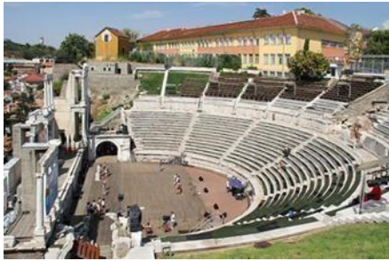
Εικόνα 10. Ρωμαϊκόθέατρο Πλόβντιβ. Βρίσκεται στην Βουλγαρία.