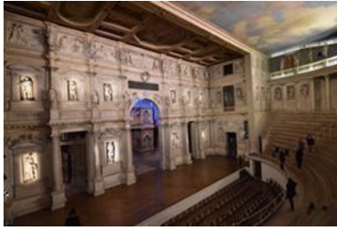
Εικόνα 14, θέατρο Ολύμπικο, ξύλινη βάση ιταλική σκηνή

2021, Alberti, 1992, Wassell & nexus network 2008, Riccuci etc, 2017, Charvet, 1869, Borys, 2014, Βασιλειάδου, 2017, Velek, 2008).