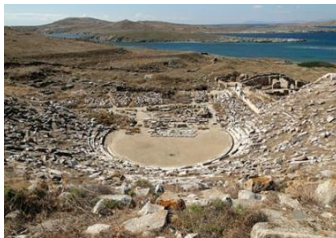
Εικόνα5 Αρχαίοθέατρο Δήλου.