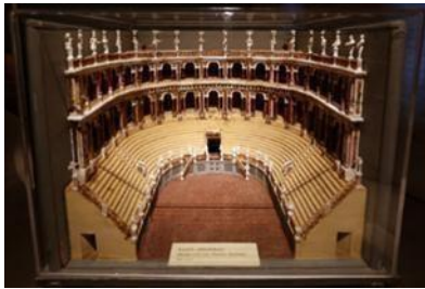
Εικόνα 15, θέατρο Φαρνέζε