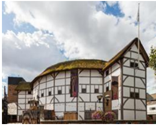
Εικόνα 17, shakespeare'sglobe