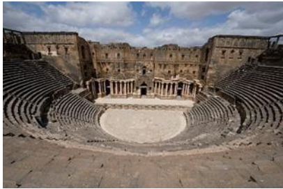
Εικόνα 11. Ρωμαϊκόθέατρο Μπόσρα.