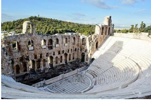
Εικόνα 3. Αρχαίο ηρώδου του Αττικού. Παρατηρείται η σκηνοραφία Scaenae frons.