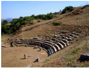
Εικόνα4. ΑρχαίοθέατροΟρχωμενού Αρκαδία

του περιλαμβάνει τρεις φάσεις. Στην πρώτη φάση το θέατρο διέθετε σκηνοθήκη μπροστά από το ανάλημμα της ανατολικής παρόδου. Στην δεύτερη φάση η σκηνή με το προσκήνιο ανακατασκευάζονται πάνω σε ερείπια της ελληνιστικής σκηνής. Στην θέση της δυτικής ελληνιστικής παρόδου κατασκευάζονται παρασκήνια. Στην τρίτη φάση το θέατρο διακοσμείται, όμως είναι διαφορετικό από το πρώιμο ελληνιστικό. Η αρχιτεκτονική του περιλαμβάνει ασβεστόλιθο, πέτρα, γρανίτη, και μάρμαρο. (Λαμπάκη, 2013, Yorshitake etck, 2019.).