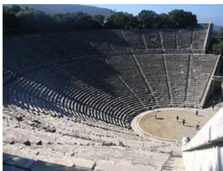
Εικόνα 2, Αρχαίο θέατρο της επιδαύρου. Είναι γνωστό χάρη στην καλή ακουστική του. Παρατηρείται η ημικυκλική σκηνή.