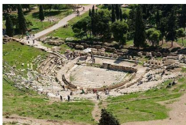
Εικόνα 1, αρχαίο θέατρο Διονύσου

Το αρχαίο θέατρο στην Δήλο, το θέατρο Πριήνης, το θέατρο Αφροδισιάδος, τοθέατρο Μήλου, το θέατρο Λυκηστίδος, το θέατρο Μήλου, το θέατρο Νάξου, το θέατρο Μυτιλήνης, το θέατρο Θάσου. Το αρχαίο θέατρο Στόβων, το αρχαίο θέατρο Λυχνίδος,το αρχαίο θέατρο Μαρώνειας, το αρχαίο θέατρο Μεσσήνης, το αρχαίο αρχαίο θέατρο Φιλιππούπολης, το αρχαίο θέατρο Ιλίου, το αρχαίο θέατρο Σμύρνης, το αρχαίο θέατρο Μιλήτου, το αρχαίο θέατρο Εφέσου, το αρχαίο θέατρο Μαγνησίας, το αρχαίο θέατρο Ιασού, το αρχαίο θέατρο Αρικάνδων, το αρχαίο θέατρο Τερμησσού,το αρχαίο θέατρο Αντιοχείας, το αρχαίο θέατρο Κυβίριων, το αρχαίο θέατρο Φρυγίας,το αρχαίο θέατρο Συρρακουσών, το αρχαίο θέατρο Ονιαδών, το αρχαίο θέατροΒουθρωτού, τα θέατρα Ζέας Πειραιάς και το αρχαίο θέατρο Σπάρτης αμφότερα βρίσκονται στην Πελοπόννησο, αλλά και τα αρχαία θέατρα Μπόσρα οποίο βρίσκεται στην Συρία, το θέατρο της Ιερουσαλήμ, το θέατρο Γεράσων οποίο βρίσκεται στην Ιορδανία, το αρχαίο θέατρο Νεαπόλεως οποίο βρίσκεται στην Παλαιστίνη, Μεση ανατολή. (Περλιάνη, 2017, Σαρηγιαννιδη, 2014, Πετρουνάκος, 2009, Γκούμα, 2014, Γκάρτζιου-Τάττη, 2016, Τζοβλά &Χαρατσάρη, 2012, Chourmouziadou &Kang, 2008, Αβούρη, 2008, Rindel, 2013. Sear, 2006 ).