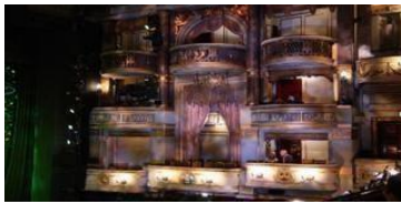
Εικόνα 19. Θέατρο Drury lane,