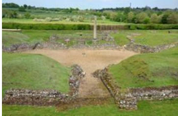
Εικόνα 18, Βερουλάμιουμ