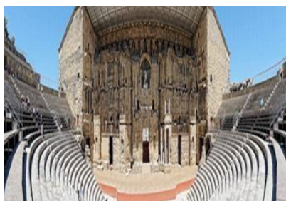
Εικόνα 8. Ρωμαϊκό θέατρο Οράνζ.