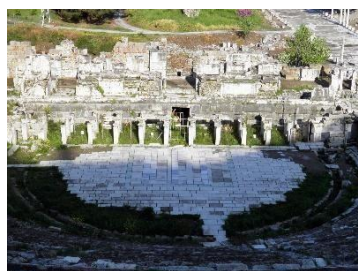
Εικόνα 7, Ελληνιστικό θέατρο Εφέσου

Το σημαντικότερο ρωμαϊκό αμφιθέατρο είναι το Κολοσσαίο (εικ. 12) αποτέλεσε την βάση στην δημιουργία σταδίων, οποίο διατηρεί το σημαντικότερο είδος αρχαίας ελληνικής αρχιτεκτονικής, το αμφιθέατρο, ενώ η αρχιτεκτονική του ιστορία περιλαμβάνει το λεγόμενο βελάριουμ . Δημιουργήθηκε από τον αυτοκράτορα Βεσπασιανό και είχε σαν στόχο την φιλοξενία μονομαχιών. Περιλαμβάνει 50.000 θέσεις, πλάτος 153 μέτρα, μήκος 158 μέτρα, και ύψος 50 μέτρα. Οι πρώτες μονομαχίες ήταν εκ των εκτων ετρούσκων . (Sear, 2006, Μποζιζίο 2006, Mezher, 2002, Τζοβλά & Χαρατσάρη 2012, Weltch, 2007, Nekrutenko, 2014 ).