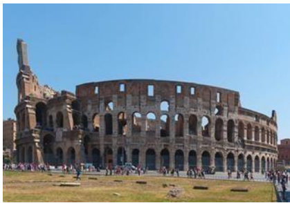
Εικόνα 12,ρωμαϊκό αμφιθέατρο Κολοσσαίο