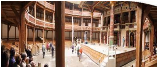
Εικόνα 16, εσωτερικό θεάτρου shakespeare's Swan