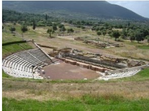
Εικόνα6 Αρχαίο θέατροΜεσσήνης.