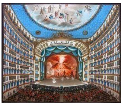
Εικόνα 13. όπερα Σαν Κάρλο, βάθος σκηνής

Σε αυτό το σημείο θα άξιζε να θυμηθούμε τον Σενέκα . Ο Σενέκας ήταν Ρωμαίος φιλόσοφος δραματουργός. Έγραψε λατινικές τραγωδίες βασισμένες στην αρχαία ελληνική τραγωδία, όπως <<Hercules>> <<Furens>>, <<Troades>>, <<Phoenissae>>, <<Medea>>, Phaedra, <<Oedipus>>, <<Agamemnon>>, and <<Thyestes>>, αλλά και το <<Octavia>> οποίο στηρίζεται σε γεγονότα που αφορούν την βασιλεία του Νέρωνα. Τα έργα του πιστεύεται πως έχουν ιστορική αξία. Επίσης ο Σενέκας έχει δημιουργήσει και διάφορα επιγράμματα, όπως το Κορσική. ( Found&Hartnoll,2000,Τρομάρας,2016,http://www.kvl.cch.kcl.ac.uk/THEATRON/biographys/bioseneca.html 25/04/2022 ). Διαθέσιμο διαδικτυακά Who was Seneca? Τρομάρας Α, 2016 ).