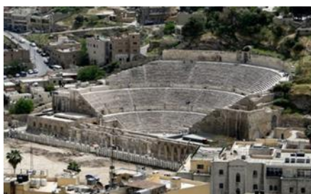
Εικόνα 9 Ρωμαϊκό θέατρο Αμμάν.