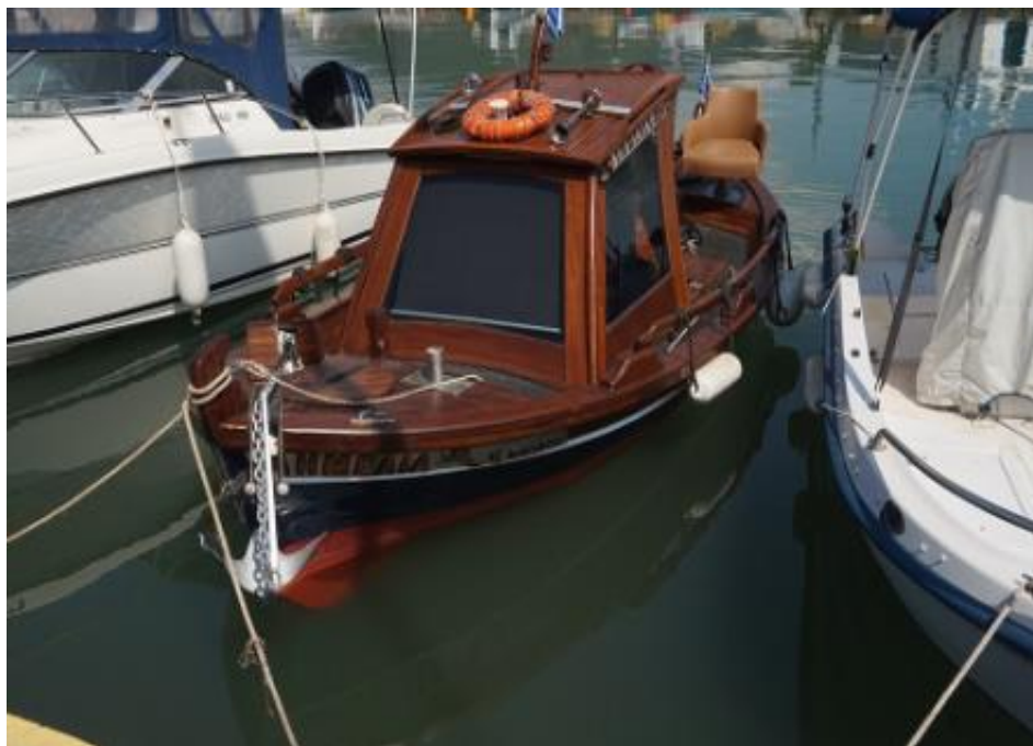
Δε θα μπορούσα να μην αναφέρω το μικρό περίτεχνο καφέ σκαφάκι που ξεχώριζε ανάμεσα στα άλλα κατάλευκα όχι μόνο γι' αυτό ,αλλά και για την τεράστια άγκυρά του που έλεγες ότι θα το βουλιάξει με το βάρος της.