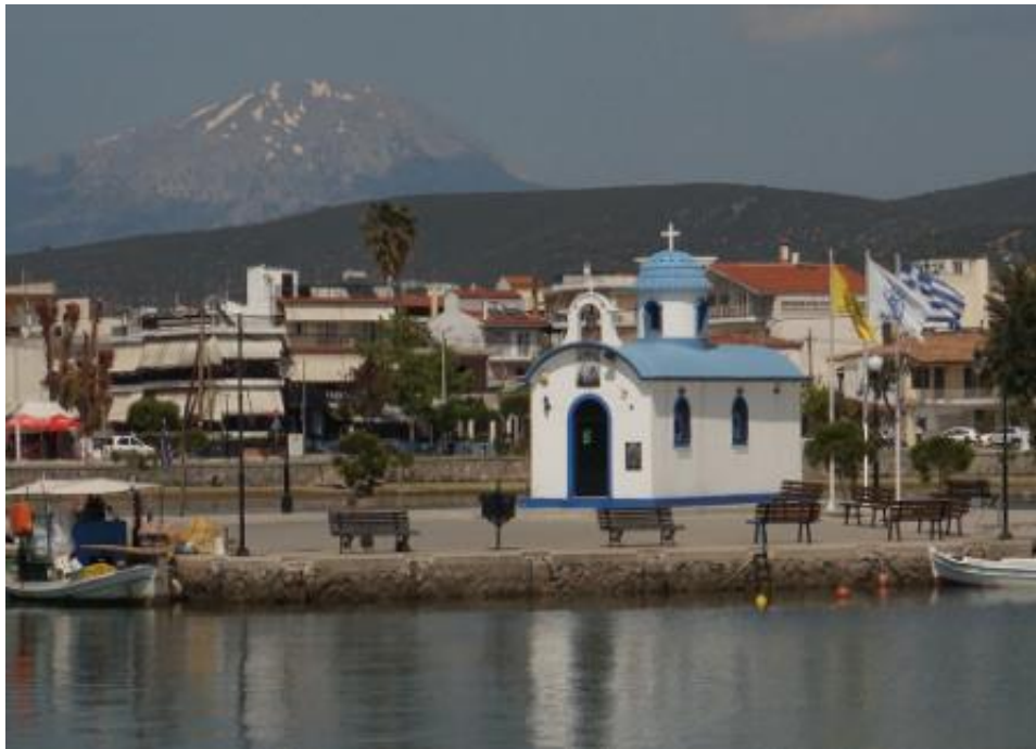
Ο άγιος Νικόλαος και το φάντασμα της Δίρφεως πίσω του.