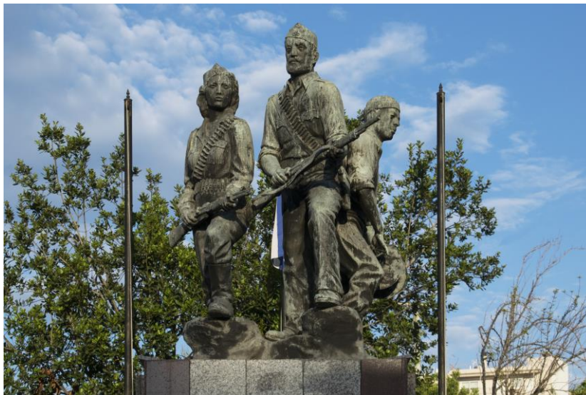
Εικόνα 16: Μνημείο Εθνικής Αντίστασης 1041-1944 για τον ΕΛΑΣ Γαλάτσι