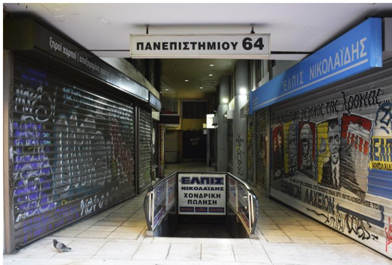
Εικόνα 11 : Πανεπιστημίου 64

Σήμερα, στη συγκεκριμένη οδό παρατηρούμε μια στοά που έχει την δική της ιστορία να αφηγηθεί και κρατάει φυλαγμένα μυστικά χρόνων, που αναγνωρίζουν μια βαριά μνήμη και μια σκοτεινή ιστορία. Σήμερα ένας απλός θεατής που περιηγείται στην οδό Πανεπιστημίου 64, δεν θα παρατηρήσει τίποτα ιδιαίτερο, εκτός από ένα εκκεντρικό πάτωμα από μωσαϊκό, φώτα και μαγαζιά της στοάς που μας μεταφέρουν σε μια διαφορετική πλευρά της πόλης.