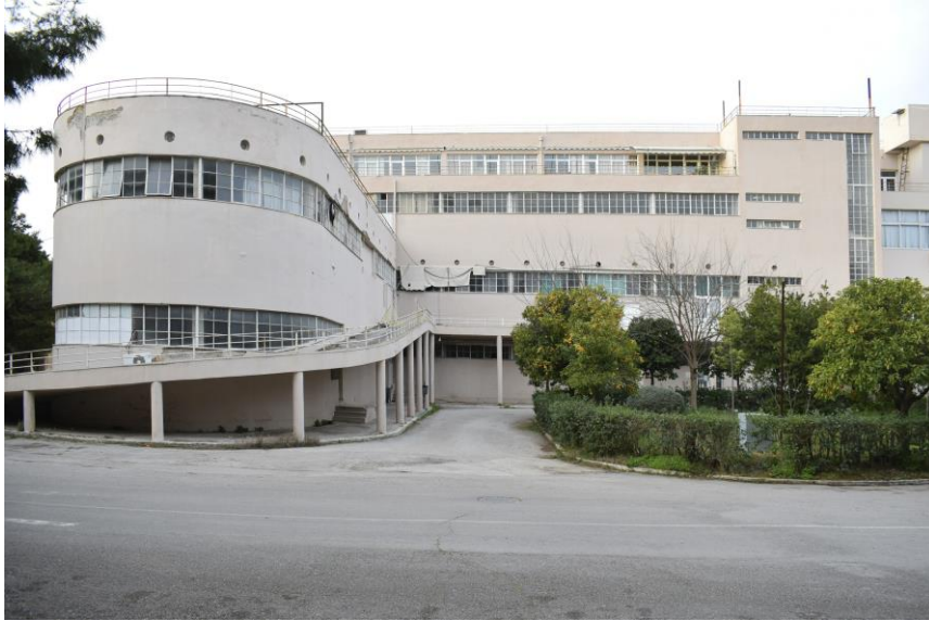
Εικόνα 8: Νοσοκομείο Σωτηρία