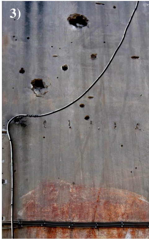
Εικόνες 1,2,3: Το Τρίπτυχο Δεκεμβριανών