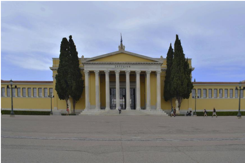
Εικόνα 4: Ζάππειο Μέγαρο, Εθνικός Κήπος