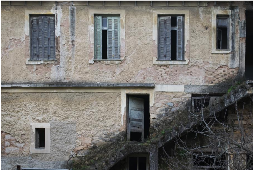
Εικόνα 9 : Μαγειρείο