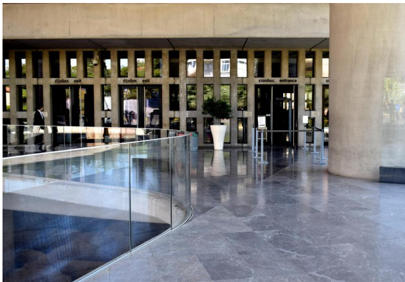
Εικόνα 5: Μουσείο Ακρόπολης

Ο εσωτερικός χώρος του μουσείου αποτελείται από έναν πυρήνα δομημένο από σκυρόδεμα. Γύρω από τον πυρήνα, αναπτύσσονται οι υπόλοιποι εκθεσιακοί του χώροι.