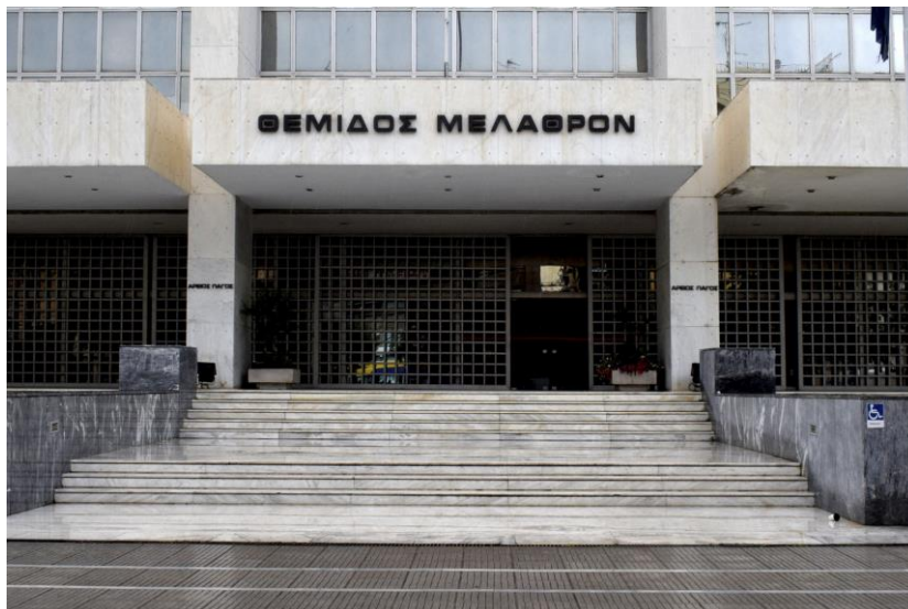
Εικόνα 7 : Θέμιδος Μέλαθρον