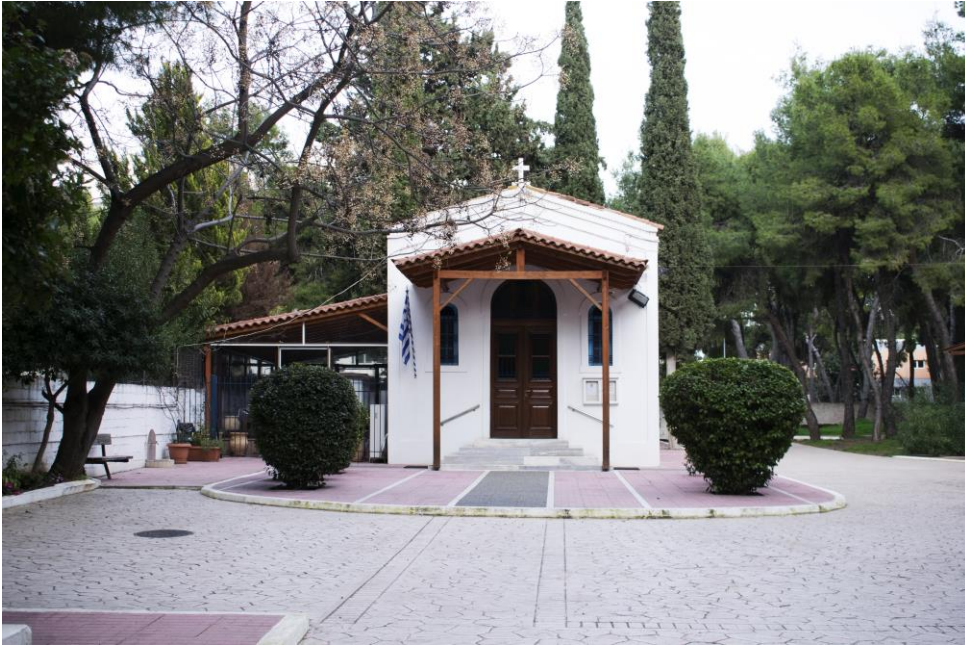
Εικόνα 10 : Ιερός Ναός Αγίας Σοφίας