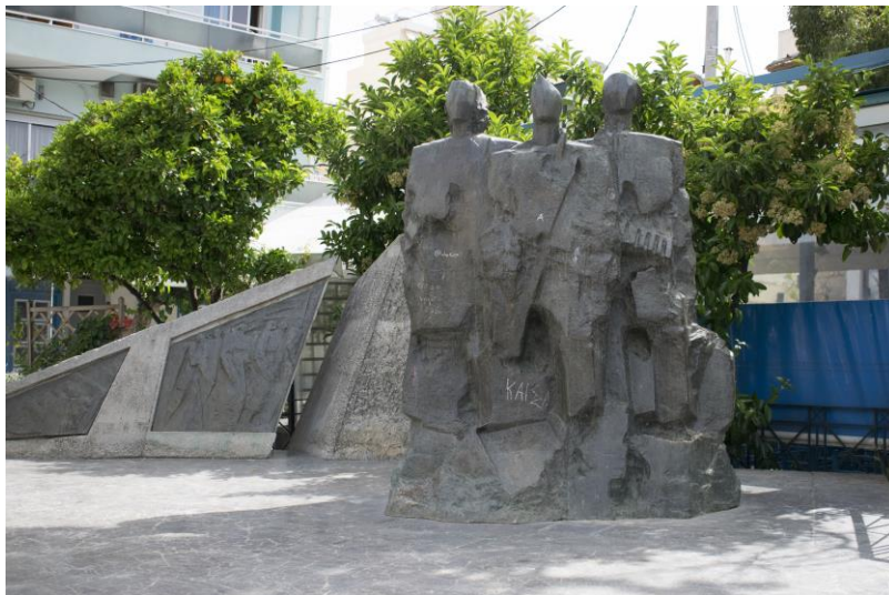
Εικόνα 13: Μνημείο Εθνικής Αντίστασης Δήμος Καισαριανής

Δημιουργεί τα έργα του χρησιμοποιώντας άλλοτε χαλκό κι άλλοτε γύψο ή τσιμέντο, προσδίδοντας μια υπερρεαλιστική διάσταση συνδέοντας το πραγματικό με το φανταστικό. Επίσης, ανάλογα με τα έργα του, μπορεί να χρησιμοποιήσει κάρβουνο, γύψο, ορείχαλκο, λεπτά καλάμια κ.ά., για να φτάσει στις ανάγλυφες κατασκευές ή στις γλυπτικές του φόρμες. Επιπροσθέτως, ο ίδιος πιστεύει ότι ένα γλυπτό σε δημόσιο χώρο (όπως στην ανάλογη περίπτωση) επικοινωνεί άμεσα με το κοινό, προβάλλεται και έχει παιδευτικό χαρακτήρα. Το συγκεκριμένο μνημείο ξυπνάει μνήμες της βίας και της τραγικής μοίρας των ανθρώπων που βίωσαν την τυραννία εκείνων οι οποίοι επιβουλεύτηκαν την ελευθερία και την αξιοπρέπεια.