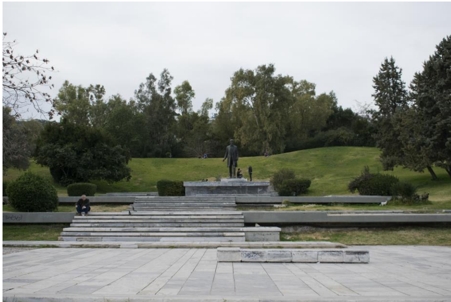
Εικόνα 12 : Πάρκο Ελευθερίας

Το άγαλμα του Ελευθέριου Βενιζέλου, δημιούργημα του Ιωάννη Παππά, είναι στο κέντρο της σύνθεσης και αποτελεί σημείο αναφοράς του Πάρκου Ελευθερίας.