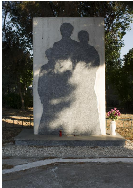
Εικόνα 14: Μνημείο Εκτελεσθέντων Πολιτών Δήμου Αιγάλεω ( 29.09.1944 )