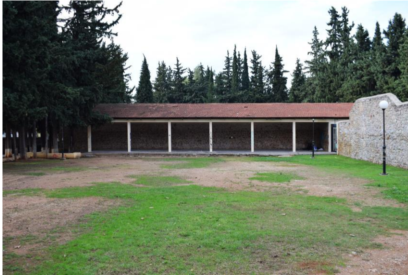
Εικόνα 6 Σκοπευτήριο Καισαριανής