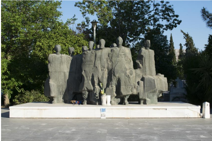
Εικόνα 15: Μνημείο Εθνικής Αντίστασης Δήμου Αιγάλεω