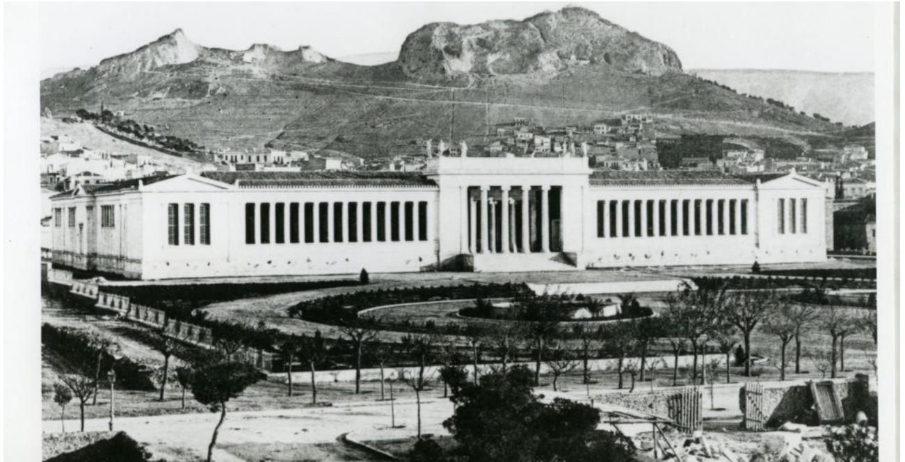
Εικόνα 13 Εθνικό Αρχαιολογικό Μουσείο, 1889

Το κτήριο έχει υποστεί αρκετές επεκτάσεις εκ των οποίων οι πιο σημαντικές ήταν η κατασκευή μιας νέας ανατολικής πτέρυγας στις αρχές του 20ού αιώνα, η οποία έγινε βασισμένη σε σχέδια του Αναστάσιου Μεταξά και η δημιουργία διώροφου κτηρίου σχεδιασμένου από τον Γεώργιο Νομικό τα έτη 1932 - 1939. Αυτές οι κατασκευές ήταν αναγκαίες ώστε να στεγάσουν την όλο και αναπτυσσόμενη συλλογή του μουσείου. Το 1962, το Εθνικό Αρχαιολογικό Μουσείο απέκτησε πέντε νέες αίθουσες, ενώ εκτέθηκε ύστερα από αναμονή πολλών μηνών ο περίφημος χάλκινος Κούρος του 6ου αι. π.Χ., ο οποίος είχε ανακαλυφθεί στον Πειραιά τον Ιούλιο του 1959 και θεωρείται από τα αριστουργήματα της αρχαϊκής περιόδου. Η πιο πρόσφατη ανακαίνιση διήρκεσε 1,5 χρόνο, κατά τον οποίο το μουσείο παρέμεινε εντελώς κλειστό. Επαναλειτούργησε τον Ιούλιο του 2004, έτοιμο πλέον για τους Ολυμπιακούς Αγώνες του 2004. Αυτή η ανακαίνιση περιελάμβανε την αισθητική και τεχνική αναβάθμιση του κτηρίου, την εγκατάσταση σύγχρονου κλιματισμού, καθώς και αναδιοργάνωση των συλλογών και επιδιόρθωση των ζημιών από το σεισμό του 1999. Η αίθουσα του Ακρωτηρίου Θήρας άνοιξε το 2005. Σήμερα υπάρχει νέα ανάγκη επέκτασης του μουσείου.