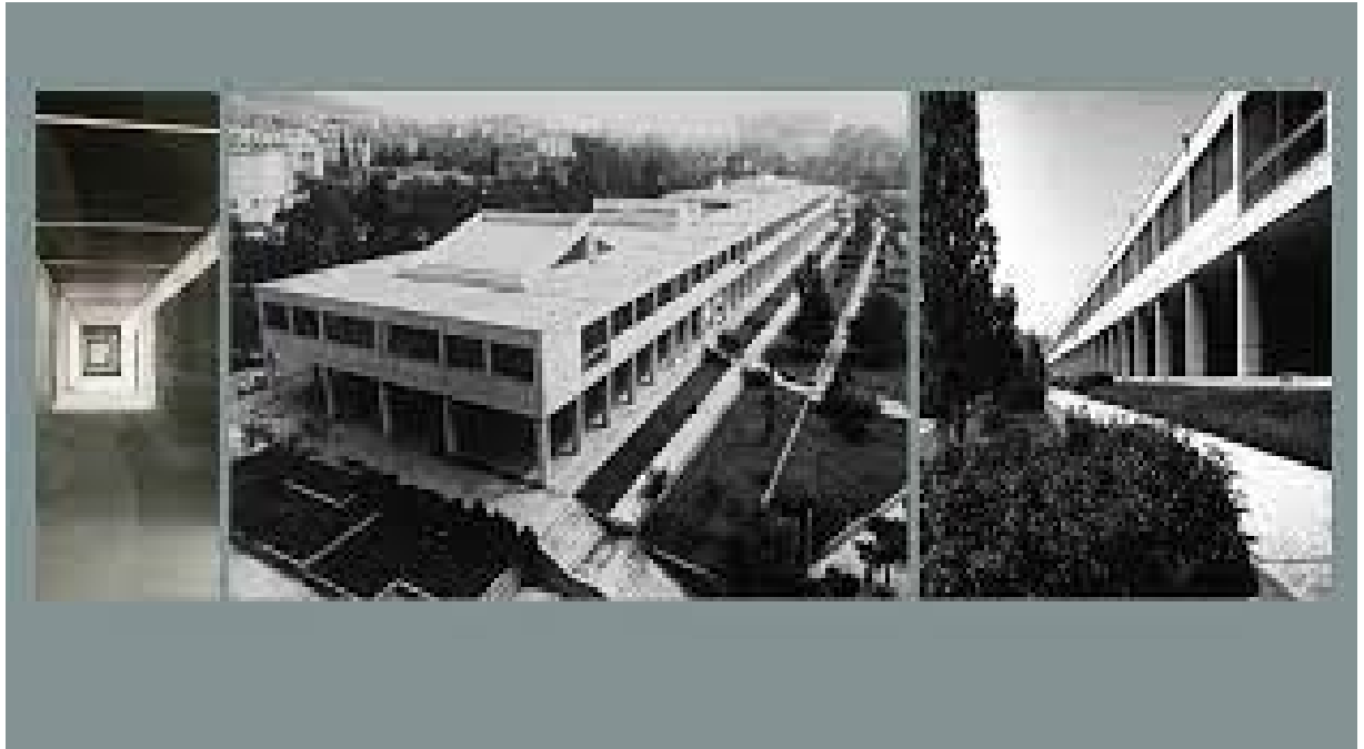
Εικόνα 24 Ωδείο Αθηνών

Η αρχιτεκτονική του κτιρίου απαρτίζεται ως εξής: η πρόσοψη του κτιρίου έχει μήκος 160 μέτρων και το κτίριο έχει μέγεθος 13.000 τ.μ. και αποτελεί ένα εξαιρετικό δείγμα της φιλοσοφίας της σχολής του Μπαουχάους και του μοντέρνου κινήματος στην Ελλάδα. Φανερά είναι τα στοιχεία αυτά στο κτίριο, ο κυβισμός και το εμφανώς τετράγωνο σχήμα στο άνω μισό κομμάτι του κτιρίου, όπως παρατηρήθηκε προηγουμένως και στο πολεμικό μουσείο. Αρχιτέκτονας ήταν ο Έλληνας Γεωργίου Δεσποτόπουλος, ο μόνος Έλληνας αρχιτέκτονας που σπούδασε υπό την επίβλεψη του ιδρυτή της σχολής, Γκρόπιους. Το ωδείο είναι το μόνο ολοκληρωμένο μέρος ενός μεγάλου πολιτιστικού προγράμματος που αποφασίστηκε επίσημα το 1959 από την κυβέρνηση για την πόλη της Αθήνας. Η κατασκευή του άρχισε το 1969 και σταμάτησε το 1976 λόγω έλλειψης χρηματοδότησης, η κατασκευή δεν ολοκληρώθηκε, και το ελληνικό δημόσιο ανέλαβε το δαπανηρό κόστος για την ολοκλήρωση των εργασιών μόλις το 1980.