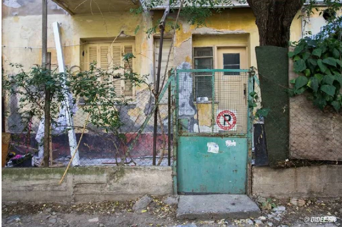
Εικόνα 22 Αυτοσχέδια αυλή στο ισόγειο κτιρίου, Βασίλης Νικολόπουλος

Λάσκαρι, κάθε κτίριο έχει τρεις ορόφους, άλλα παρόλη την έκταση αυτή η ανάγκη για παραπάνω χώρο παρέμενε, με τους πρόσφυγες να προβαίνουν σε λύσεις όπως τη δημιουργία αυλών στα κενά σημεία ανάμεσα από τα κτίρια.