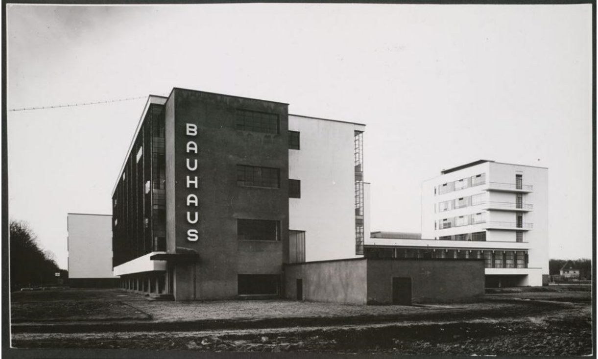
Εικόνα 15 Bauhaus, Dessau

η ίδια η πρώτη ύλη περιέχει ένα είδος φυσικής και εγγενούς διακοσμητικής ικανότητας.