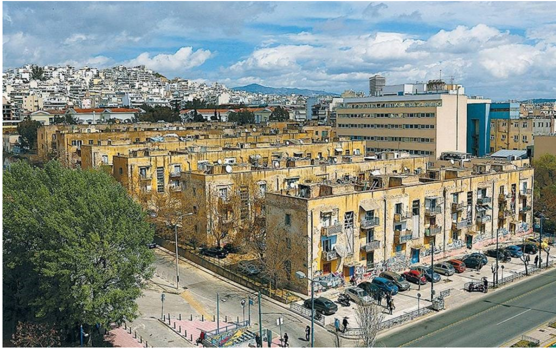
Εικόνα 20 Προσφυγικά Λεωφόρου Αλεξάνδρας