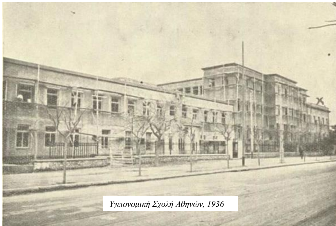
Υγειονομική Σχολή Αθηνών, 1936

Ο σκοπός της ίδρυσης της σχολής ήταν να εφαρμοστεί το Υγειονομικό Πρόγραμμα,