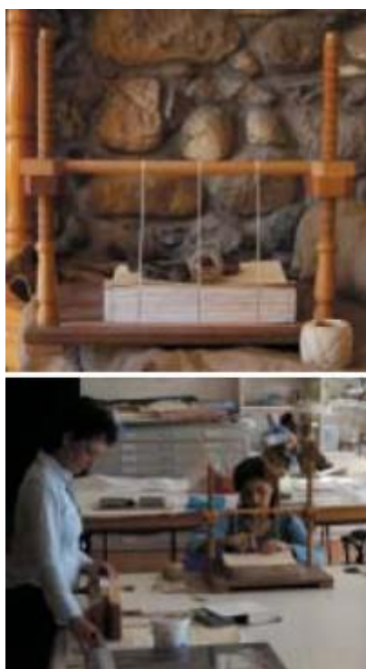
Εικόνα Νο.1 – Βιβλιοδεσία με «τεζάκι»

Κατά την βυζαντινή στάχωση δεν χρησιμοποιείται η μέθοδος με το «τεζάκι» καθώς έχει τελείως διαφορετική φιλοσοφία και πρακτική από την Ευρωπαϊκή βιβλιοδεσία. Στις μέρες μας όσοι ασχολούνται με την βιβλιοδεσία χρησιμοποιούν την Ευρωπαϊκή στάχωση και είναι ελάχιστοι οι τεχνίτες οι οποίοι γνωρίζουν τον «Βυζαντινό» τρόπο.