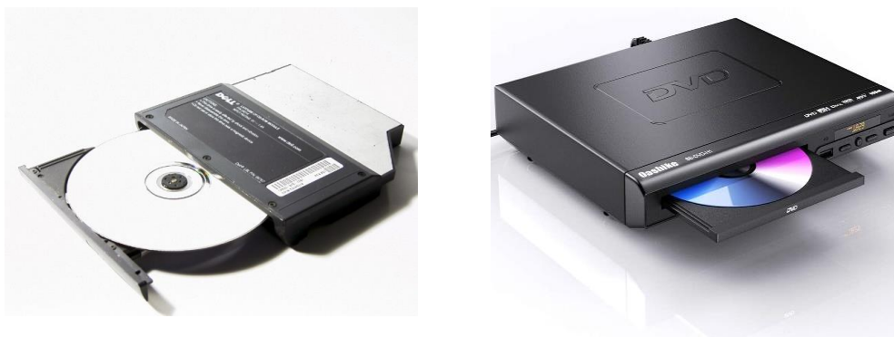
Εικόνα Νο.4 – Μορφές CD-ROM και DVD

Πληροφορίες και ενημερώσεις παρέχουν στην σημερινή εποχή, τα νέας μορφής ηλεκτρονικά μέσα, μαζί με τα έντυπα, την τηλεόραση και το ραδιόφωνο. Επιπλέον αποτελούν και μέσο εκπαίδευσης.