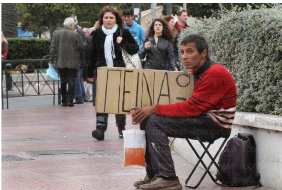
Εικόνα 10: Άστεγος στο κέντρο της Αθήνας