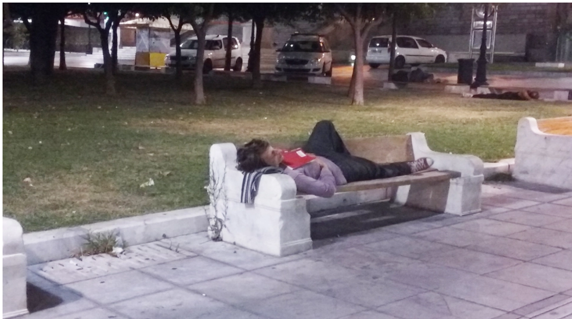
Εικόνα 5: Άστεγος στο κέντρο της Αθήνας