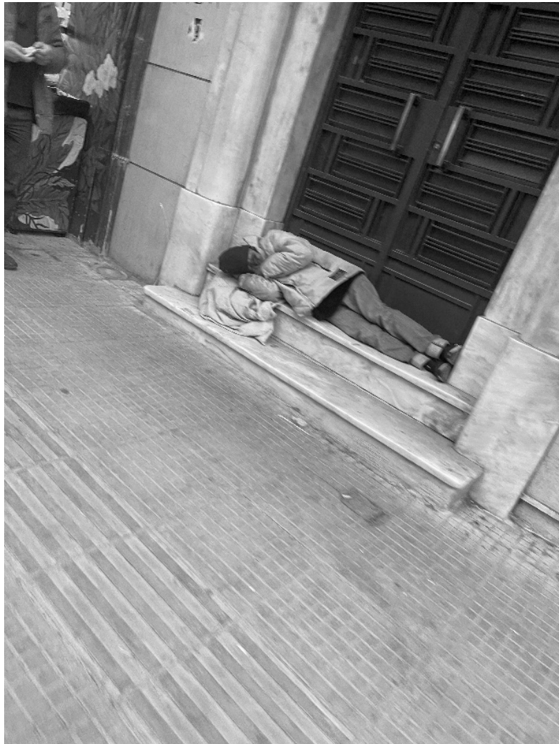
Εικόνα 1: Άστεγος στην οδό Αγίου Μελετίου

Keywords: Homeless, social exclusion, crisis, vulnerable groups, residence.