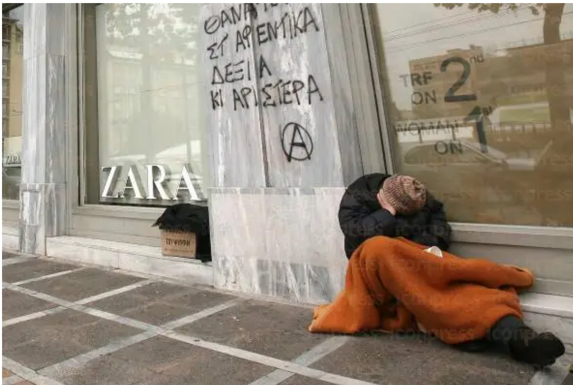
Εικόνα 2: Άστεγος στο κέντρο της Αθήνας

Σύμφωνα με στοιχεία της Ελληνικής Στατιστικής Αρχής (ΕΛΣΤΑΤ), το 2009 το 9,7% ήταν άνεργοι, το 27,6% του πληθυσμού αντιμετώπιζε κίνδυνο φτώχειας ή κοινωνικού αποκλεισμού, ενώ το 2013 τα ποσοστά έφτασαν το 27,5 % και το 25,7 % αντίστοιχα. Σε χιλιάδες, για το έτος 2013, ο πληθυσμός των ανέργων έφτασε τις 441, 986 για τους άνδρες και 450,750 για τις γυναίκες, σε ποσοστά 16,2 % και 21,4 % αντίστοιχα. Το ίδιο έτος, νοικοκυριά αντιμετώπιζαν δυσμενείς συνθήκες διαβίωσης και συγκεκριμένα μελετήθηκαν τα εξής προβλήματα: θόρυβος (24,5%), διαρροή σε στέγη, υγρασία σε τοίχους, πατώματα, στις κάσες στα παράθυρα (13,9 %), σκοτεινά δωμάτια (7,1 %), έλλειψη λουτρού ή μπάνιου (0,9 %) και έλλειψη εσωτερικής τουαλέτας 0,7 %. Το 2014 το ποσοστό του πληθυσμού που αντιμετώπιζε κίνδυνο φτώχειας ή κοινωνικό αποκλεισμό ανήλθε στο 36,0 %.