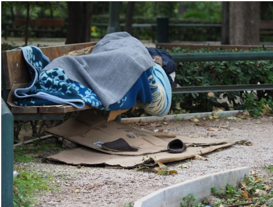
Εικόνα 3: Άστεγος στο κέντρο της Αθήνας

Στην Ελλάδα, οι άστεγοι πολύ πρόσφατα με το Ν.4052/12 αναγνωρίστηκαν θεσμικά ως ειδική-ευάλωτη κοινωνική ομάδα η οποία χρήζει ειδικών μέτρων προστασίας. Ωστόσο, μέχρι και σήμερα η πλειονότητα των υπηρεσιών αφορούν φιλανθρωπικού τύπου παροχές ενώ την ίδια στιγμή δεν υπάρχει καμία θεσμοθετημένη δράση η οποία να αφορά στην πρόληψη του φαινομένου και κυρίως στην ένταξη των αστέγων στην αγορά εργασίας και στην αποκατάστασή νέο στον κοινωνικό ιστό. (Αντωνοπούλου, 2013).