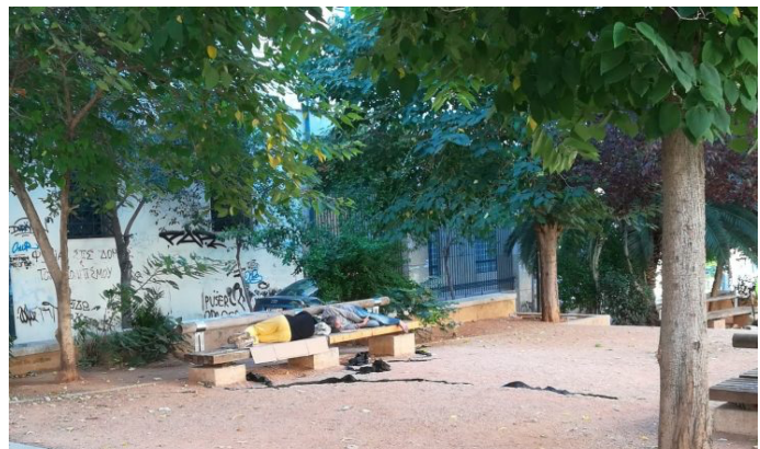
Εικόνα 6, 7: Άστεγοι στο κέντρο της Αθήνας