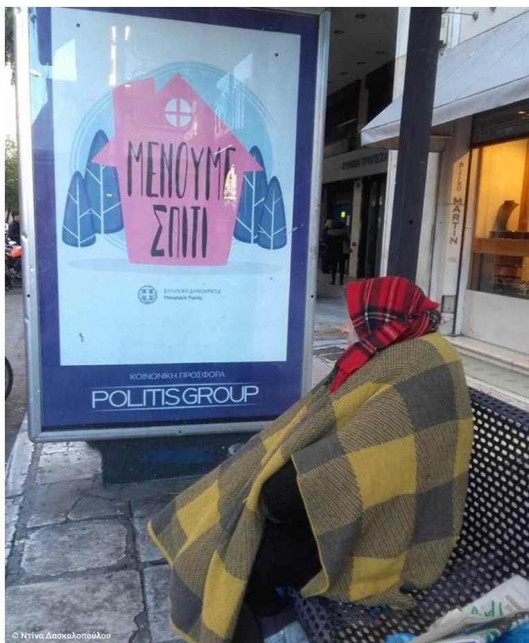
Εικόνα 5: Άστεγη στο κέντρο της Αθήνας

Από την άλλη μεριά, η Σχολή του Σικάγο, επικεντρώθηκε στη θεωρία της κοινωνικής δομής (social structure), τη θεωρία του δομολειτουργισμού, τη θεωρία της συμβολικής διαντίδρασης (interactionnisme symbolique) και τη θεωρία της παρέκκλισης (deviance). Αποτέλεσε το πρώτο συστηματικό κοινωνιολογικό ρεύμα σκέψης. Η εξέλιξη της γαλλικής, γερμανικής και αμερικανικής κοινωνιολογίας μετεξέλιξαν το περιεχόμενο και τη χρήση τους εννοιών όπως αυτών της ενσωμάτωσης και του αποκλεισμού, χαρακτηρίζοντας μία σειρά από σύγχρονα φαινόμενα της νεωτερικότητας και της μετανεωτερικότητας. Έτσι, στις έννοιες αυτές δόθηκε μία σύνθετη ερμηνεία ή περισσότερες της μιας ερμηνείες, ούτως ώστε να συμπεριλάβουν πολλαπλά επίπεδα αναλυτικής προσέγγισης των κοινωνικών φαινομένων, αλλά και να ανταποκριθούν σε ερευνητικές ανάγκες. Οι έννοιες αυτές απέκτησαν ισχύ ακόμη μεγαλύτερη από το παρελθόν και τέθηκαν ως έννοιες-κλειδιά χωρίς όμως την επιστημονική βάση ενός και μοναδικού ορισμού (concept, horizon). Υπάρχουν τρεις βασικές προσεγγίσεις θεματικής ανάλυσης που αποτυπώνονται σε τρεις άξονες, αναφορικά με την κατανόηση του κοινωνικού αποκλεισμού ως έννοια: πρώτος: «Αναπαραγωγή των κοινωνικών ανισοτήτων», δεύτερος: «Απώλεια των ανθρωπίνων δικαιωμάτων» και τρίτος «Χαλάρωση και διάρρηξη