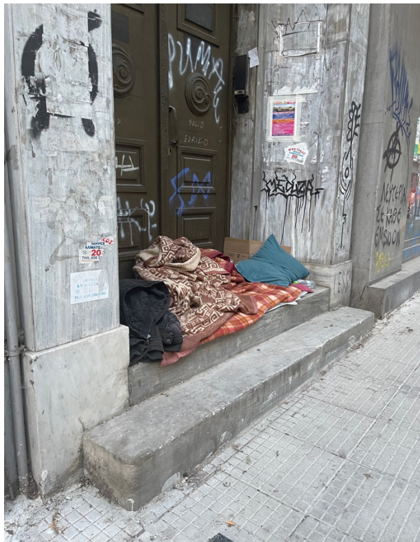
Εικόνα 4: Χώρος διαμονής αστέγου στην οδό Αγίου Μελετίου

Η βάση του ορισμού της κοινωνικής ενσωμάτωσης ο οποίος έχει υιοθετηθεί από τις επίσημες ευρωπαϊκές πολιτικές, παρουσιάζει την έννοια της συμμετοχής (participation) στους κοινωνικούς και πολιτικούς θεσμούς. Η κοινωνική ευπάθεια, μία έννοια που έχει ήδη προσδιοριστεί θεωρητικά αλλά και εμπειρικά, είναι αυτή η οποία διαφοροποιείται σαφώς από την έννοια του κοινωνικού αποκλεισμού. Η κοινωνική ευπάθεια μπορεί να συνδέεται με κάποια συγκεκριμένα χαρακτηριστικά τα οποία καταγράφονται με σχετική σαφήνεια, ορίζοντας τις ευπαθείς κοινωνικά ομάδες. οι ομάδες αυτές χαρακτηρίζονται ως τέτοιες λόγω του υψηλού ρίσκου κοινωνικού αποκλεισμού που αντιμετωπίζουν.