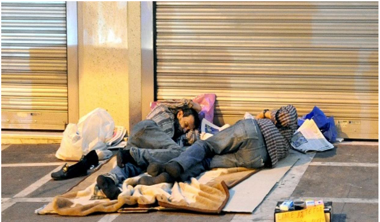
Εικόνα 8: Άστεγοι στο κέντρο της Αθήνας

Η αντίληψή μας για το σπίτι εδράζεται στη γλώσσα, και η γλώσσα είναι στενά συνδεδεμένη με τη σωματική ύπαρξη, Για παράδειγμα, κάποιος σκέφτεται και ομιλεί για το «Δωμάτιό του». Είναι εξαιρετικά δύσκολη η εμπειρία για κάποιος όταν αναγκάζεται να ζήσει σε ένα χώρο που δεν τον αναγνωρίζει ως έναν προσωπικό χώρο, ο οποίος προσδίδει την αίσθηση της ασφάλειας και της κανονικότητας. Το σπίτι είναι ο προσωπικός μας χώρος, εκεί όπου εδράζονται οι προσωπικές νοητικές και ψυχικές εμπειρίες, οι οποίες δεν είναι ορατές. Πιο συγκεκριμένα, ο ρόλος του σπιτιού αφορά την οριοθέτηση ανάμεσα στο ιδιωτικό και στο δημόσιο, τη διαφάνεια. Η ιδιωτικότητα είναι άμεσα συνυφασμένη με την έννοια του σπιτιού. Το σπίτι, μοιάζει να είναι ένα καταφύγιο για το σώμα μας και για τη συνολική συγκρότηση του ατόμου: αφορά την προσωπική μας οικειότητα. (Pallasmaa, 2021:141).