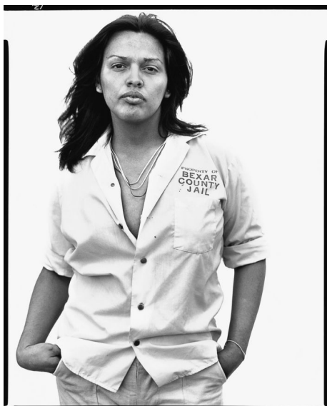
Εικ.5 In The American West, Richard Avedon

Παρόλο αυτά, λόγω της προϋστορίας του ίδιου με σκηνοθετημένες φωτογραφίες μόδας και αστέρων του Hollywood, δημιουργούνται εύλογα διάφορες αμφιβολίες ως προς τη συναισθηματική ανάγκη του έργου. Ουσιαστικά, ο Avedon ακροβατεί ανάμεσα σε δύο διαφορετικούς κόσμους ή πιο σωστά σε δύο αποκλείουσες μεταξύ τους κοινωνικές τάξεις. Το γεγονός αυτό, ομολογουμένως, παρακινεί διαφόρων ειδών υποψίες για τις προθέσεις του. Ωστόσο, θα ήταν άδικο για τον ίδιο να να επαινείται μόνο για τις φωτογραφίες του στο χώρο της μόδας, καθώς τα πιο προσωπικά του έργα και με χαρακτηριστικό παράδειγμα τις φωτογραφίες που τράβηξε τον ετοιμοθάνατο πατέρα του είναι εντελώς κόντρα στην αισθητική και τις επιταγές αυτής.