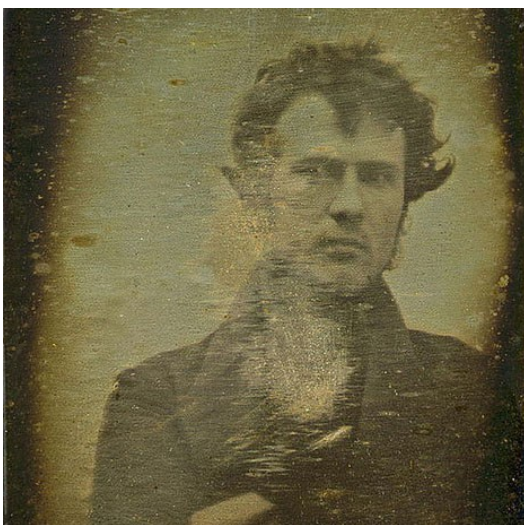
Εικ.2 Self Portrait, Robert Cornelius