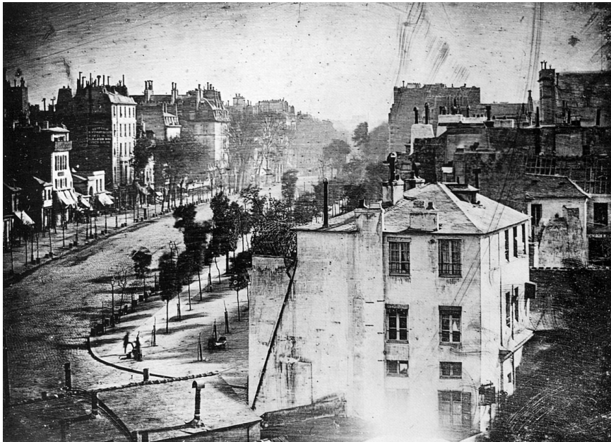
Εικ.1 Bullevard du Temple, Luis Daguerre

Αρχικά, υπήρχαν πολλές δυσκολίες σε αυτή τη μέθοδο και ιδίως στο κομμάτι της χρηστικότητάς της. Συγκεκριμένα, οι ασημένιες πλάκες που χρησιμοποιούνταν έπρεπε πρώτα να εκτεθούν σε ατμούς ιωδίου. Επιπλέον, η εικόνα έπρεπε να εμφανίζεται αμέσως μετά την έκθεσή της στο ηλιακό φως. Όσον αφορά τα πορτραίτα, η διάρκεια της πόζας που απαιτούνταν ήταν πολύ μεγάλη, τα μοντέλα ίδρωναν και στα πρόσωπά τους κυλούσαν σταγόνες αλλοιώνοντας το μακιζιάζ. Όλα αυτά, βεβαίως, αναπαράγονταν στο τελικό αποτέλεσμα. Ωστόσο, με το πέρασμα του χρόνου και την ασχολία και άλλων επιστημόνων με τη δαγκεροτυπία, γίνανε διάφορες τελειοποιήσεις που μείωναν αφενός το βάρος των συσκευών, αφετέρου το κόστος των πλακών. Το γεγονός αυτό οδήγησε, επίσης, στη μείωση του χρόνου της πόζας. Το 1839, που πρωτοδημοσιοποιήθηκε η φωτογραφία, ο αναγκαίος χρόνος έκθεσης της πλάκας στο δυνατό φως του ηλίου ήταν 15 λεπτά, ενώ τρία χρόνια αργότερα, το 1842, δεν απαιτούνταν παραπάνω από είκοσι ή σαράντα δευτερόλεπτα.