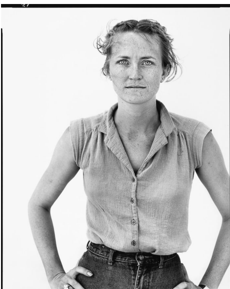
Εικ.6 In The American West, Richard