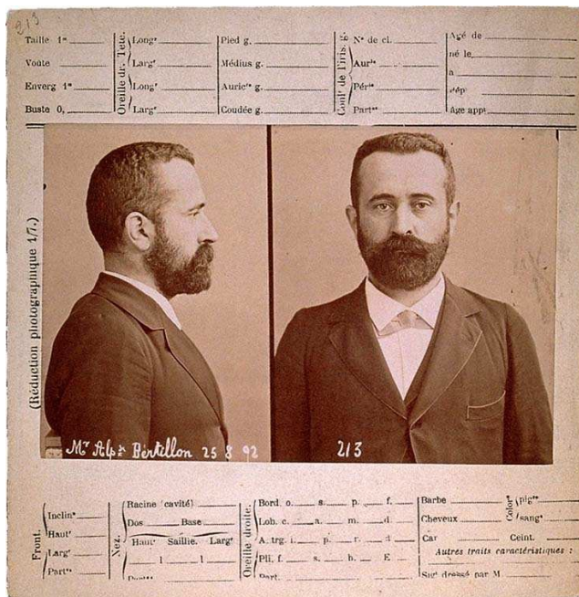
Εκ.3 Anthropometry Card, Alphonse Bertillon