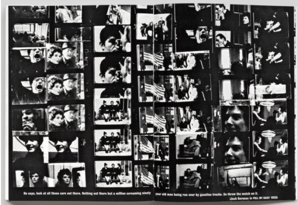
Εικόνα 30 Robert Frank, book: Lines of My Hand.

Η επιλογή παρουσίασης της δουλειάς μου ήταν το Photobook. Με αυτόν τον τρόπο μπορώ να παρουσιάσω τις εικόνες σαν να βλέπει κανείς οικογενειακό άλμπουμ, γυρνώντας τις σελίδες μια προς μια. Τα δίπτυχα που έχω επιλέξει από κάθε λήψη να δείξω, αποκαλύπτουν μία πιο γενική εικόνα