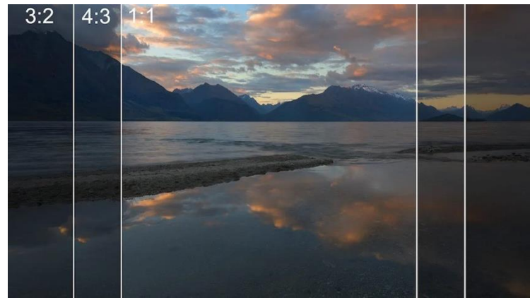
Εικόνα 14 ALL RIGHTS RESERVED BY ADORAMA.COM / IMAGE USED IN ARTICLE FOR ASPECT RATIO IN PETER;S DAM ARTICLE, PUBLISHED

παραγωγής και δημιουργίας του συνολικού έργου. Το τετράγωνο κάδρο και φορμάτ, είναι τύπος φιλμ και οι διαστάσεις του είναι συνήθως 6x6cm ή 6x4,5cm ή αλλιώς 1:1, γεγονός που δηλώνει την ίση απόσταση πλευρών, μήκους και πλάτους του φωτογραφικού κάδρου. Αρχικά ήταν δημοφιλείς στις κάμερες μεσαίου φορμάτ και μερικές μηχανές από αυτές είναι η Hasselblad και η Rolleiflex.