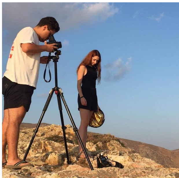
Εικόνα 22 Προσωπικό αρχείο-ΜΠΑΡΙΤΑΚΗΣ ΕΙΡΗΝΑΙΟΣ-ΙΩΑΝΝΗΣ, 2023.

που διεξήχθη η φωτογράφιση με αναλογικά μέσα, είναι ότι οι εικόνες από τις οποίες εμπνεύστηκα είναι παλιές αναμνηστικές εικόνες από την γενιά των παππούδων μου και της μητέρας μου και αποτελούν κομμάτι της ιστορίας, λόγω των ορυχείων των μεταλλίων της Σερίφου. Οι συγκεκριμένες εικόνες, αποτελούν ντοκουμέντα της σκληρής καθημερινότητας και του τρόπου ζωής των ανθρώπων στο νησί εκείνη την εποχή. Τα