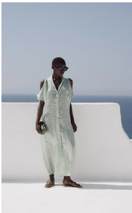
Εικόνα 17

μήνυμα σε κάθε περίπτωση. Πιο συγκεκριμένα, οι πόζες και η γλώσσα του σώματος, αλλάζουν από έναν κατάλογο, σε ένα editorial μόδας και από ένα πορτραίτο σε μία διαφημιστική καμπάνια. Το πως θα νιώθουμε, το πότε και πως πρέπει να φοράμε τα