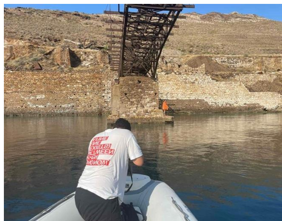
Εικόνα 27