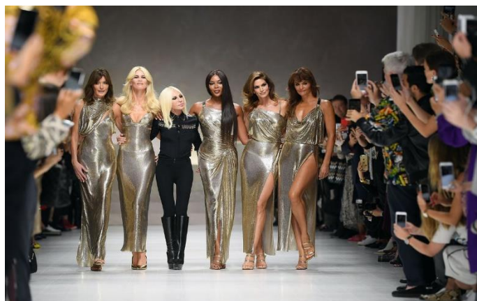
Εικόνα 13 ALL RIGHTS RESERVED BY GETTY IMAGES, VERSACE SHOW SEPTEMBER 2017-TRIBUTE TO MEMORY OF GIANNI VERSACE

Ακόμη η αναμνηστική φωτογραφία αποτελεί ένα ακόμη «παραθυράκι» που μας βοηθά να αναβιώσουμε καταστάσεις που ζήσαμε κάποτε ή δεν ζήσαμε ποτέ, όπως στην συγκεκριμένη περίπτωση 20 . Αυτή είναι και η αιτία, που εσκεμμένα επέλεξα να φωτογραφίσω με αναλογική κάμερα και έγχρωμο φιλμ, προσπαθώντας να μιμηθώ τον τρόπο που αποτυπώνανε τον άνθρωπο μέσα σε ένα κάδρο, δημιουργώντας μια παύση μέσα στο χρόνο. Εάν για αυτή την προσέγγιση γινόταν χρήση της ψηφιακής φωτογραφίας και όχι της τότε παραδοσιακής αναλογικής φωτογραφίας θα ήταν σαν κανείς να προσβάλλει αυτήν την αποφασιστική, μη επανάληψη, διαδικασία, που δεν επιτρέπει λάθη. Τα άπειρα κλικ, που επιτρέπει μια ψηφιακή κάμερα απομακρύνουν από την πιο απλοϊκή αλλά αυστηρή και ιδιαίτερα προσεκτική διαδικασία φωτογράφισης του παρελθόντος. Το συγκεκριμένο πρότζεκτ πρόκειται για μια «χειρονομία