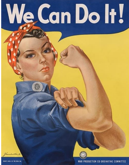
Εικόνα 16 J. Howard Miller's "We Can Do It!" poster from 1943

ένταση, λογική και ισότητα 23 . Πρόκειται για λέξεις και έννοιες, που βοήθησαν να σχηματίσω το φως, να επανεξετάσω και να οριοθετήσω τον όγκο του φυσικού τοπίου και να δώσω κίνηση, ζωντάνια και σχήμα στο ρούχο μέσα από κατά τ' άλλα στατικές πόζες. Η διαδικασία αυτή λειτούργησε υπέρ της συγκεκριμένης πτυχιακής, καθώς δίνει την αίσθηση της ομοιομορφίας και την ψευδαίσθηση ότι τα