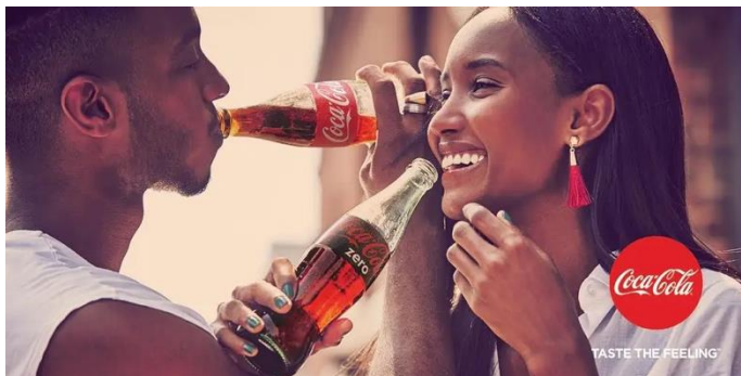
Εικόνα 18

Σε παλιότερες δεκαετίες παρατηρούσαμε μία μεγαλύτερη κλίση στην αφύσικη και επιτηδευμένη, υπερβολική πόζα. Φαίνεται όλα να είναι υπερβολικά στημένα και ορισμένα, σε πλήρη έλεγχο. Σε συνδυασμό με την γωνία λήψης του φωτογράφου, ακολουθώντας την εξέλιξη της ιστορίας του ρούχου, κατέληξε να συμβολίζει την απελευθέρωση, την ανάδειξη του πλούτου την δύναμη την κοινωνική τάξη και θέση. Χέρια με έντονες κινήσεις και γωνίες, πόδια στον αέρα, σχήματα στα σώματα αφύσικα και εκφράσεις θεατρικές, χαρακτήριζαν την φωτογραφία μόδας, δημιουργώντας αυτήν την ανάγκη από το τέλος του 2 ου Παγκοσμίου πολέμου μέχρι και τις αρχές του 2000.