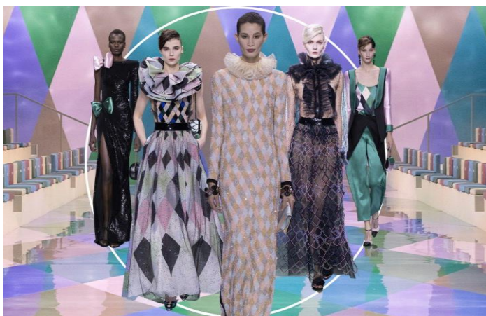
Εικόνα 3

Πέρα από τον απλό φωτογράφο, υπάρχει και ο πιο εξειδικευμένος φωτογράφος μόδας, ο οποίος ειδικεύεται στην φωτογράφιση ρούχων, αξεσουάρ, κοσμημάτων πάνω σε κάποιον άνθρωπο, συνήθως μοντέλο. Ένας φωτογράφος μόδας, χρησιμοποιεί συγκεκριμένες τεχνικές γνώσεις και υλικά για να φωτογραφίζει το αντικείμενο. Μέσα από τον τρόπο που θα φωτίσει το θέμα του, είτε με φυσικό, είτε με τεχνητό φως, δηλαδή flash studio ή led φώτα, την επιλογή ενός φόντου ( background), το χρώμα, την υφή του, το υλικό κατασκευής του, τον όγκο του, όπως επίσης, τη στάση του σώματος (πόζα) και την ομάδα ανθρώπων που επιλέγει, θα δημιουργήσει μια ιστορία που θα συνεπάρει τον αποδέκτη. Σκοπός του είναι να τον κάνει να δει ταυτόχρονα και το προϊόν μεμονωμένα αλλά πολλές φορές και το μήνυμα που κρύβει μέσα της μια εικόνα. Μερικοί από τους πιο διάσημους φωτογράφους μόδας που άσκησαν μεγάλη επίδραση, είναι οι Mario Testino, Steven Meisel, David LaChapelle, William Klein, Tim Walker, Richard Avedon, Irving Penn, Helmut Newton, Paolo Roversi, Peter Lindbergh, Tassos Vrettos, Nikos Papadopoulos, Panos Giannakopoulos, Dimitris Skoulos, Giorgos Malekakis. Οι δύο φωτογράφοι ωστόσο που άσκησαν την κυριότερη επίδραση στην παρούσα εργασία είναι η Mara Desipris και η Annie Leibovitz.