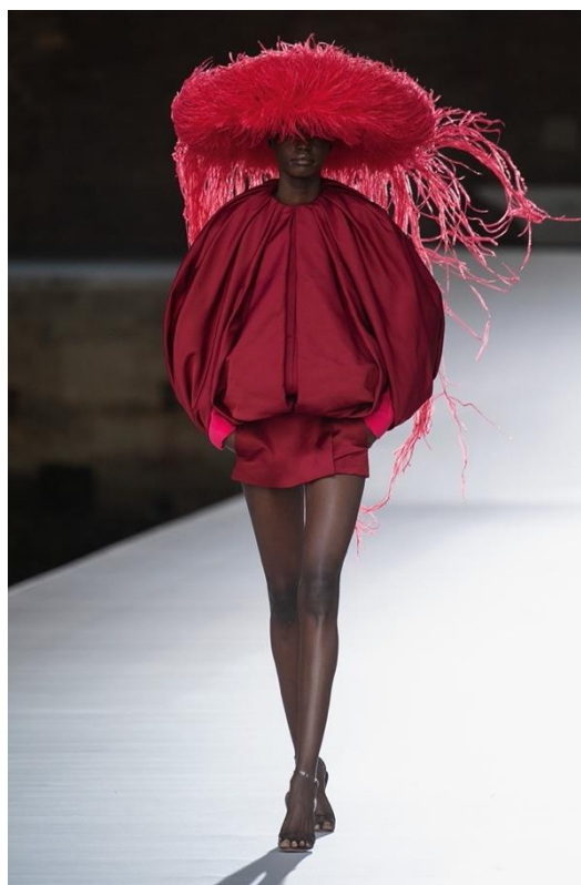
Εικόνα 1 Valentino A/W21 Haute Couture

Η υψηλή ραπτική είναι ένας όρος που χρησιμοποιείται για να περιγράψει την πιο πολυτελή κατηγορία μόδας, η οποία περιλαμβάνει τη δημιουργία υψηλής ποιότητας, χειροποίητων ενδυμάτων από κορυφαίους σχεδιαστές μόδας, σε