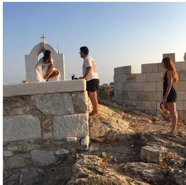
Εικόνα 26

Παρόλο που είχαν γίνει δοκιμαστικές λήψεις, ήταν διαφορετική η διαδικασία με την αναλογική κάμερα καθώς έπρεπε να είμαι ακριβής και συγκεκριμένα τοποθετημένος απέναντι από το μοντέλο, χωρίς να χάσω καθόλου από την σύνθεση, την έκφραση και την πόζα του. Η φωτομέτρηση δεν γινότανε μόνο από την ψηφιακή κάμερα αλλά και από εξωτερικό φωτόμετρο που μετρούσε το διαθέσιμο φως. Προς τα μέσα των λήψεων, το