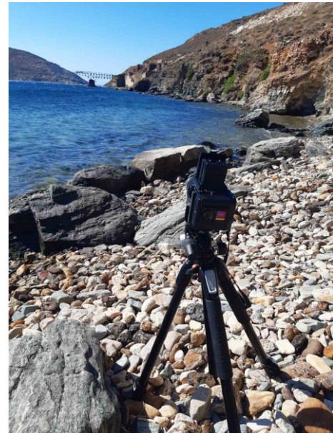
Εικόνα 20 Προσωπικό αρχείο-ΜΠΑΡΙΤΑΚΗΣ ΕΙΡΗΝΑΙΟΣ-ΙΩΑΝΝΗΣ, 2023.

μια κοπέλα που έχουμε μεγαλώσει μαζί όλα τα καλοκαίρια από την αρχή της ζωής μας, στο νησί της Σερίφου. Πέρα από το ότι κατανοεί πνευματικά, συναισθηματικά και πρακτικά την φύση της πτυχιακής, συνδέεται και η ίδια με το κομμάτι της ανάμνησης και την έννοια της Μούσας, κάνοντας το τοπίο και τα ρούχα πρωταγωνιστές, και όχι τον εαυτό της, την ενσάρκωση της έννοιας της σύγχρονης ομορφιάς.