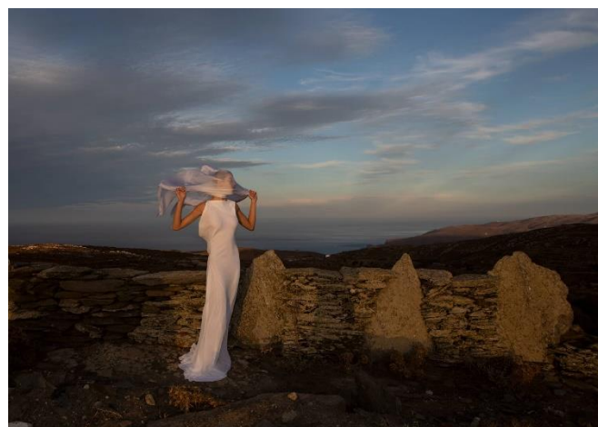
Εικόνα 9

Ο Άγγελος Μπράτης χρησιμοποιεί τα υφάσματα σαν ένα δεύτερο δέρμα, αγκαλιάζοντας κάθε σώμα διαφορετικά, αποδίδοντας την εικόνα της γυναίκας, σαν αρχαία Ελληνίδα θεά ( Μούσα) με μια αίσθηση ανάλαφρη. Η όλη ιδέα πίσω από τα υφάσματα και τις υφές, ήταν τόσο οι αντιθέσεις που προκαλούσαν τόσο, στο τι μπορεί να φορεθεί σε ένα «ηλιοκαμένο» νησί, όσο και στην μίμηση των όγκων που παρατηρείτε πάνω στους βράχους, στα πετρώματα και τα μεταλλεύματα του νησιού της Σερίφου. Δημιουργώντας έναν διάλογο μεταξύ του άγριου τόπου με τα έντονα σε χρώμα, δομή, όγκους και διαφάνεια ρούχα.