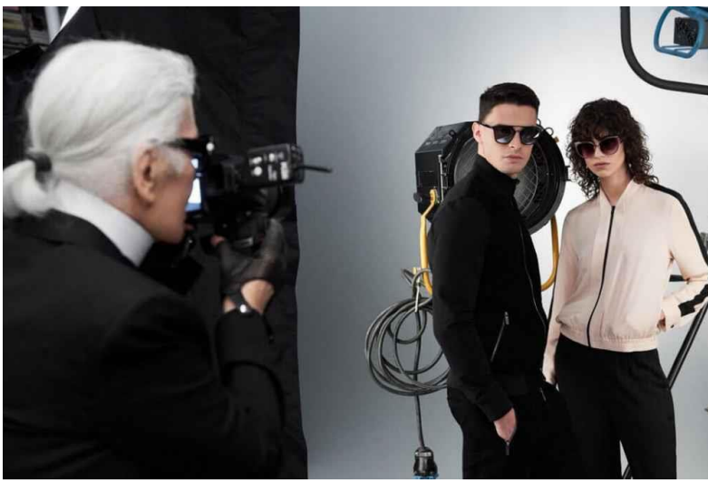
Εικόνα 10 Cover of youtube video-A tour of Karl Lagerfeld's Studio | SS17 Campaign Making Of

ιστορίας και την υπερβολική προσοχή της λεπτομέρειας, τον έκαναν ένα σύγχρονο μύθο, τον οποίο συνεχίζουν να αναφέρουν, να μιμούνται και να μελετούν. 18