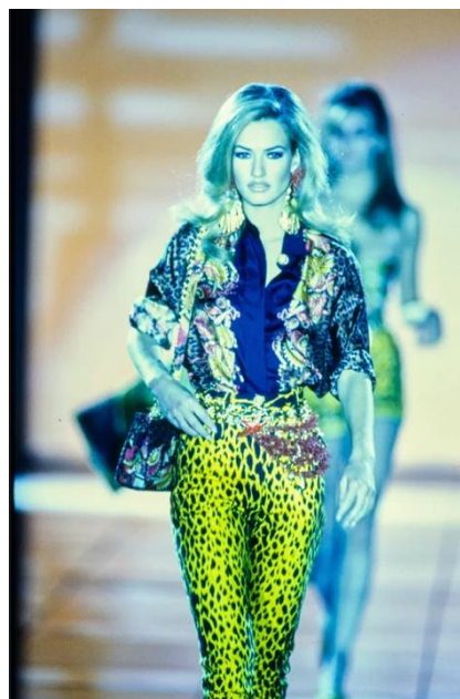
Εικόνα 121992 GIANNI VERSACE LEOPARD VEST & JEANS1992 GIANNI VERSACE LEOPARD VEST1992

Οι αναμνηστικές φωτογραφίες παίζουν μεγάλο ρόλο και στον χώρο της μόδας καθώς ένας οίκος κρατάει αρχείο από την ίδρυση του, μέχρι και σήμερα. Καταγράφουν την αισθητική, τα χρώματα, το στυλ κάθε εποχής και την πορεία του οίκου. Ακόμη μπορούν να συμβάλλουν στο σχεδιασμό και την διαδικασία έμπνευσης και εκτέλεσης