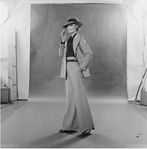
Εικόνα 6 A Model wearing a YSL suit in 1967

πιο πολυσυζητημένο εξώφυλλο του περιοδικού, με σημείωσε πάρα πολλές πωλήσεις. 13