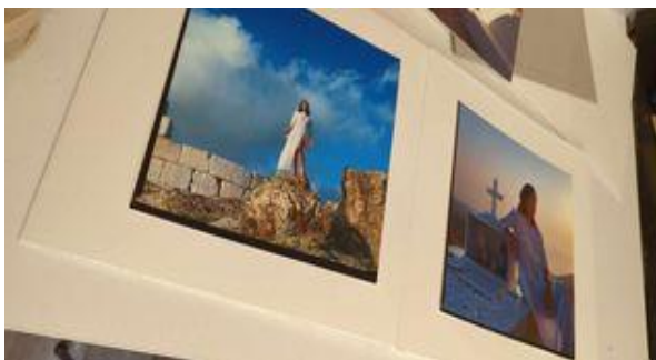
Εικόνα 28

Επιπροσθέτως, ο χρόνος ήταν περιορισμένος αναγκάζοντάς μας να επαναλάβουμε τις φωτογραφίες κάτω από αυτές τις συνθήκες. Κάνοντας έτσι 2 λήψεις την ημέρα, βγήκε το επιθυμητό αποτέλεσμα με πολύ μεγάλη δυσκολία και ψυχολογική πίεση. Ακόμη κατά την διαδικασία εμφάνισης του φιλμ, αποκαλύφθηκε ότι από ένα σετ είχε παραχθεί μόνο μία εικόνα αφήνοντας τις υπόλοιπες καμένες. Αιτία αυτού του προβλήματος ήταν η ελάχιστη εξάσκηση που είχα κάνει πάνω σε αυτή την κάμερα. Παρόλα τα προβλήματα εφόσον εμφανίστηκε το φιλμ, εκτυπώθηκαν κοντάκτς για να μπορώ να έχω όλες τις λήψεις μπροστά μου και να γίνει η επιλογή.