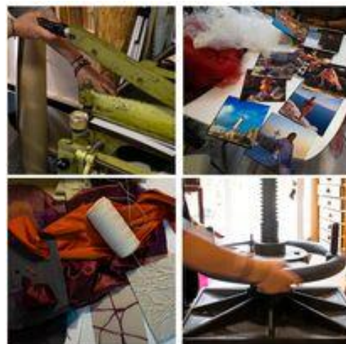
Εικόνα 29

FRANK, ο οποίος στο συγκεκριμένο βιβλίο παρουσιάζει σε ολόκληρες σελίδες τα κοντάκτς και το κάθε καρέ από τα φιλμ του, δημιουργώντας έναν οπτικό διάλογο με τον θεατή. Τα κοντάκτς όλα μαζί, δημιουργούν μια νέα εικόνα εξ ολοκλήρου και προσθέτουν το νόημα του χρόνου, καθώς βλέπεις καρέ καρέ τις αλλαγές στην πόζα και τον άνθρωπο μέσα στο χρόνο. Πρόκειται για μια διαδραστική διαδικασία για τους θεατές, καθώς επιλέγουν οι ίδιοι τις αγαπημένες τους εικόνες ή βλέπουν σαν σύνολο το κάθε καρέ και συμπληρώνουν ένα πάζλ της ιστορίας που θέλει να διηγηθεί ο εκάστοτε φωτογράφος.