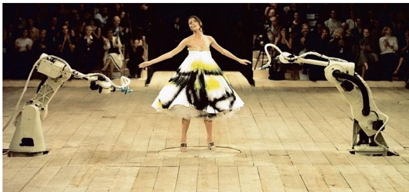
Εικόνα 8 Shalom Harlow sprayed with paint by robots during the finale of the Alexander McQueen Spring 1999 RTW show.

Κομμάτια, εμπνευσμένα από τον Dalí, το τσίρκο και τους πίνακες ζωγραφικής του σουρεαλισμού, έμελλε να δημιουργήσει ο Alexander McQueen διοργανώνοντας τολμηρά σόου, που εμπειρείχαν κοινωνικοπολιτικά μήνυμα, προκαλώντας αντιδράσεις από τα μέσα μαζικής ενημέρωσης, την θρησκεία και τον καλλιτεχνικό κόσμο. Πιο συγκεκριμένα, τα ρούχα άλλαζαν μορφή πάνω στην πασαρέλα και τα παπούτσια των μοντέλων έμοιαζαν με ζώα, όπως τα Armadillo. Το πιο χαρακτηριστικό είναι το σόου του 1999, όπου την Shalom Harlow με το διάσημο λευκό φόρεμα πάνω στην πασαρέλα, ψέκασαν με μπογιά δύο ρομπότ, τα οποία χρησιμοποιήθηκαν, ως μεταφορά του κύκνειου άσματος, για το κλείσιμο μιας εποχής. Επηρεασμένος από τη παιδική του ηλικία, τη φύση, την τεχνολογία και την έννοια το παραδοσιακό ρούχο, άλλαξε την