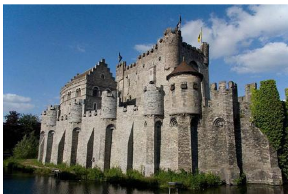
Εικόνα 2.1.2.1 Σωφρονιστήριο Γάνδης

Αντίστοιχα παραδείγματα αποτελούν το σωφρονιστήριο τη Γάνδης, το οποίο μέχρι τον 18ο αιώνα στεγαζόταν στο μεσαιωνικό κάστρο Gravensteen, στο οποίο παρατηρήθηκε αυστηρή οργάνωση της απασχόλησης σαν εκτέλεση της κύρωσης των κρατουμένων γύρω από επιτακτικές οικονομικές ανάγκες. Εξασφαλιζόταν έτσι η καθολική αγωγή της απασχόλησης ακόμη και όσων κρατουμένων επέλεγαν να την αποφύγουν επίμονα. Οι προβλέψεις της θητείας της κράτησης τους αλλά και ύστερα από αυτήν παρουσίαζαν με αυτόν τον τρόπο αισιοδοξία, παρόλο που οι ίδιοι υπόκειντο σε υποχρεωτική εργασία έναντι αμοιβής. Σε μια κοινή βάση, ιδρύθηκε και το σωφρονιστήριο του Gloucester στην Αγγλία, το 1791, στο οποίο προβλεπόταν ιδιαίτερη αντιμετώπιση σε κρατούμενους/ες με σοβαρότερα πειθαρχικά παραπτώματα, οδηγώντας τους/τες σε ολοκληρωτικής διάρκειας απομόνωση και για τους/τις υπόλοιπους/ες κρατούμενους/ες αδιάκοπη απασχόληση κατά την διάρκεια της ημέρας και καθεστώς απομόνωσης κατά τη διάρκεια της νύχτας (Foucault, 1999).