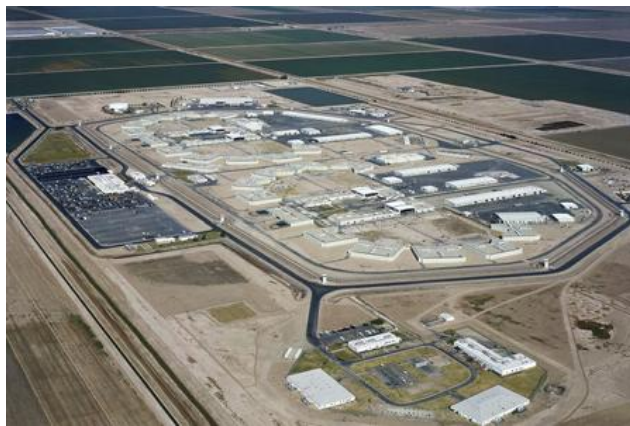
Εικόνα 2.1.2.7: Κατάστημα Κράτησης 'Calipatria', Ν.Καλιφόρνια

Ναι μεν η χωρητικότητα κατά το 2007 είχε αυξηθεί σε λίγο πάνω από 2000 κρατούμενους/ες, αλλά διαπιστώθηκε υπερπληρότητα της τάξης του 180 % με το ύψος των κρατουμένων να αγγίζει της 4000. Έτσι, η Calipatria λειτουργεί στο διπλάσιο της προβλεπόμενης χωρητικότητας της, όπως συμβαίνει και σε πολλά κομμάτια του σωφρονιστικού συστήματος. Εντοπίζονται έτσι, τριπλές κουκέτες τοποθετημένες σε αίθουσες συναθροίσεων και χώρους πρωινών δραστηριοτήτων, οι κρατούμενοι/ες στοιβάζονται ανά τέσσερις σε μικροσκοπικά κελιά, μειώνοντας σε