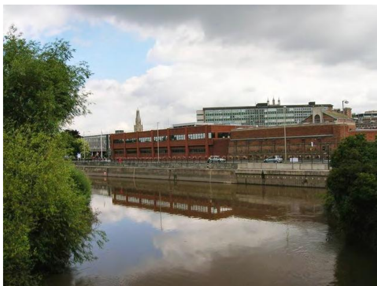
Εικόνα 2.1.2.2 Σωφρονιστήριο του Gloucester