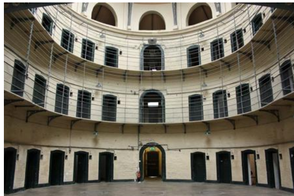
Εικόνα 2.1.2.4: Ανενεργή φυλακή Kilmainham, Δουβλίνο

Ρίχνοντας μια ματιά στην αρχιτεκτονική σύνθεση του πανοπτικού προτύπου εξάγουμε τα αυτονόητα πορίσματα. Στο κέντρο της σύνθεσης αυτής εντοπίζεται ένας κύριος πύργος με μεγάλα παράθυρα που βλέπουν στο εσωτερικό του δακτυλίου που δημιουργείται από ένα δακτυλοειδές οικοδόμημα το οποίο διαιρείται σε κελιά όπου το καθένα διαπερνά ολόκληρο το πλάτος του οικοδομήματος. Τα κελιά αποτελούνται από δυο παράθυρα, με την οπτική του ενός προς τα έξω αφήνοντας το φως να διαπεράσει το μήκος του, και την οπτική του δεύτερου προς τα μέσα με το παράθυρο να αντιστοιχεί σε ένα από τα παράθυρα του κεντρικού πύργου. Η τάξη εντός του χώρου κράτησης διασφαλίζεται από την διάταξη του κάθε θαλάμου απέναντι από τον κεντρικό πύργο δημιουργώντας μια αξονική ορατότητα, αλλά οι διαιρέσεις του δακτυλοειδούς κτιρίου παρεμποδίζουν κάθε μεταξύ τους πλαϊνή ορατότητα μέσα από