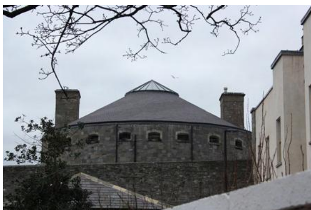
Εικόνα 2.1.2.6: Ανενεργή φυλακή Kilmainham, Δουβλίνο

Το πανοπτικό σύστημα σαν ένα είδος εγκατάσταση των σωμάτων στο χώρο, κατανομής των κρατουμένων, ιεραρχικής οργάνωσης και διευθέτησης και καθορισμού του τρόπου παρέμβασης του ελέγχου και μπορεί να χρησιμοποιηθεί για την επιβολή κάποιου κανόνα σε ένα πλήθος ατόμων. Περιορίζοντας τον αριθμό αυτών που ασκούν τον έλεγχο και πολλαπλασιάζοντας τον αριθμό εκείνων στους/στις οποίους/οποίες ασκείται, επιτρέπει την τελειοποίηση του. Επιτρέπει την παρέμβαση ανά πάσα στιγμή ακόμη και πριν διαπραχθούν παραπτώματα. Η δύναμη του ελέγχου έγκειται στο ότι χωρίς να παρεμβαίνει ποτέ ασκείται αυτόματα και αθόρυβα χωρίς κανένα υλικό όργανο επενεργώντας άμεσα στους/στις κρατούμενους/ες. Το πανοπτικό λειτουργεί σαν ένα εργαστήριο επιβολής του ελέγχου με ικανότητα διείσδυσης στη συμπεριφορά των ατόμων ακόμα και εντός των δικών του