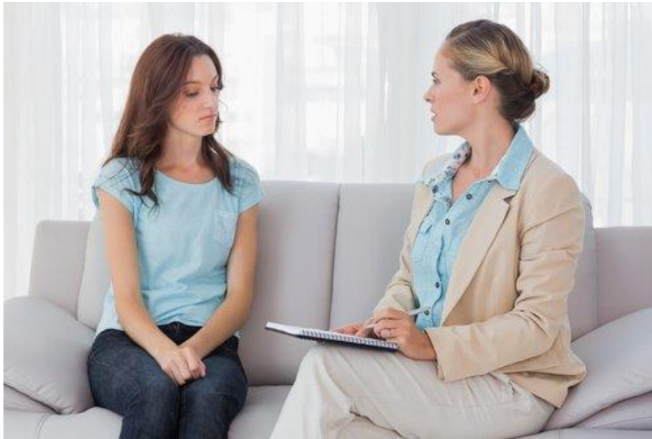
Εικόνα 6.Ο ρόλος της συμβουλευτικής στην εφηβική ηλικία