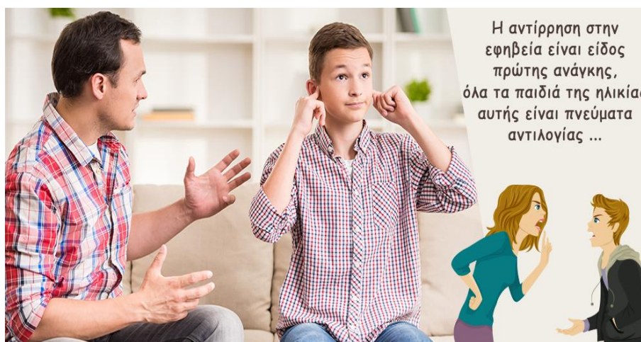
Εικόνα 1. Η αντιδραστική συμπεριφορά των εφήβων

Η εφηβεία είναι μια περίοδος προσαρμογής σε νέες καταστάσεις και απαιτήσεις, όπως η σχολική ζωή, οι φιλίες, οι συναισθηματικές σχέσεις, οι ευθύνες και οι προκλήσεις που παρουσιάζονται στον επαγγελματικό τομέα (Βλ.Εικ.2.). Η ικανότητα προσαρμογής και η αντιμετώπιση των προκλήσεων κατά την εφηβεία είναι σημαντική για την ανάπτυξη και την ωρίμανση (Cole & Cole, 2002).