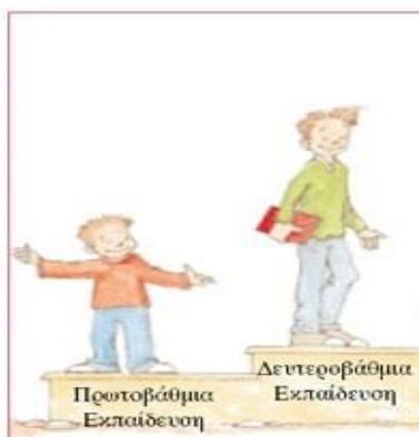
Εικόνα 5. Οι αυξημένες υποχρεώσεις κατά τη μετάβαση στη δευτεροβάθμια εκπαίδευση

Είναι σημαντικό να αναφερθεί πως πολλοί έφηβοι εγκαταλείπουν την δευτεροβάθμια εκπαίδευση είτε επειδή αναγκάζονται είτε από δική τους επιλογή. Οι νέοι αποφασίζουν να διακόψουν τη φοίτησή τους από τις πρώτες τάξεις δείχνοντας κάποια «σημάδια» όπως: οι απουσίες από τα μαθήματα, η επανάληψη ίδιων τάξεων και άλλα. Ωστόσο, η απόφαση αυτή εγκυμονεί πολλούς κινδύνους λόγω χάρη το χαμηλό μορφωτικό επίπεδο που συνεπάγεται δυσκολία σε μελλοντική εύρεση δουλειάς και κατ'επέκταση το εισόδημα θα είναι πολύ χαμηλό. Οι εκπαιδευτικοί θα πρέπει να είναι σε θέση να αντιμετωπίζουν τις συναισθηματικές μεταπτώσεις των εφήβων παρέχοντας τους βοήθεια η οποία θα αναλυθεί σε επόμενο κεφάλαιο.