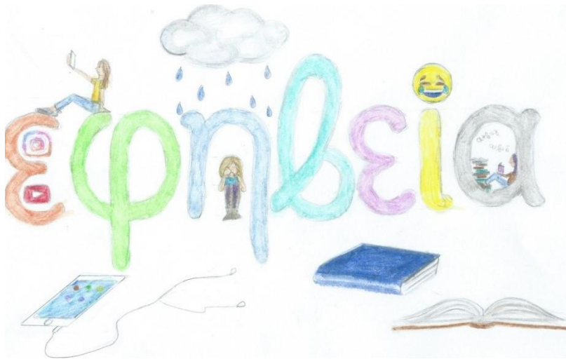
Εικόνα 2. Ο κόσμος της εφηβείας