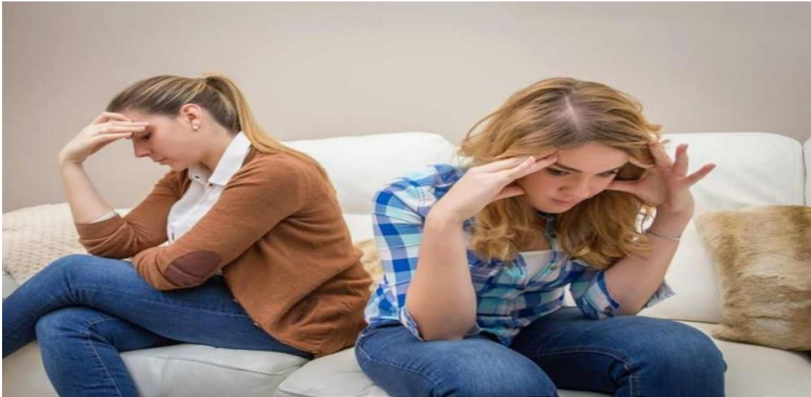
Εικόνα 3. Σύγκρουση γονέα με έφηβο

έφηβοι να είναι πιο εύκολο να οδηγηθούν στο ίδιο ατόπημα με την οικογένειά τους (Αλεβίζου, 2022) (Μεσσαριτάκη, 2017).