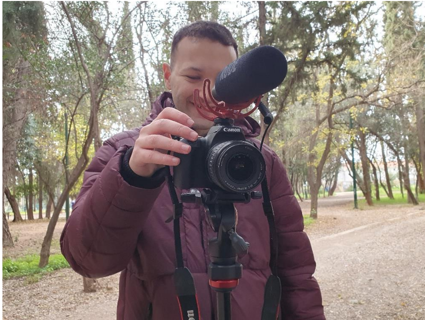
Εγώ που προσαρμόζω την κάμερα για την σκηνή