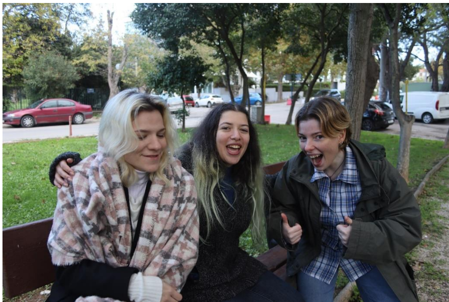
Ομοίως με πριν