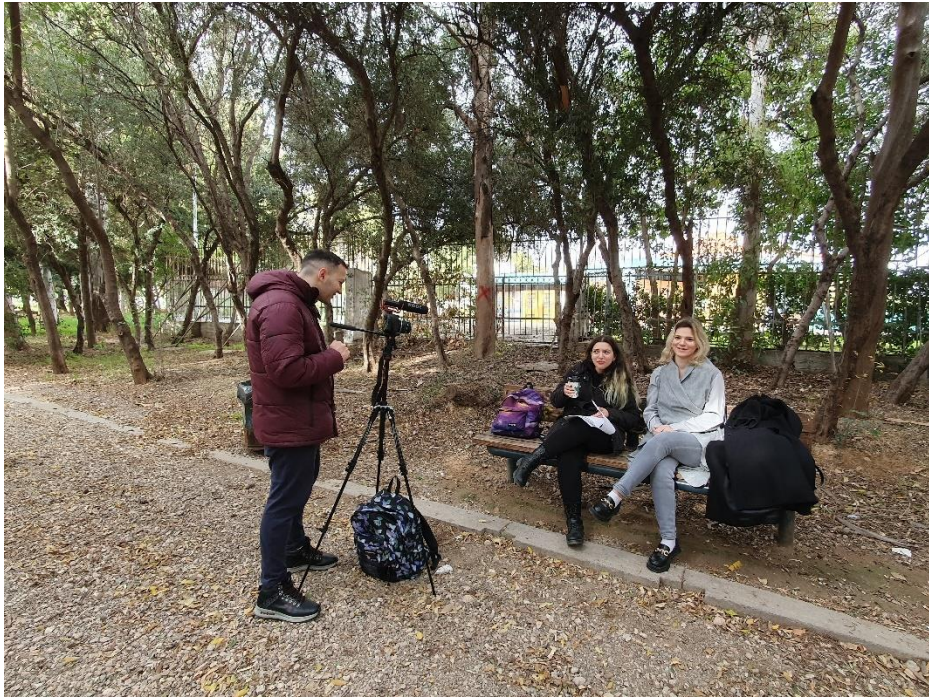
Ομοίως με πριν