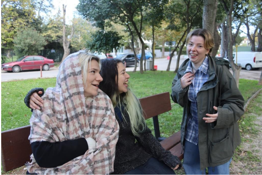
Ομοίως με πριν