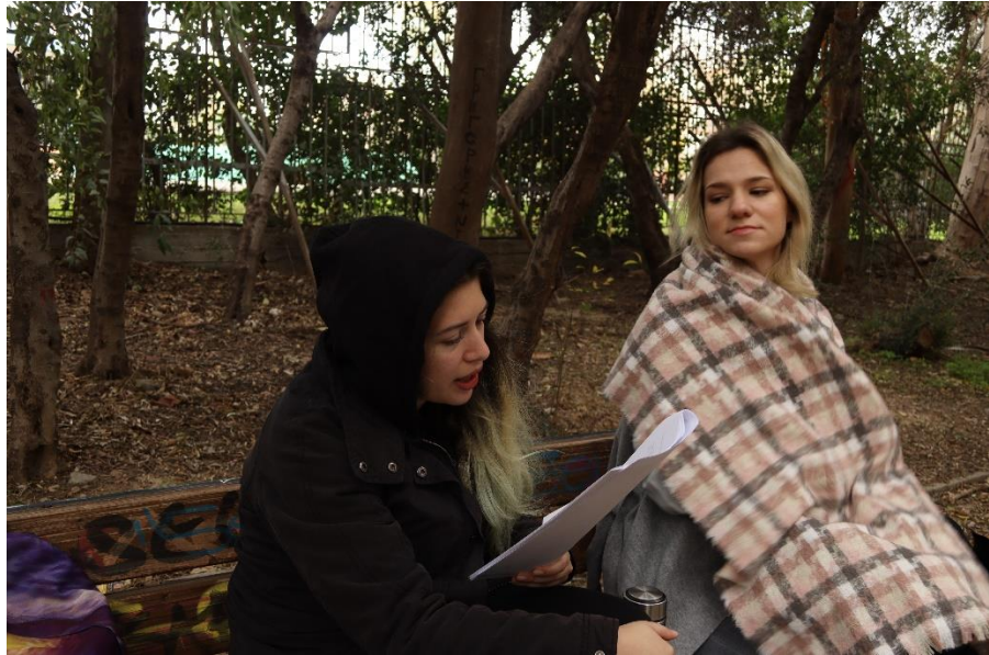
Ομοίως με πριν