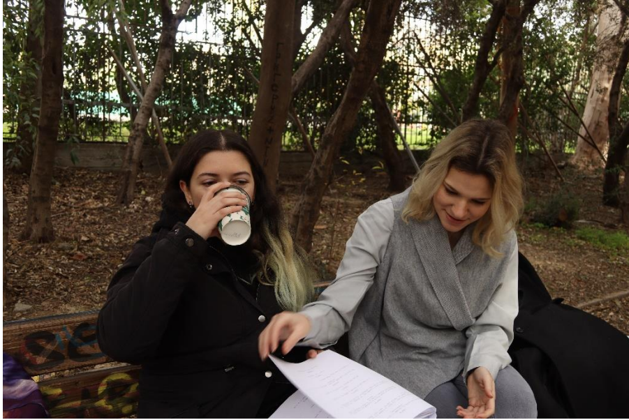
Ομοίως με πριν