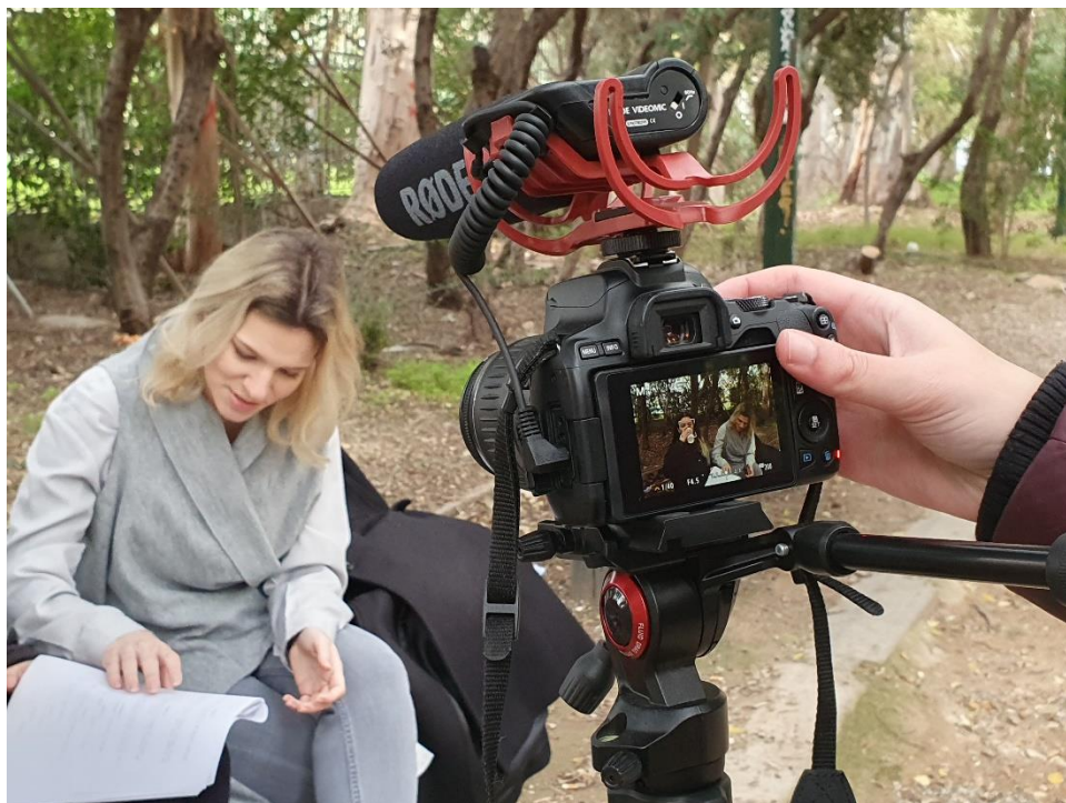
Στα γυρίσματα της δεύτερης σκηνής