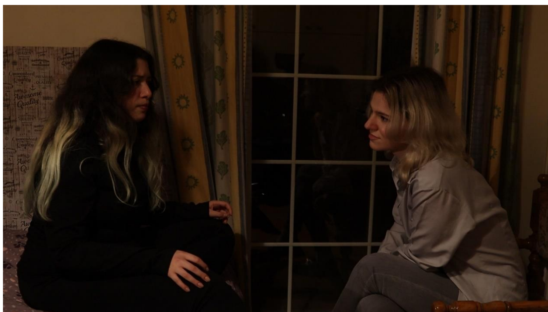
Πρώτη Σκηνή (Γεωργία και Ουρανία)

Τα ονόματα των χαρακτήρων είναι όλα συμβολικά. Την πρωταγωνίστρια την ονόμασα Γεωργία και τη φίλη της Ουρανία για να δείξω την αντίθεση των καταστάσεων τους. Η Γεωργία βρίσκεται στη γη ενώ η Ουρανία βρίσκεται στον ουρανό. Το όνομα της Ουρανίας αποτελεί λοιπόν και προοικονομία για τη μοίρα της στην ιστορία μου. Οι άλλοι δύο φίλοι της Γεωργίας πήραν τα ονόματά τους από τον ρόλο τους στην πλοκή. Ο Φώτης είναι αυτός που φέρνει το φως, αυτός που φέρνει τη Γεωργία αντιμέτωπη με την αλήθεια. Η Ειρήνη είναι αυτή που συμβάλλει περισσότερο στην ολοκλήρωση της μετάβασης της Γεωργίας από το στάδιο της κατάθλιψης στο στάδιο της αποδοχής. Η μόνη εξαίρεση είναι η μητέρα της Γεωργίας που ονομάστηκε Ελένη για τις ανάγκες του σεναρίου και δεν κρύβεται κάποιος συμβολισμός πίσω από το όνομά της, το οποίο δεν ακούγεται καθόλου μέσα στην ταινία έτσι κι αλλιώς.