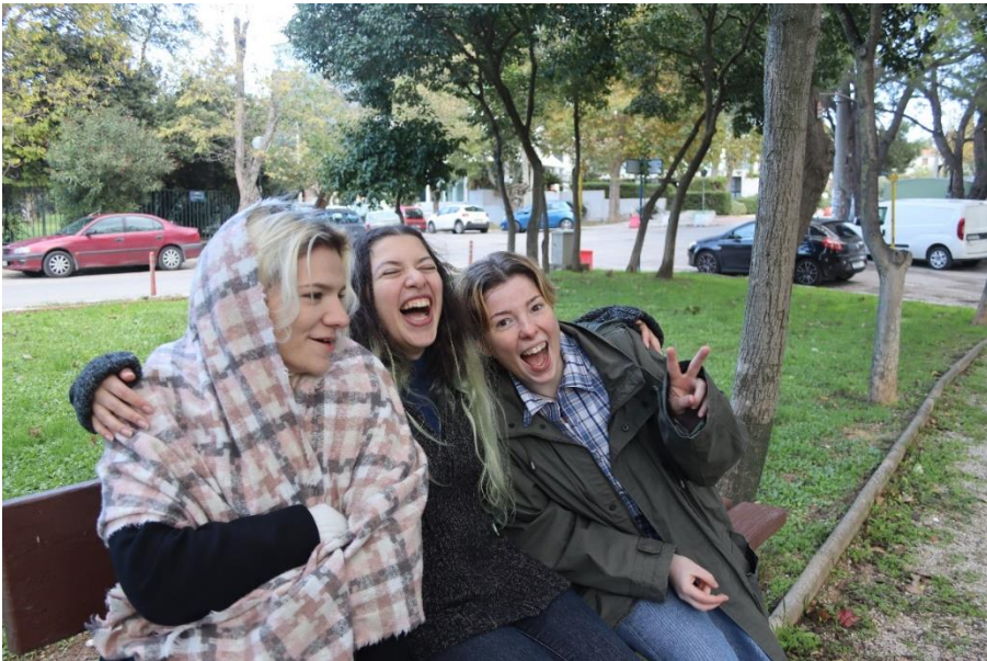
Ομοίως με πριν