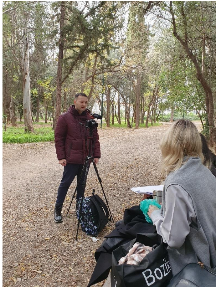
Ομοίως με πριν