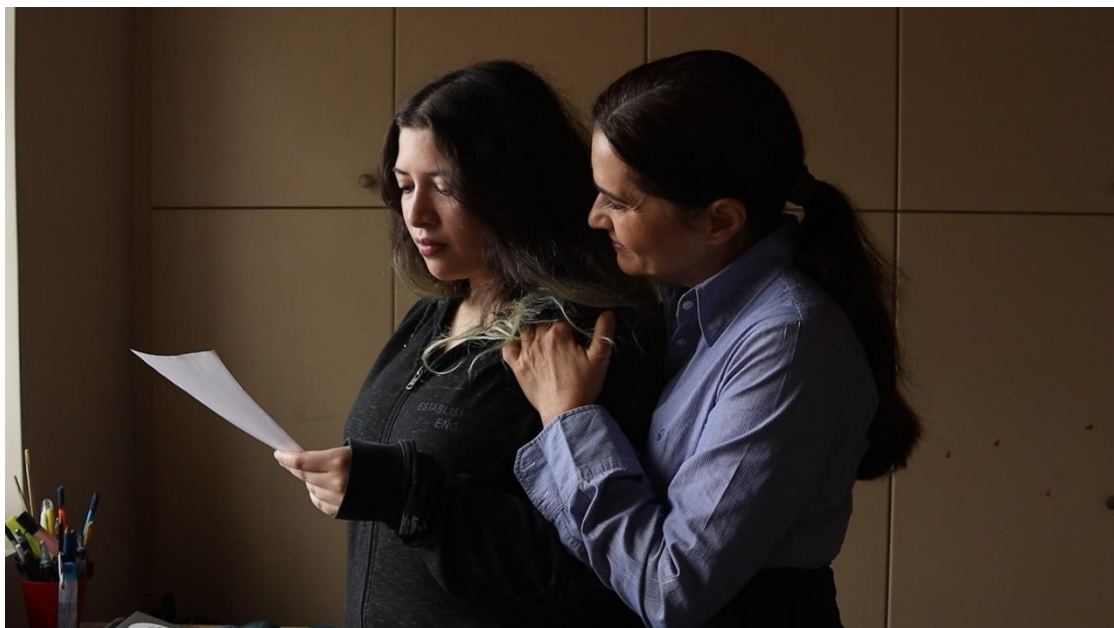
Πέμπτη Σκηνή (Γεωργία και Ελένη)

Ο Φώτης φοράει κίτρινο, συμβολίζοντας το φως που φέρνει στη Γεωργία, θυμίζοντας της ότι η Ουρανία απεβίωσε. Η Ειρήνη φοράει μπλε και στις δύο εμφανίσεις της, συμβολίζοντας την ηρεμία και την γαλήνη που πρόκειται να φέρει στη Γεωργία, κάτι που κάνει τελικά μέσα από την τελευταία σκηνή της ταινίας.