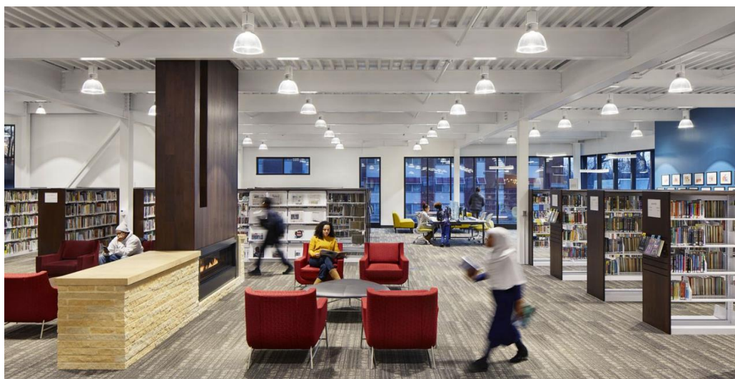
Εικόνα 1. Η δημόσια βιβλιοθήκη Columbia Heights που δρα σαν κοινοτικός κόμβος (HGA, 2019)

θέματα που σχετίζονται με τις επιχειρήσεις. Με τον τρόπο αυτό, προσφέρουν υποστήριξη στις τοπικές επιχειρήσεις (Suchanic, Pond, & Perry, 2023).