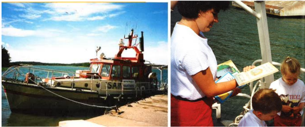
Εικόνα 3: Πρόγραμμα μεταφοράς βιβλίων με βάρκα στο αρχιπέλαγος της Φινλανδίας. Βάρκα που μεταφέρει βιβλία (Αριστερά) και η βιβλιοθηκονόμος με παιδιά όταν μοιράζει βιβλία (Δεξιά)

Το βιβλίο περιγράφει με απλό τρόπο και όμορφη εικονογράφηση, μαζί και με φωτογραφίες από τις ποικίλες δράσεις των δημόσιων βιβλιοθηκών, την παροχή πρόσβασης παιδιών μικρής ηλικίας σε βιβλία που φτάνουν στην περιοχή τους με μεγάλες νταλίκες (Αζερμπαϊζάν, Αυστραλία), με το ταχυδρομείο (Καναδάς, περιοχές όπου κατοικούν Εσκιμώοι), με εθελοντές που κουβαλούν τα βιβλία με καροτσάκια στην παραλία (Βρετανία), με μικρά πλοία (Φινλανδία, σε νησιωτικές περιοχές, Ινδονησία) (Εικόνα 3), με καμήλα (Κένυα, Μογγολία), με μικρά πουλμανάκια (Πακιστάν), με τα πόδια (Παπούα- Νέα Γουινέα) (Ruurs, 2011).