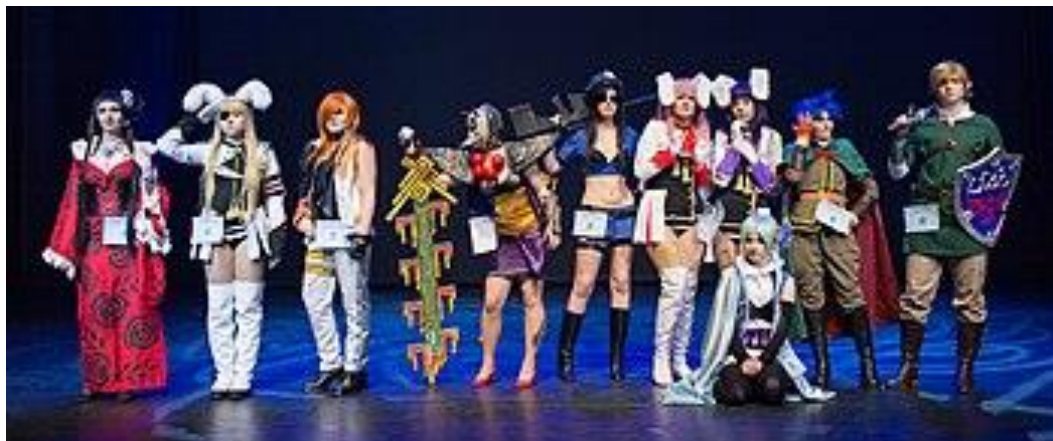
Εικόνα 4. Cosplay

μικρό χρόνο κ.ά.), ενδυνάμωση των αριθμητικών και μαθηματικών δεξιοτήτων, μετρήσεις και μετατροπές από δισδιάστατο σε τρισδιάστατο μοντέλο, καθώς και κριτική σκέψη και ικανότητα λύσης προβλημάτων (Abramova, Smirnova, & Tataurova, 2021).