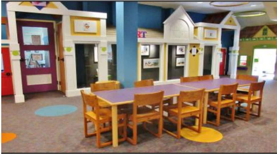
Εικόνα 5: Χαμηλό τραπεζάκι στο στούντιο για παιδιά νηπιακής ηλικίας (Πηγή: Holmes, 2016)

Το Open Art Studio είναι μια «ζώνη χωρίς τεχνολογία» και όταν οι γονείς και οι φροντιστές είναι στο στούντιο με τα παιδιά τους, είναι παρόντες στη στιγμή με το παιδί τους. Κανείς δεν χρησιμοποιεί τα κινητά του τηλέφωνα, ή τα τάμπλετ και μόνο ασχολείται με το παιδί του και την τέχνη του. Έτσι, το στούντιο καλωσορίζει τους ενήλικες όχι απλά για να βοηθήσουν το παιδί τους αλλά και για να συμμετέχουν και να κάνουν τη δική τους τέχνη, εάν το επιθυμούν. Η βιβλιοθήκη, εκτός από το Open Art Studio, οργάνωσε και τρεις οικογενειακούς χορούς με θέματα του Έλβις, την γιορτή του Αγίου Βαλεντίνου και έναν ακόμη χορό στον αχυρώνα, ενώ παράλληλα προγράμματα ήταν και οι «Ιστορίες σε κίνηση» και «Πόζες γιόγκα» όπου οι συμμετέχοντες απλά απελευθέρωσαν την δημιουργικότητα τους χορεύοντας (Fletcher, 2019).