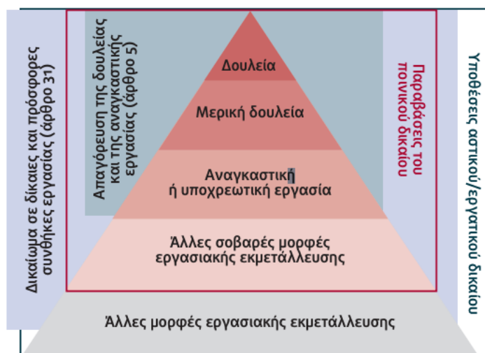
Εικόνα 1: Μορφές Εργασιακής Εκμετάλλευσης (FRA, 2015) 6 .