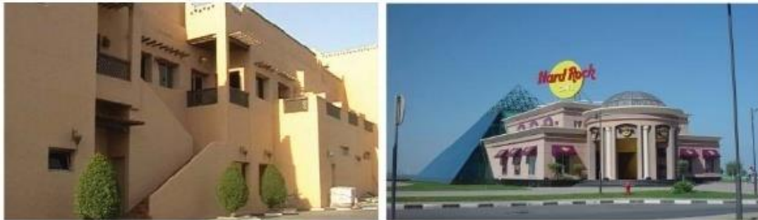
Εικόνα 7. Παραδείγματα έργων που αντανakλούν αντίθετες αρχιτεκτονικές ταυτότητες. Αριστερά: Mies Al-Ghanem Restaurant – Δεξιά: Hard Rock Café

Κουβέιτ πρέπει να είναι μια αντανάκλαση των σύγχρονων αρχιτεκτονικών στυλ, υλικών και συστημάτων κατασκευής (Εικόνα 7). Αν και ο Saba George Shiber 54 , προειδοποίησε για την απώλεια της ταυτότητας ότι θα επιταχυνόταν ένας πολύ γρήγορος σύγχρονος μετασχηματισμός (Kultermann, 1999), πολλοί Κουβέιτοι αρχιτέκτονες αναφέρουν την απουσία ταυτότητας στην αρχιτεκτονική και την ανάγκη να αναπτυχθεί μια ταυτότητα Κουβέιτ στο δομημένο περιβάλλον.. Ένα ντοκιμαντέρ που παράγεται από την τηλεόραση του Κουβέιτ με τίτλο «Αρχιτεκτονική του Κουβέιτ: Μια χαμένη ταυτότητα» απεικονίζει την ανάπτυξη της αρχιτεκτονικής στο Κουβέιτ και επισημαίνει τη σημασία της ανάπτυξης μιας ταυτότητας του Κουβέιτ στην αρχιτεκτονική.