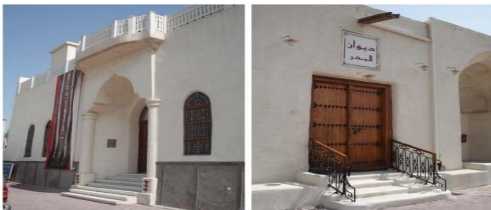
Εικόνα 5. Ανακαινισμένα παραδοσιακά κτίρια. Αριστερά: Al-Sadu House – Δεξιά: Diwan Al-Bahar.

Οι Κουβειτιανοί ανακάλυψαν - καθυστερημένα - ότι η κατεδάφιση παραδοσιακών κτιρίων ήταν μεγάλη απώλεια για την πολιτιστική τους συνέχεια. Άρχισαν αρκετές προσπάθειες για να διατηρήσουν τα εναπομείναντα παλιά τζαμιά, τα Diwanis (ξενώνες) και τα παλιά σπίτια. Μεγάλες κενές θέσεις στο κέντρο της πόλης θυμίζουν την καταστροφή παλαιών σπιτιών, δρόμων και χώρων συγκέντρωσης (Εικόνα 5).