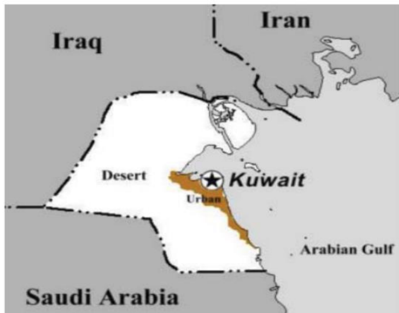
Εικόνα1. Χάρτης του Κουβέιτ και των γειτονικών του χωρών.

νέο πολιτισμό όταν κατοικήθηκαν εκ νέου. (Harry G. Summers, Jr.) Ο αντίκτυπος του πολέμου στο Κουβέιτ ξεκίνησε με την ανακάλυψη πετρελαίου κατά τη δεκαετία του 1930 από τους Βρετανούς και την απόκρυψή του μέχρι το τέλος του Β' Παγκοσμίου Πολέμου προκειμένου να αποσπάσει την προσοχή της ναζιστικής Γερμανίας μακριά από η περιοχή. Το Κουβέιτ περιέχει περίπου 100 δισεκατομμύρια βαρέλια αποδεδειγμένων αποθεμάτων πετρελαίου, ή περίπου το 8% των συνολικών αποθεμάτων πετρελαίου στον κόσμο. Το σκληρό κλίμα της περιορίζει την αγροτική ανάπτυξη και κατά συνέπεια, την διαβίωση των ψαριών. Ως εκ τούτου η περιοχή εξαρτάται σχεδόν εξ ολοκλήρου από τις εισαγωγές τροφίμων. Οι πολιτικές συνθήκες στην περιοχή ήταν πάντα μια σημαντική ανησυχία λόγω των επιπτώσεών τους στις τιμές του πετρελαίου και την προσφορά του στην παγκόσμια αγορά (Lutsch, 2015).