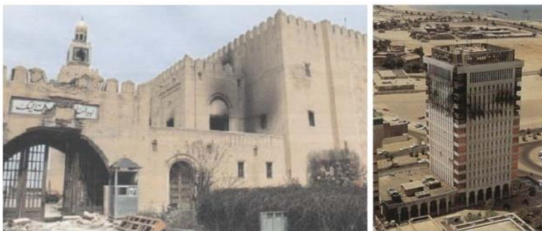
Εικόνα 2. Παραδείγματα επιπτώσεων του πολέμου σε ορόσημα του Κουβέιτ, Αριστερά: Παλάτι Σέιφ

Οι γνωστοί Water Towers του Κουβέιτ της Malene Bjoern, το κτίριο της Εθνικής Συνέλευσης του Jorn Utzon, το Sief Palace από τη Reima Pietilae και το Διεθνές Αεροδρόμιο του Kenzo Tange ήταν μεταξύ των κτιρίων που υπέστησαν ζημιές και βανδαλισμούς κατά την εισβολή (Εικόνα 2). Ιστορικά και παραδοσιακά κτίρια στοχοποιήθηκαν και καταστράφηκαν (Εικόνα 3).