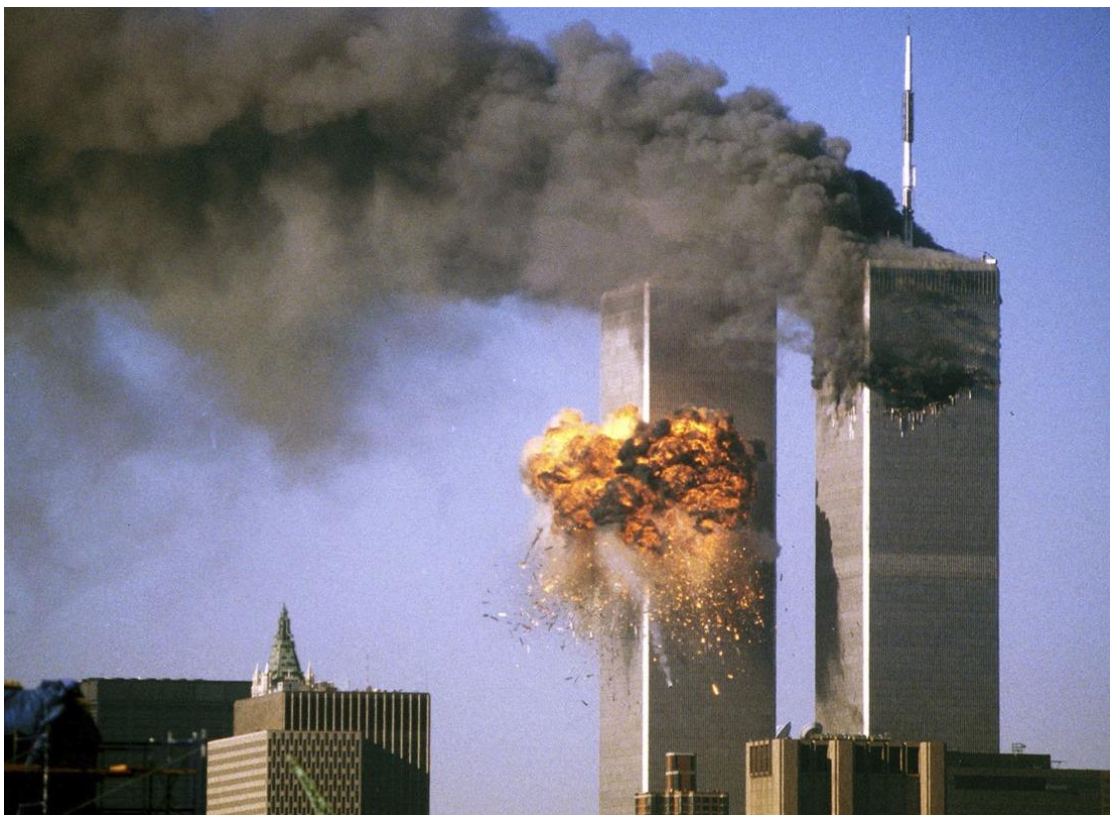
Εικόνα1. Οι δίδυμοι πύργοι λίγο μετά την επίθεση στις 11 Σεπτεμβρίου 2001

Ο αντίκτυπος του πολέμου στην αρχιτεκτονική υπερβαίνει τη φυσική παρουσία του και επηρεάζει το συμβολικό του νόημα ως αναπαράσταση της πολιτιστικής ταυτότητας. Η καταστροφή των πύργων του Παγκόσμιου Κέντρου Εμπορίου της Νέας Υόρκης στις 11 Σεπτεμβρίου 2001 απεικόνισε τη σημαντικότητα της συμβολικής σημασίας της αρχιτεκτονικής ως στόχου για πολεμικές επιθέσεις. Θεωρήθηκαν από τους επιτιθέμενους ως σύμβολο της κυριαρχίας του ιμπεριαλισμού που πρέπει να καταστραφεί.