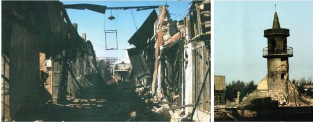
Εικόνα 3. Κατεστραμμένα παραδοσιακά κτίρια. Αριστερά: Παλιά αγορά – Δεξιά: Παλιός μιναρές τζαμιού.

Ήδη από τον Σεπτέμβριο του 1990, η εξόριστη κυβέρνηση του Κουβέιτ άρχισε συζητήσεις με την κυβέρνηση των ΗΠΑ σχετικά με τα μεταπολεμικά σχέδια για ανοικοδόμηση. Μια ειδική ομάδα ιδρύθηκε πριν από την απελευθέρωση του Κουβέιτ για να αναπτύξει σχέδια για την ανοικοδόμηση του Κουβέιτ. (Al-Bahar, 1991pp. 14-17) Μέχρι το τέλος του 1990, οι Κουβειτιανοί είχαν αρχίσει να διαμορφώνουν ένα σχέδιο δράσης για έκτακτη ανάγκη υποδομής και αποκατάστασης. Αυτό το σχέδιο προέβλεπε μια διαδικασία ανακατασκευής τριών φάσεων ως εξής: 1) Η Φάση Ανακούφισης Έκτακτης Ανάγκης, 2) Η Φάση Ανάκτησης και 3) Η Φάση Ανασυγκρότησης. Η Φάση Αρωγής Έκτακτης Ανάγκης αναμενόταν να διαρκέσει περίπου τρεις μήνες και συντονίστηκε από τα γραφεία του Κουβέιτ Έκτακτης Ανάγκης και του Προγράμματος Ανάκαμψης (KERP) στην Ουάσιγκτον και στο Κουβέιτ. Αμέσως μετά τον πόλεμο, η KERP ήταν σε μεγάλο βαθμό υπεύθυνη για τις εκτιμήσεις των ζημιών που έγιναν στο Κουβέιτ κατά τη διάρκεια αυτής της περιόδου.