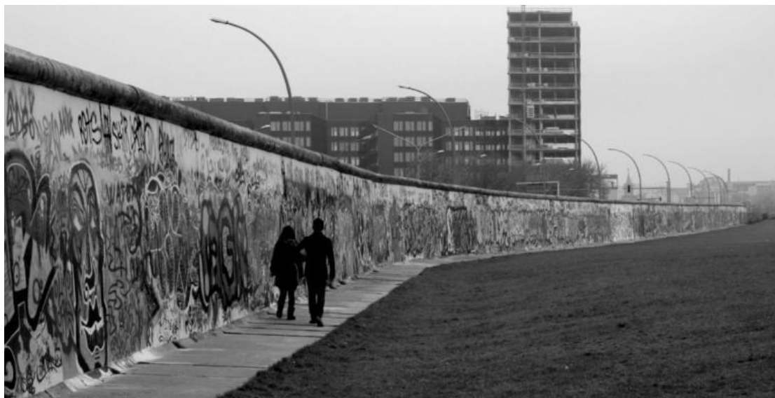
Εικόνα 2. Το τείχος του Βερολίνου

διαχωρισμός των πολιτισμών (όπως στην περίπτωση της Κύπρου), ανθρώπων (Ισραήλ/Παλαιστίνη) ή ιδεολογιών (Βερολίνο).