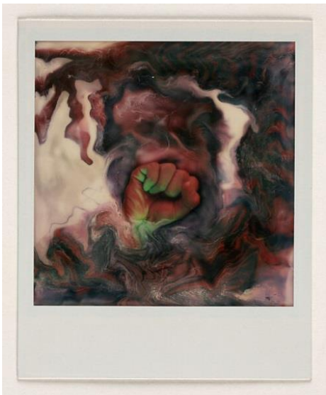
Εικόνα 10: Lucas Samaras, Photo- Transformation, 1973

Μέρος της γοητείας της Polaroid είναι φυσικά η μοναδικότητά της, ένα υλικό που μπορούσε να γρατσουνιστεί, να τσαλακωθεί ή να αλλοιωθεί με άλλο τρόπο και να μετατραπεί σε κάτι διαφορετικό. Ως αποτέλεσμα, η εκτύπωση του φιλμ Polaroid "έχει ... μια ομοιότητα με τη ζωγραφική και τη γλυπτική" και μπορεί να ανακυκλωθεί με φυσικό τρόπο για το λόγο της καλής τέχνης. 30 Η καινοτομία της polaroid παγιώνεται και ο εκτεταμένος εναγκαλισμός των καλλιτεχνών μετατρέπει την εταιρεία σε μια σημαντική πολιτιστική και καλλιτεχνική δύναμη.