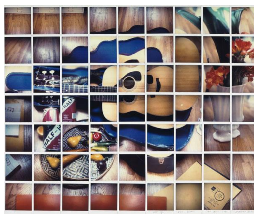
Εικόνα 8: David Hockney, Still Life Blue Guitar, 1982