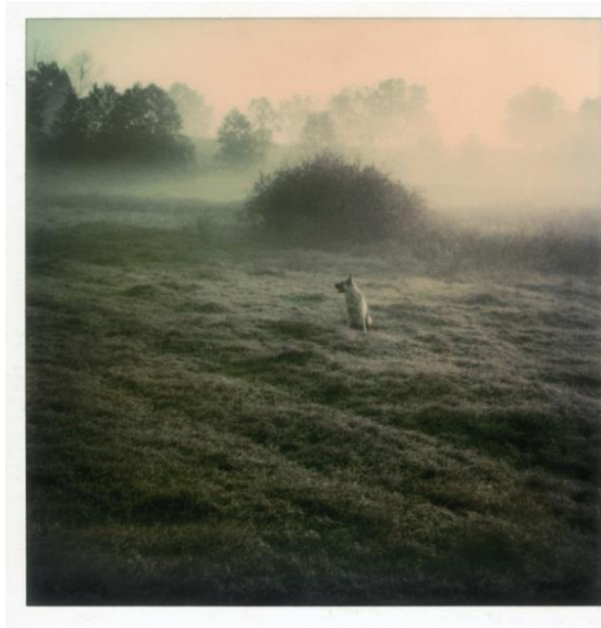
Εικόνες 13 και 14: Andrei Tarkovsky, Instant Light, 2002