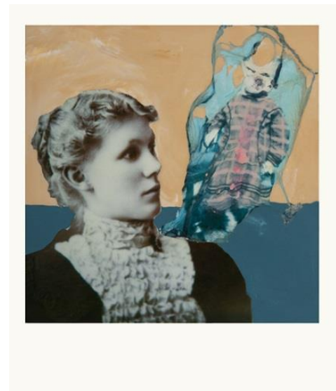
Εικόνα 11: John Reuter, Revelation, 1978