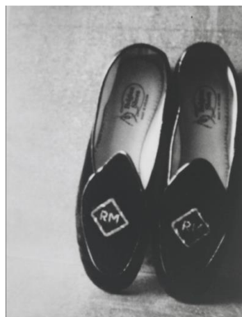
Εικόνα 19: Robert Maplethorpe's Slippers, 2002

Από τις φωτογραφίες της πηγάζει μια απερίγραπτη ομορφιά και νοσταλγία, που προέρχεται από τα θέματα που φωτογραφίζει αλλά και από την ίδια την φωτογραφική της μηχανή. Πρόκειται για μια μηχανή της δεκαετίας του 1960, της δημιουργεί μνήμες για τα πράγματα του παρελθόντος, οπότε επιλέγει με αυτήν να παγώσει τις στιγμές και να τις αποτυπώσει για τις επόμενες γενιές. Το έργο της είναι άρρηκτα συνδεδεμένο με τις μνήμες της. Η ίδια αναφέρει χαρακτηριστικά: “Η εμπειρία της λήψης Polaroid με συνδέει με τη στιγμή. Είναι αναμνηστικά μιας χαρούμενης μοναξιάς” 39 .