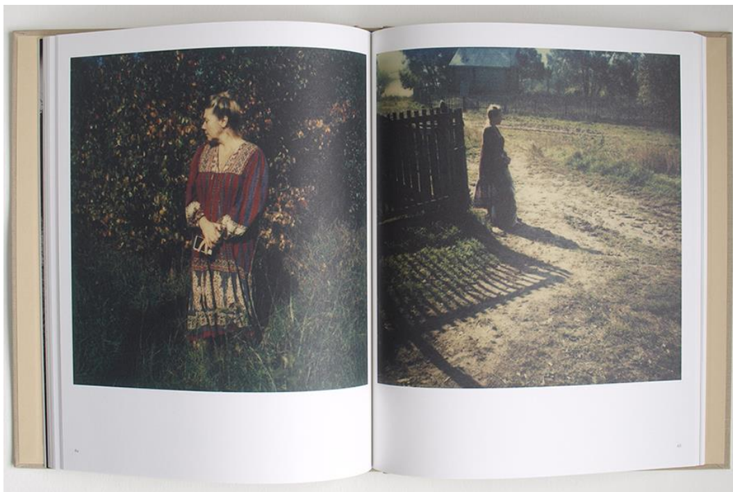
Εικόνα 12: Andrei Tarkovsky, Bright Bright Day, 2008

Οι εικόνες του Tarkovsky λειτουργούν ως προέκταση των ταινιών του, διαθέτουν μια αγνή κινηματογραφική ομορφιά. Προκαλούν μια αποστασιοποιημένη νοσταλγική ατμόσφαιρα, με το φως εισχωρεί ακόμη και στις βαθύτερες γωνίες αυτών των Polaroids, ρίχνοντας φωτοσκιάσεις πάνω σε κρεβάτια, διαδρόμους, κενές καρέκλες και βάζα. Μας αφήνουν μια μυστηριώδη και ποιητική αίσθηση, τη μελαγχολία του να βλέπεις τα πράγματα για τελευταία φορά. 35