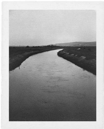
Εικόνα 15: Patti Smith, The River Ouse , 2003

αλληλεπίδραση και η επαφή της με αυτά, μεταμορφώνοντας τις εικόνες της σε συμβολικά πορτρέτα. Οι απαλά φωτισμένες αυτές ασπρόμαυρες εικόνες αποτελούν αναμνηστικά, που λειτουργούν ως ημερολογιακό υπόβαθρο της γραφής, της μουσικής και των ερμηνειών της 36 .