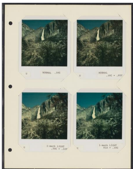
Εικόνα 5: Ansel Adams, Test Photographs of Yosemite National Park, 1973

Επιπλέον, προσέφερε σημαντική βοήθεια για την εξέλιξη των προϊόντων της Polaroid, καθώς κατέγραψε αρκετές δοκιμαστικές λήψεις του ίδιου θέματος με μικρές προσαρμογές και αλλαγές, όπως η ρύθμιση του διαφράγματος, ο χρόνος εμφάνισης ή η χρήση φίλτρου και έγραφε όλα αυτά τα στοιχεία πάνω στη δοκιμαστική φωτογραφία αλλά και σε σημειώσεις.