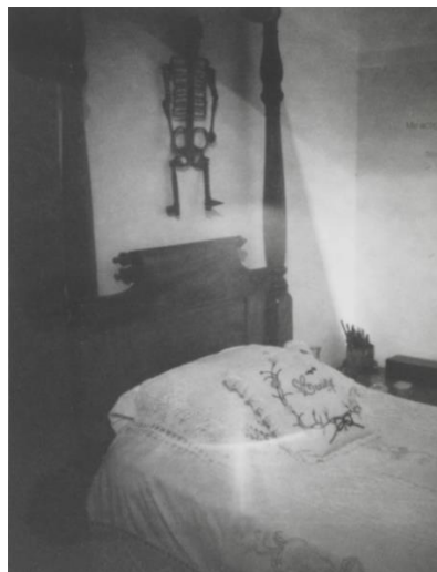
Εικόνα 18: Patti Smith, Frida Kahlo's Bed, 2012

σημαίνει να συμμετέχεις στη θνητότητα, την ευαλωτότητα, τη μεταβλητότητα ενός άλλου προσώπου (ή πράγματος). Ακριβώς κόβοντας αυτή τη στιγμή και παγώνοντάς την, όλες οι φωτογραφίες μαρτυρούν το αμείλικτο λιώσιμο του χρόνου” 38 .