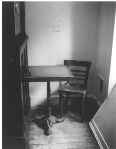
Εικόνα 17: Patti Smith, Café 'Ino, 2013

στιγμή που καταγράφεται είναι μια στιγμή που χάνεται, μια στιγμή που δεν θα ξανασυμβεί ποτέ με τον ίδιο τρόπο. Με μια φωτογραφία είναι σαν να παγώνουμε και να φυλάμε ένα κομμάτι του παρελθόντος. “Όλες οι φωτογραφίες είναι memento mori. Το να τραβήξεις μια φωτογραφία