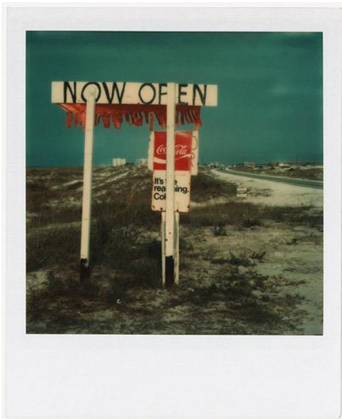
Εικόνα 9: Walker Evans, no title, 1974

Αυτό που έκανε την Polaroid τόσο δελεαστική για τους καλλιτέχνες ήταν αρχικά η αμεσότητα, δηλαδή η γρήγορη αξιολόγηση και αναθεώρηση, αντί να στέλνουν υλικό σε ένα εργαστήριο και να το ξεχνάνε για λίγο. Επίσης ήταν τα χρώματα, όλοι αναγνώριζαν την ποιότητα, όπου μόνο η Polaroid μπορεί να το προσφέρει αυτό. Ένωσαν ότι βρίσκονται σε μια τεχνολογική αιχμή. Ο Walker Evans (1903-1975) ήταν ένας από τους φωτογράφους που απέκτησε την SX-70 αρκετά γρήγορα μετά την κυκλοφορία της, το 1973, όπου επίσης του δόθηκε απεριόριστη προμήθεια φιλμ από τον Edwin Land και τράβηξε χιλιάδες φωτογραφίες με αυτήν τους επόμενους δεκατέσσερις μήνες. Στην αρχή πίστευε ότι η SX-70 ήταν "απλά ένα παιχνίδι" 23 , και στη συνέχεια συνειδητοποίησε πως τον οδήγησε να κάνει απρόβλεπτες φωτογραφικές ανακαλύψεις και εξερευνήσεις. Με την polaroid φωτογράφησε γνώριμα και οικεία θέματα, όπως πινακίδες, οικιακούς εσωτερικούς χώρους, πρόσωπα, παραδοσιακή αρχιτεκτονική, έπιπλα του δρόμου και αστικά σκουπίδια, προσδίδοντας σε αυτά μια ιδιαίτερη αίσθηση τυπικής εξερεύνησης του περιβάλλοντος. Στις polaroids, η ψυχρή αποστασιοποίηση και η ήρεμη αυτοσυγκράτηση που χαρακτήριζαν τις φωτογραφίες του Evans δίνουν συχνά τη θέση τους σε μια πιο ενστικτώδη, οικεία εμπλοκή με τα θέματα. 24