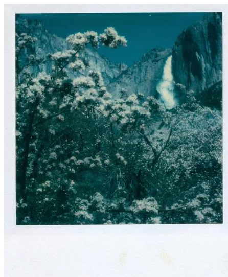
Εικόνα 6: Ansel Adams, Yosemite Falls, 1979