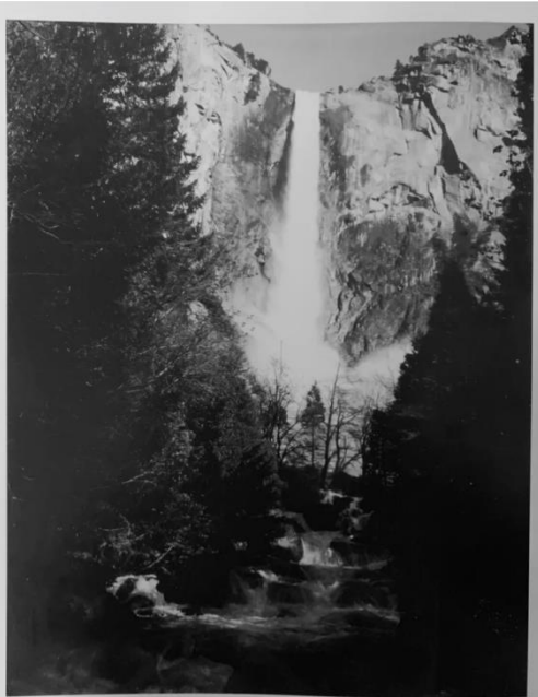
Εικόνα 4: Ansel Adams, Cascades, 1956

Πίστευε ότι οι εικόνες Polaroids παρείχαν τόνους που δεν μπορούσαν να αναπαραχθούν με άλλες τεχνικές, γι' αυτό τον λόγο συνέχισε να χρησιμοποιεί την μηχανή και τα προϊόντα της εταιρίας στην καριέρα του. Με την SX-70, ο Adams δημιούργησε εντυπωσιακές πανοραμικές εικόνες, όπως η λήψη των καταρρακτών Yosemite και μπόρεσε να αποτυπώσει την αίσθηση του μεγαλείου.