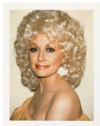
Εικόνα 7: Andy Warhol, Dolly Parton, 1985

Ο David Hockney(1937) προσέγγισε την polaroid με έναν διαφορετικό τρόπο. Πειραματίστηκε με νέους τρόπους θέασης, ενώνοντας πολλές οπτικές γωνίες χρησιμοποιώντας μια Polaroid για να παράγει φωτοκολλάζ, τα οποία ονόμασε "joiners" 18 . Η τέχνη του μιμείται τον κυβισμό 19 , καθώς απεικονίζει μια σκηνή ή ένα αντικείμενο από πολλές οπτικές γωνίες σε μια δισδιάστατη μορφή. Ασχολήθηκε με την έννοια του χρόνου στις εικόνες του, δείχνοντας μια σκηνή ή ένα πρόσωπο σε διαφορετικά σημεία. “Ο χρόνος εμφανιζόταν στην εικόνα, και εξαιτίας αυτού ο χώρος, η ψευδαίσθηση του μεγαλύτερου χώρου. Όμως ο χρόνος είναι αληθινός, ξέρουμε ότι χρειάστηκε χρόνος για να τραβηχτούν οι εικόνες, να εμφανιστούν, και να τις τοποθετήσουμε” 20 .