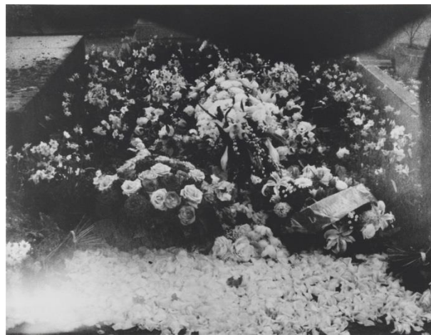
Εικόνα 16: Patti Smith, Susan Sontag's Grave , 2005

Παρουσιάζονται επίσης φωτογραφίες αντικειμένων που κυμαίνονται από τα πιο καθημερινά, όπως ένα τραπέζι και μια καρέκλα από το αγαπημένο της καφέ, στα πιο ιδιαίτερα, όπως το κρεβάτι της Frida Kahlo ή την καρέκλα του Roberto Bolaño. Στις εικόνες της παρατηρείται επίσης η χρήση περιέργων κάδρων και ελαφρώς θολή εστίαση, στοιχεία που υποδηλώνουν μια απλότητα, χωρίς ιδιαίτερη προσοχή στα τεχνικά χαρακτηριστικά. Ωστόσο, και με αυτά τα στοιχεία που θα χαρακτηριζόντουσαν ως ατέλειες, οι εικόνες και τα αντικείμενα που φωτογραφίζει κατέχουν μια ιδιαίτερη θέση στη μνήμη της και στην καρδιά της. Με την αισθητική αυτή που κυριαρχεί στις εικόνες της, καταφέρνει επίσης να αναδείξει την εικόνα του εαυτού της, όπως επιθυμεί να την παρουσιάσει, αλλά και δημιουργεί την αφήγηση που θέλει να επικοινωνήσει."Όλες οι φωτογραφίες είναι αυτοπροσωπογραφίες ... δεδομένου ότι μας λένε κάτι για τη ματιά του φωτογράφου" 37 .