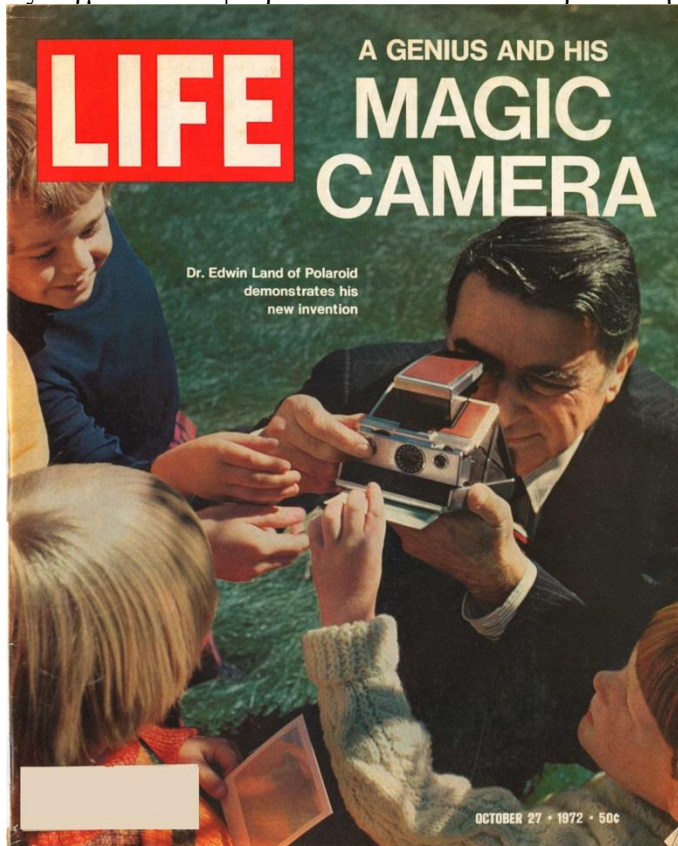
Εικόνα 3: Διαφήμιση Polaroid SX-70, Life Magazine, 1972

Ο τελικός στόχος του Land επιτεύχθηκε μετά από 25 χρόνια, το 1972, αυτό είχε ως αποτέλεσμα την ανάπτυξη της τεχνολογίας SX-70, η οποία εξάγει μηχανικά από τη φωτογραφική μηχανή μια εικόνα με λευκό περίγραμμα που εμφανίζεται μπροστά στα μάτια του χρήστη 6 . Το περιοδικό Popular Science τον Ιανουάριο του 1973 το χαρακτήρισε ως “μια από τις κορυφαίες τεχνολογικές εφευρέσεις της εποχής” 7 . Η απουσία του φιλμ που αποκολλάται, που διέθεταν οι προηγούμενες κάμερες της Polaroid, επέτρεπε την άμεση χρήση, καθιστώντας την το πιο εξελιγμένο και εφευρετικό καταναλωτικό προϊόν της εποχής της.