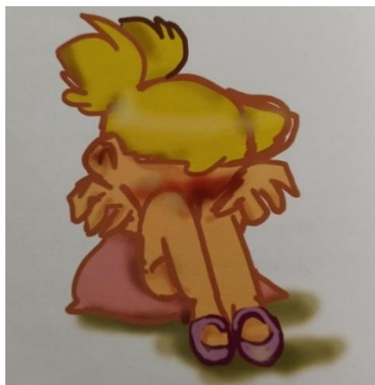
Εικόνα 1. Η εγγονή κοιτάζει προς τον ουρανό και χαμογελά.

την δική τους αισθητική οπτική. Μάλιστα, αποτυπώνεται με μοναδικό τρόπο ο σπαραγμός και ο θρήνος της εγγονής για τον θάνατο της γιαγιάς. Παρόλα αυτά, το παιδί αναγνώστης, διαβάζοντας μόνο την εικόνα, χάνει σημαντικό μέρος της ιστορίας, καθώς η μικρή τους έκταση δεν ενθαρρύνει την φαντασία του. Αυτό βέβαια ισορροπεί με την παραστατικότητα του κειμένου.