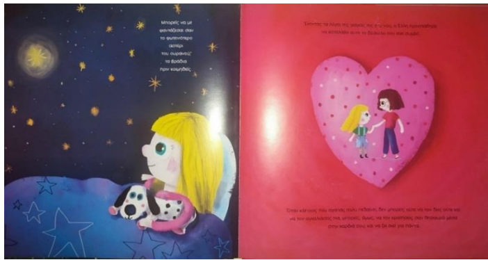
Εικόνα 16. Συνειδητοποίηση του θανάτου της γιαγιάς και τελικό μήνυμα.