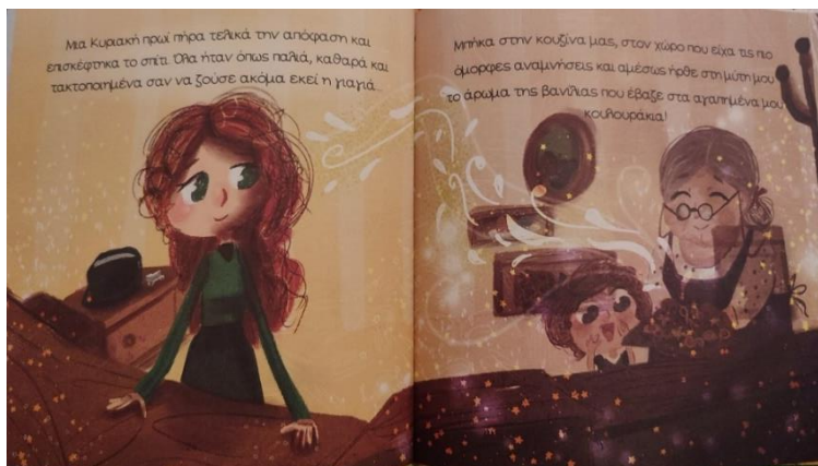
Εικόνα 14. Η εγγονή επισκέπτεται το σπίτι της γιαγιάς μετά τον θάνατο της και η ανάμνηση της παιδικής της ηλικίας.