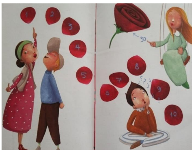
Εικόνα 8. Αποδοχή της απώλειας και επαναπροσδιορισμός του νοήματος της ζωής.