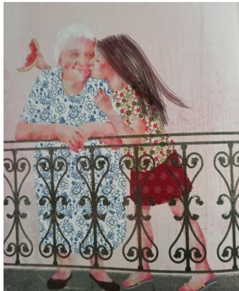
Εικόνα 5. Συναισθηματικό δέσιμο γιαγιάς και εγγονής.

Ως προς τον θάνατο της γιαγιάς, ενώ στο κείμενο γίνεται έμμεση αναφορά, η εικονογράφηση βοηθά στο να αποκαλυφθεί ο θάνατος στο παιδί αναγνώστη, παρέχοντας του συμπληρωματικές πληροφορίες μέσα από τρεις σκηνές. Στην πρώτη, απεικονίζεται η γιαγιά στην κορυφή της σκάλας να κάθεται μέσα σε ένα γαλάζιο σύννεφο, δίνοντας την αίσθηση ότι βρίσκεται πια στον ουρανό. Στην δεύτερη, η πολυθρόνα της γιαγιάς είναι άδεια και η εγγονή είναι σκεπτική και έχει στραμμένο το βλέμμα της στον ουρανό. Στην τρίτη, υποδηλώνεται έμμεσα μια μορφή τελετουργίας, με την φωτογραφία της γιαγιάς τοποθετημένη στο ράφι της κουζίνας και την εγγονή κρατώντας μια φέτα καρπούζι να κοιτά την φωτογραφία και να χαμογελά.