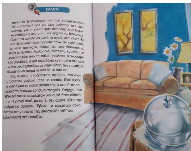
Εικόνα 11. Το σαλόνι της γιαγιάς

προωθείται μέσω της ιστορίας, ότι δηλαδή η ανάμνηση της γιαγιάς μέσα από τις συνταγές της θα συντροφεύει αιώνια το παιδί.