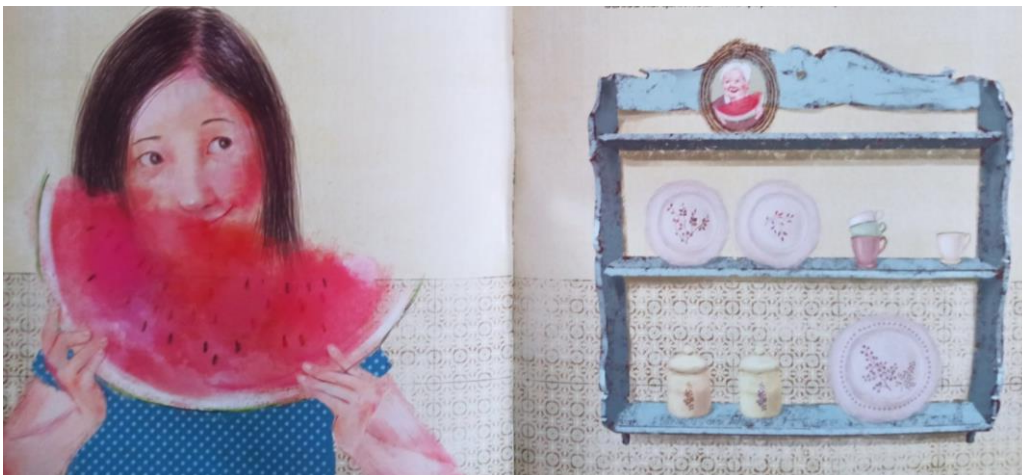
Εικόνα 6. Νοηματοδότηση της απώλειας της γιαγιάς.