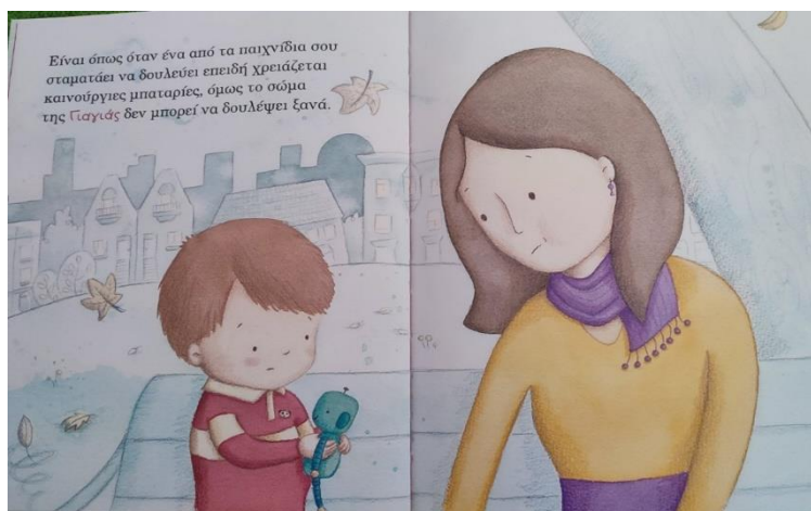
Εικόνα 9. Μαμά και γιος, μετά την απώλεια της γιαγιάς, σε εξωτερικό χώρο στο μουντό φόντο.

Είναι σημαντικό να τονιστεί πως οι πρωταγωνιστές εμφανίζονται εικονιστικά σε πρώτο, κοντινό πλάνο θέλοντας έτσι να δοθεί έμφαση στα συναισθήματα, στις εκφράσεις και στις κινήσεις τους. Παρόλα αυτά, στις δυο τελευταίες σκηνές της ιστορίας όπου διατυπώνεται το μήνυμα, αυτό της αγάπης, ο έντονος χρωματισμός επεκτείνεται και στο φόντο θέλοντας έτσι με αυτήν την επιλογή, προφανώς να τονιστεί τόσο το μήνυμα όσο και η αλλαγή στα συναισθήματα των ηρώων.