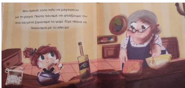
Εικόνα 13. Χαρούμενα μαγειρέματα γιαγιάς και εγγονής.

Στην σκηνή με την ανάμνηση της εγγονής στο σπίτι της γιαγιάς, τα χρώματα είναι σκούρα, έχοντας μουντές αποχρώσεις, οι οποίες προσδίδουν ένα τόνο μελαγχολικής διάθεσης (Πρεβεζάνου, 2011, σ. 61). Στην ίδια σκηνή οι φιγούρες φαίνονται σαν ξεθωριασμένες για να δείξει η εικονογράφος την ανάμνηση μιας άλλης εποχής.