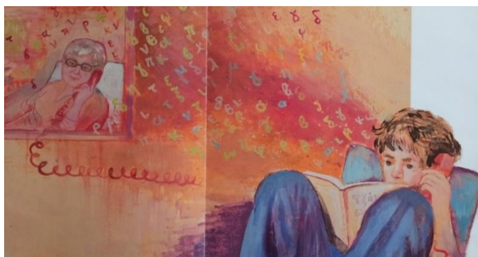
Εικόνα 4. Τηλεφωνική επικοινωνία γιαγιάς και εγγονού κατά την νοσηλεία της γιαγιάς.