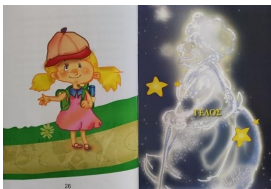
Εικόνα 2. Ο θρήνος της εγγονής για τον θάνατο της γιαγιάς.