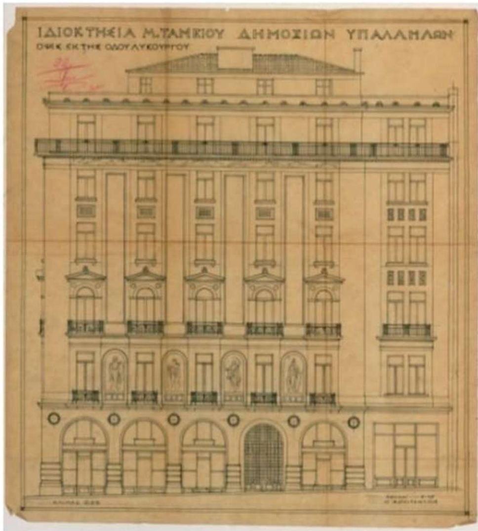
Εικόνα 1. Αρχιτεκτονικός σχεδιασμός Β. Κουρεμένου επί της οδού Λυκούργου και Αθηνάς. (11 Μαΐου 1927).