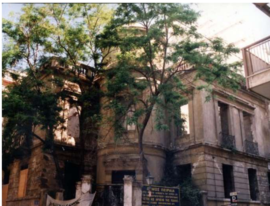
Εικόνα 14. Νεοκλασικό κτίριο, επί των οδών Μπουμπουλίνας και Κουντουριώτου πριν την αποκατάσταση του στην αρχική του μορφή

Μετά δε το 2010, το κτίριο χρησιμοποιείται ως χώρος πολιτιστικών εκδηλώσεων.