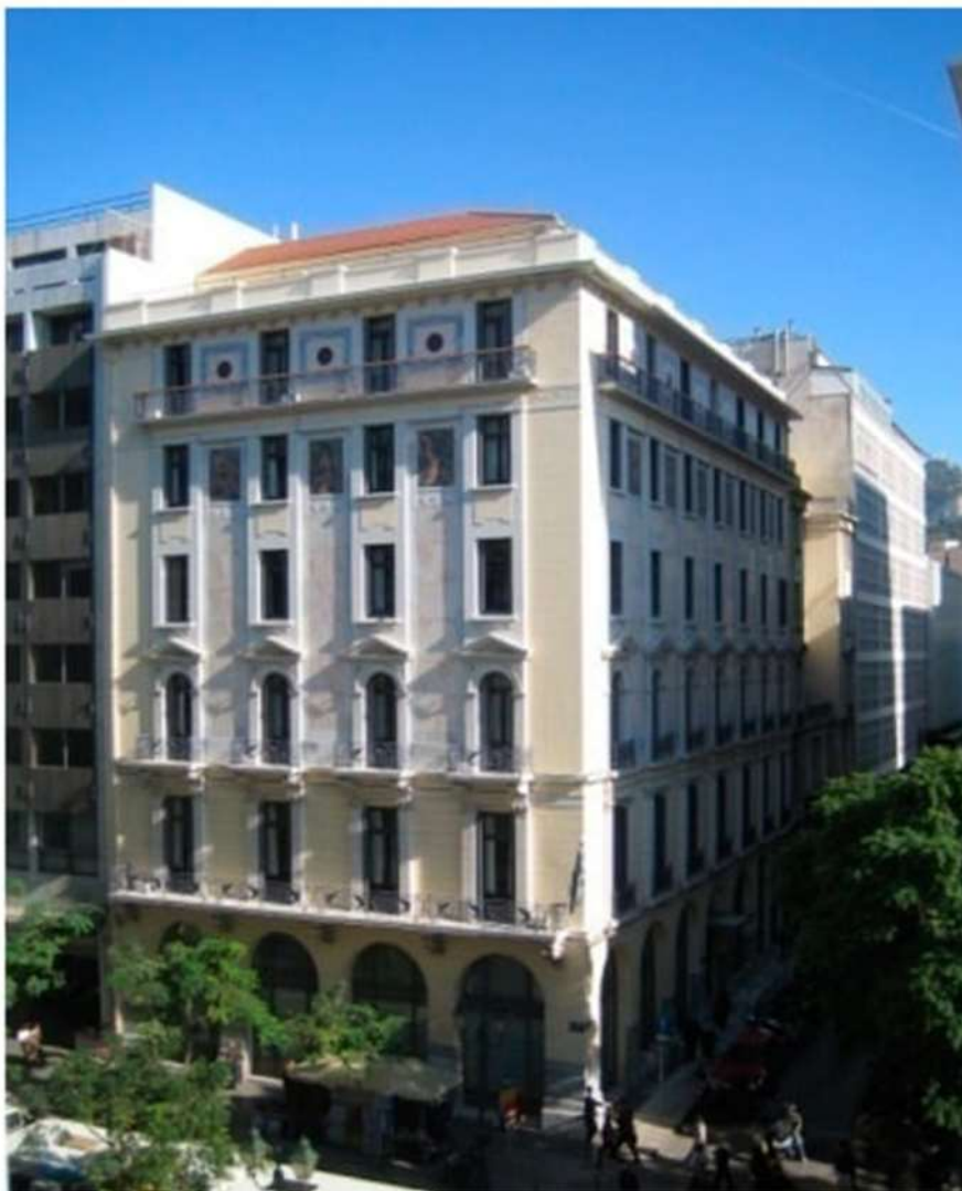
Εικόνα 2. Το κτίριο του Μετοχικού Ταμείου Δημοσίων Υπαλλήλων (CSJSF) μετά την αναστήλωση (22 Νοεμβρίου 2007).