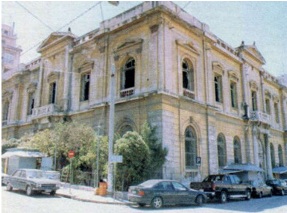
Εικόνα 5. Το Τηλεγραφείο ή Τηλεφωνείο ή Παλιό Ταχυδρομείο πριν την αναστήλωση του