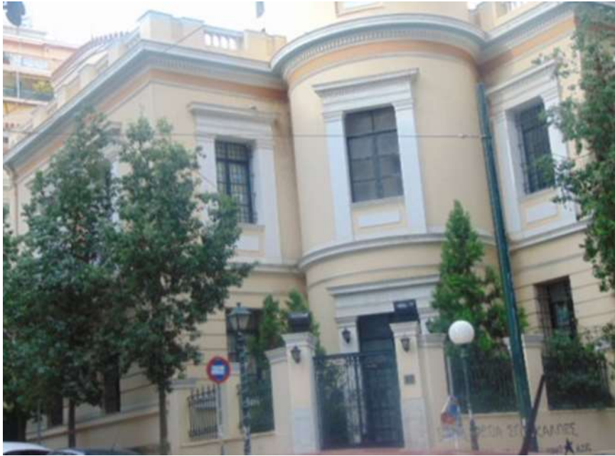
Εικόνα 15. Το ίδιο νεοκλασικό κτίριο μετά την αποκατάσταση του στην αρχική μορφή

Το κτίριο είναι τώρα Παιδικός Σταθμός του Δήμου Πειραιά.