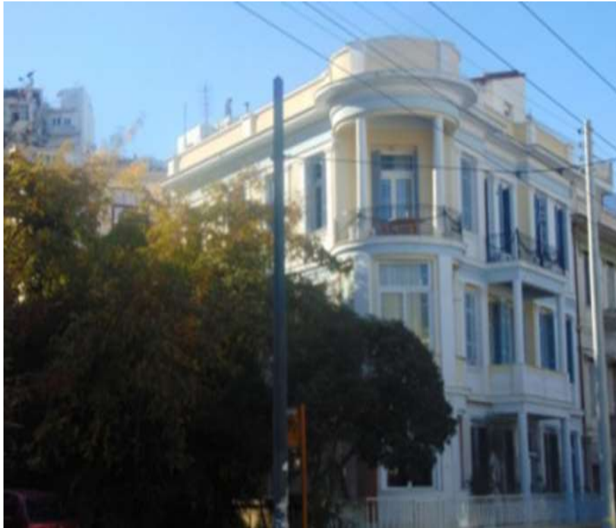
Εικόνα 28. Το ίδιο κτίριο μετά την ανακαίνιση του