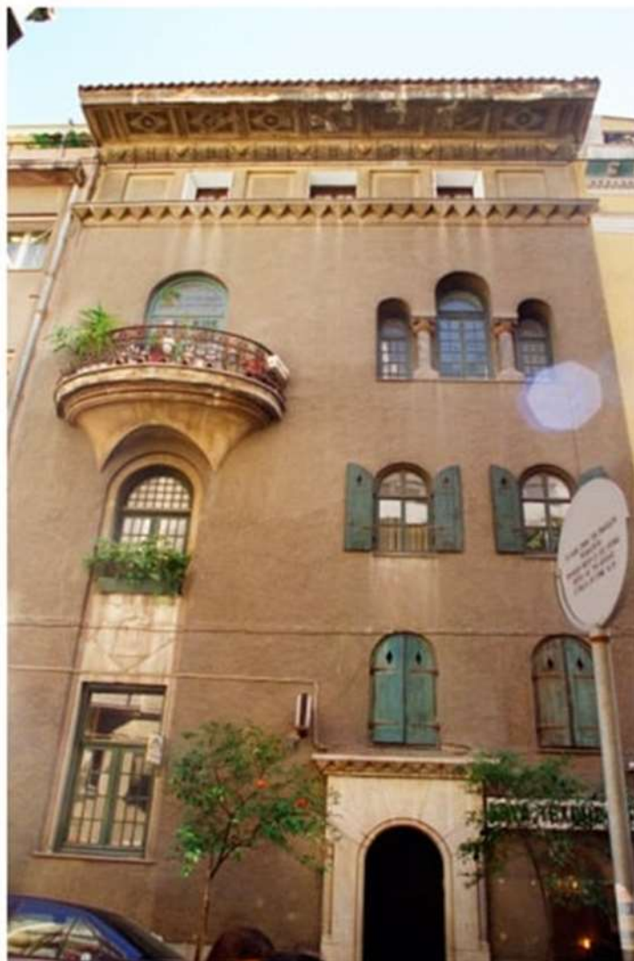
Εικόνα 6. Η πρόσοψη του κτιρίου στην οδό Πινδάρου. (1999).