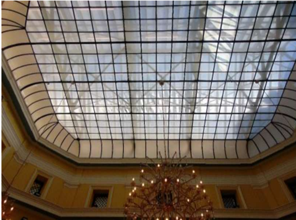
Εικόνα 7. Το Παλιό Ταχυδρομείο μετά την αναστήλωση του ως Δημοτική Πινακοθήκη (α)