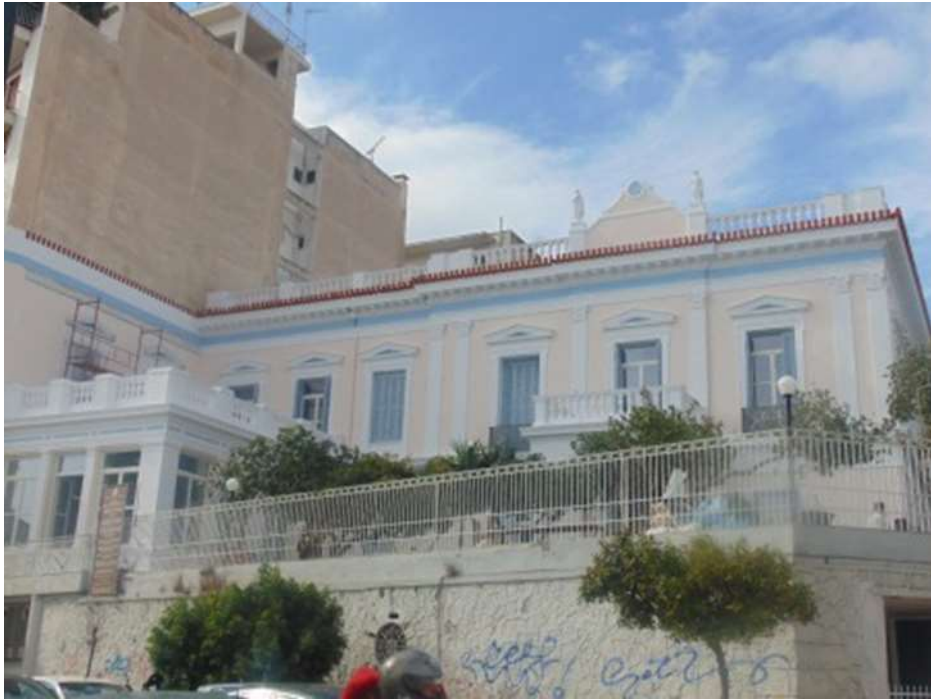
Εικόνα 25. Νεοκλασικό κτίριο πριν και μετά την εκ βάθρων ανακαίνιση του