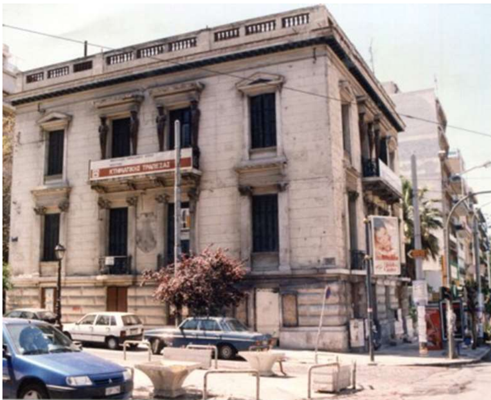
Εικόνα 16. Η νεοκλασική οικία του Ά. Μεταξά, έργο του Ερνέστο Τσίλλερ, πριν την αποκατάστασή της

Το κτίριο είναι τώρα Παιδικός Σταθμός του Δήμου Πειραιά.