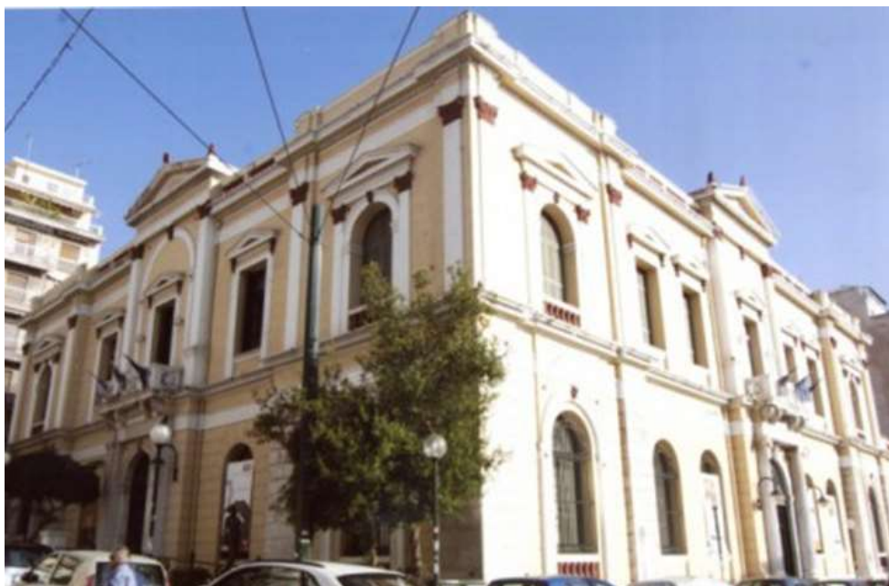
Εικόνα 6. Το Τηλεγραφείο ή Τηλεφωνείο ή Παλιό Ταχυδρομείο μετά την αναστήλωση του

Το Τηλεγραφείο ή Τηλεφωνείο ή Παλιό Ταχυδρομείο άρχισε να κτίζεται το 1899 και να λειτουργεί από την 1η Σεπτεμβρίου 1901. Μια καλά οργανωμένη ταχυδρομική υπηρεσία θα συνέβαλε στην αύξηση των εμπορικών συναλλαγών, στη βελτίωση της οικονομικής ζωής του Πειραιά, αλλά και της κοινωνικής ευημερίας των πολιτών του.