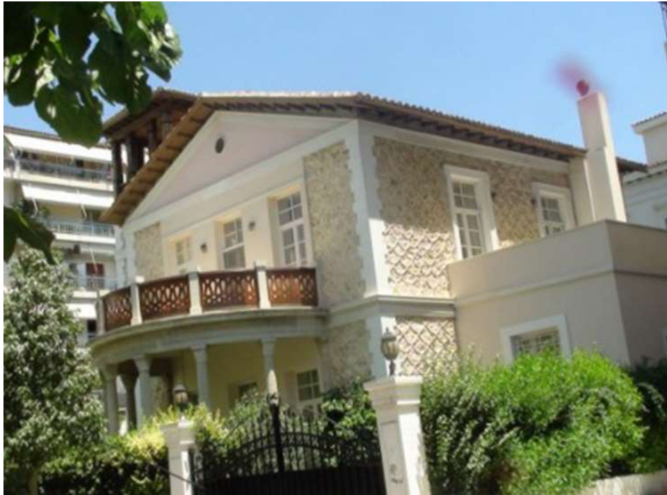
Εικόνα 4. Το ίδιο κτίριο σήμερα ως ιδιωτική κατοικία