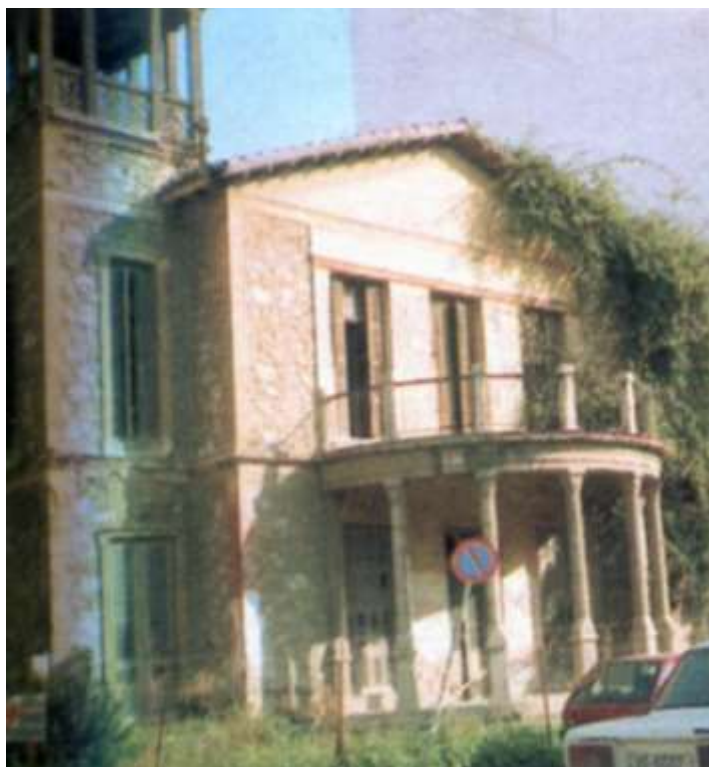
Εικόνα 1. Νεοκλασικό κτίριο επί της οδού Σμολένσκι, στο Νέο Φάληρο, πριν την ανακαίνιση του

Οι εικόνες των νεοκλασικών κτιρίων αναδύουν την αύρα ενός ιδιαίτερου ψυχισμού, που δεν είναι παρά η συναισθηματική προσέγγιση για την ποίηση που εκπέμπουν, για τη δυνατότητα που δίνουν σε μας να αφουγκραζόμαστε την ιστορία τους και να ανακαλούμε στη μνήμη τη διαλεκτική σχέση που έχουν μέσω των χρήσεων τους με τις λειτουργίες της πόλης. Ο κύριος λόγος που διατηρούνται τα παλαιά κτίρια είναι η διατήρηση της συλλογικής μνήμης της κοινωνίας. Κάθε παράδειγμα του παρελθόντος εικονοποιεί την ιστορία (Ritter, 2004).