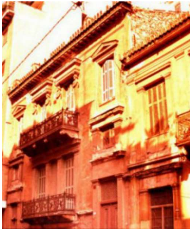
Εικόνα 31. Νεοκλασικό κτίριο επί της Καλλιγά πριν την ανακαίνιση του