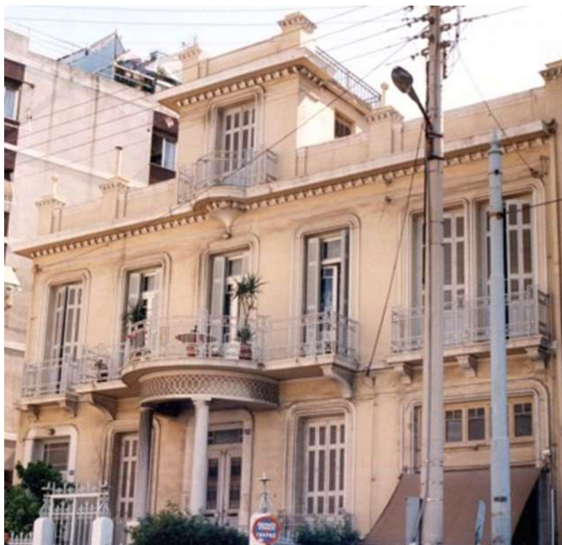
Εικόνα 29. Κτίριο Μεσοπολέμου επί της Σχιστής πριν την ανακαίνιση