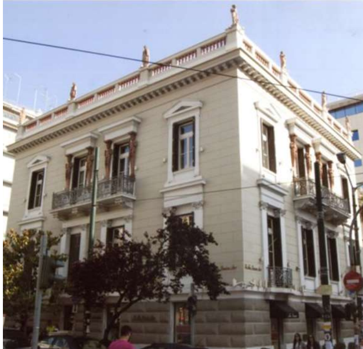
Εικόνα 17. Η νεοκλασική οικία του Ά. Μεταξά, έργο του Ερνέστο Τσίλλερ, μετά την αποκατάστασή της

Η νεοκλασική οικία του Ά. Μεταξά, έργο του Ερνέστο Τσίλλερ, άρχισε να κτίζεται το 1897 σύμφωνα με μια μεταλλική επιγραφή, που υπήρχε μέχρι την τελευταία δεκαετία του 20ου αιώνα στην πόρτα της εισόδου, από την πλευρά της οδού Γρηγορίου Λαμπράκη.