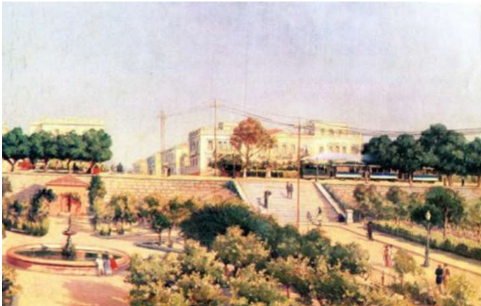
Εικόνα 24. Έγχρωμος πίνακας του Βασιλείου Χατζή

Στον πίνακα εικονίζεται η Τερψιθέα, στο τμήμα της τότε λεωφόρου Σωκράτους, μετέπειτα Βασιλέως Κωνσταντίνου και σήμερα Ηρώων Πολυτεχνείου. Ο πίνακας έχει ληφθεί από το πρωτότυπο, το οποίο ανήκει στη συλλογή του Ευριπίδη Κουτλίδη. Διακρίνουμε 3 νεοκλασικά κτίρια, από τα οποία το μεσαίο είχε ανακαινισθεί στη δεκαετία του 1980, ενώ τα δύο άλλα κτίρια εκατέρωθεν έχουν ήδη κατεδαφισθεί (Σταματίου, 2008).