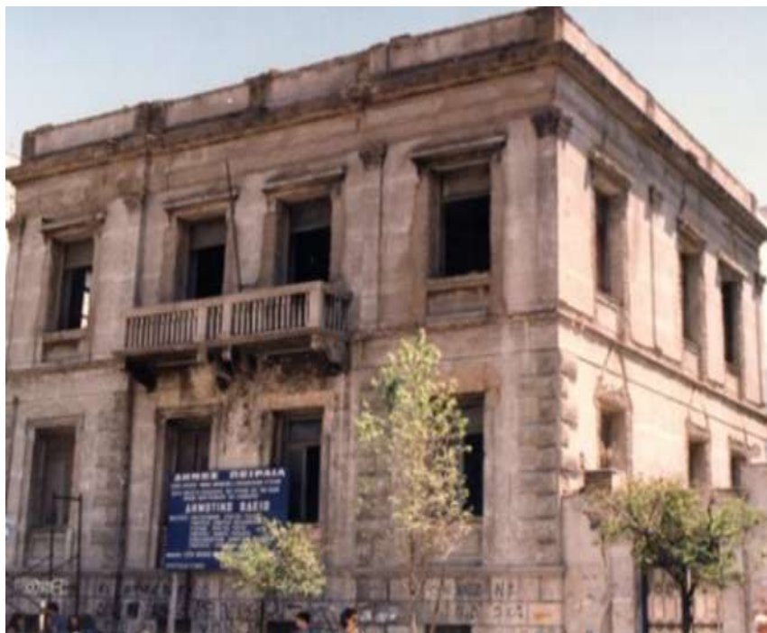
Εικόνα 12. Νεοκλασικό κτίριο επί των οδών Ηρώων Πολυτεχνείου και Κανθάρου, πριν την ανακαίνιση του