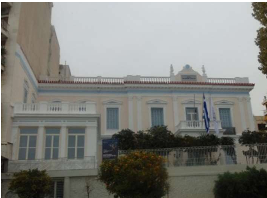
Εικόνα 26. Η γνωστή οικία Στρίγγου, που σήμερα ανήκει στο "Ίδρυμα Αικατερίνης Λασκαρίδη"