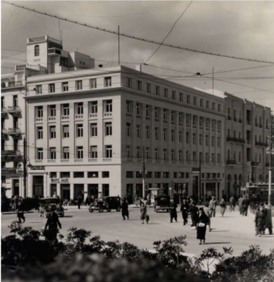
Εικόνα 4. Το κτίριο του CSJSF του αρχιτέκτονα Ε. Λαζαρίδη (περίπου 1938–39).