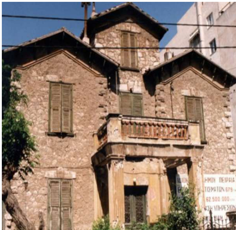
Εικόνα 10. Κτίριο στη Φαληρέως 5 πριν την ανακαίνιση του (1996)