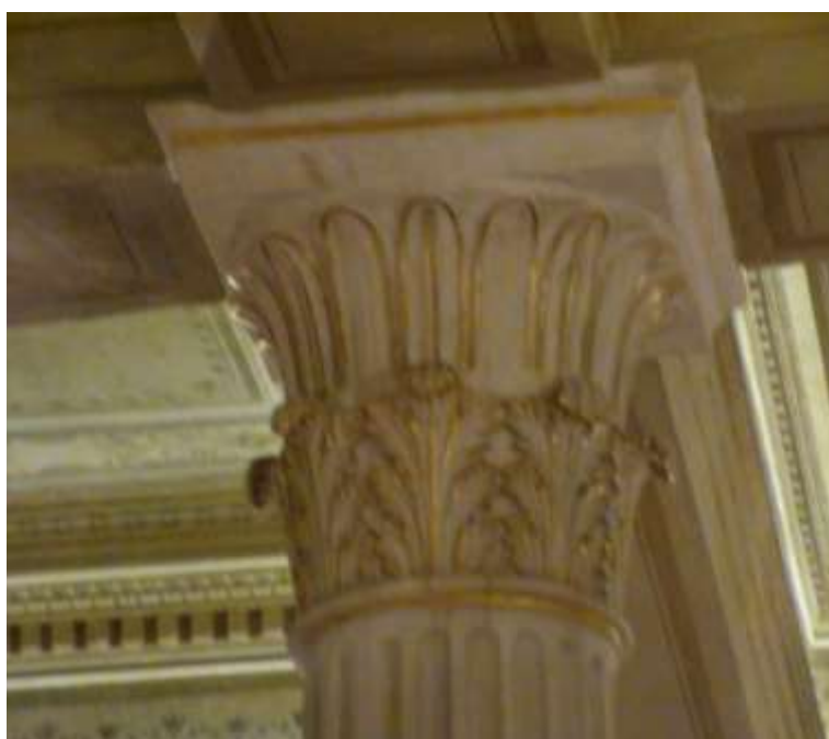
Εικόνα 22. Στην είσοδο του Δημοτικού Θεάτρου κιονόκρانا κορινθιακού ρυθμού