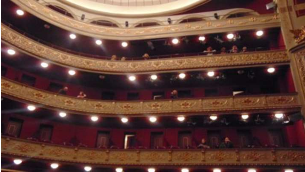
Εικόνα 23. Θεωρεία του Δημοτικού θεάτρου