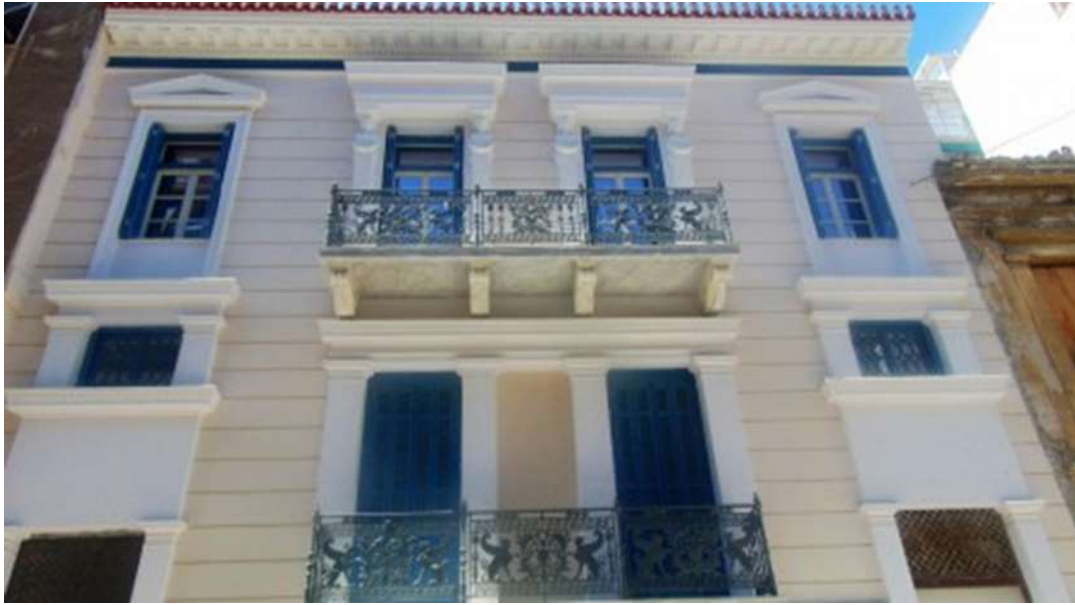
Εικόνα 32. Το ίδιο κτίριο μετά την ανακαίνισή του, τον Απρίλιο του 2016