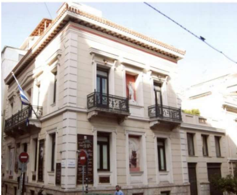
Εικόνα 20. Νεοκλασικό κτίριο, επί των οδών Πραξιτέλους και Μπουμπουλίνας, μετά την αναστήλωση του