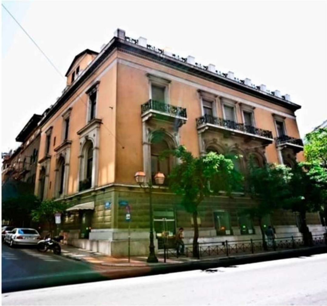
Εικόνα 7. Η Κατοικία Δεληγιώργη στη γωνία Πινδάρου, Ακαδημίας και Κανάρη 1.

Τα παραπάνω κτίρια έχουν χαρακτηριστεί ως διατηρητέα κτίρια ή ως έργα τέχνης, τα οποία προστατεύονται από την Ελληνική Νομοθεσία και αποτελούν αντιπροσωπευτικά δείγματα των αρχιτεκτονικών τάσεων της εποχής τους, ως μνημεία της αρχιτεκτονικής μας κληρονομιάς. Οι σπουδαίες ιστορικές και μορφολογικές πτυχές αυτών των πέντε ιστορικών κτιρίων της Αθήνας αναδεικνύουν ζητήματα που σχετίζονται με μορφολογικές αλλαγές που σηματοδοτούν την αρχιτεκτονική τάση της πόλης των Αθηνών από τις αρχές του προηγούμενου αιώνα έως τον Μεσοπόλεμο [ 5]. Αυτές οι διακυμάνσεις ξεκίνησαν γύρω στη δεκαετία του 1900, όταν ο Τσίλερ ενίσχυσε το ελληνικό κλασικό στυλ με την εισαγωγή ελληνικών στοιχείων, και λίγο αργότερα (δεκαετία 1922–1930) όταν σημαντικοί αρχιτέκτονες εργάστηκαν στην Αθήνα. Οι περισσότεροι από τους οποίους σπούδασαν σε αρχιτεκτονικές σχολές της Κεντρικής Ευρώπης και της Κωνσταντινούπολης, αφού το 1917 ιδρύθηκε η πρώτη Ελληνική Αρχιτεκτονική Σχολή [ 6 , 7 ].