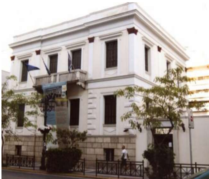
Εικόνα 13. Το ίδιο κτίριο μετά την ανακαίνιση του για ένα διάστημα (2006-- 2010) λειτουργούσε ως Δημαρχείο.

Μετά δε το 2010, το κτίριο χρησιμοποιείται ως χώρος πολιτιστικών εκδηλώσεων.