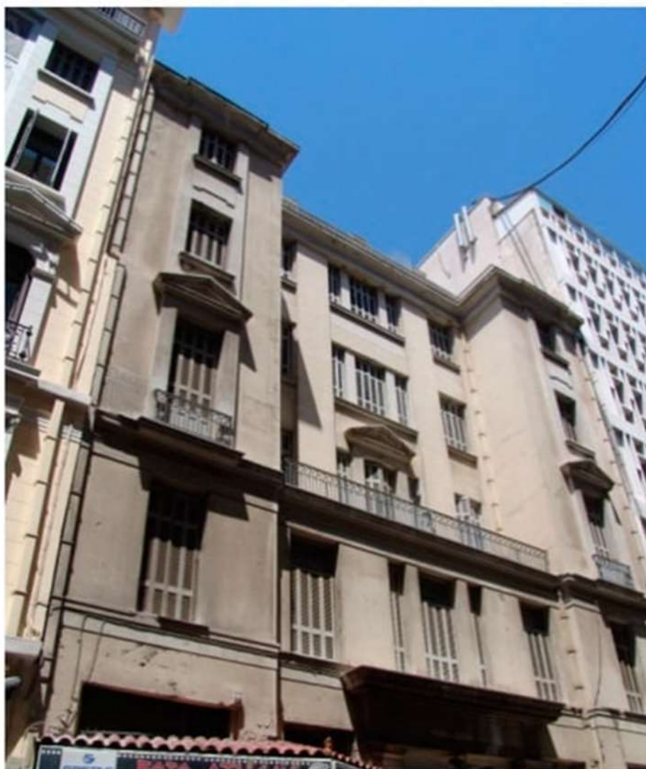
Εικόνα 5. Άποψη του κτιρίου από την οδό Λυκούργου. (2007).