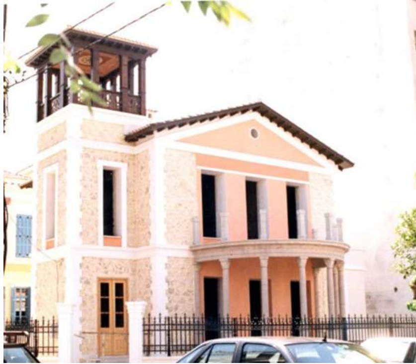
Εικόνα 2. Το ίδιο κτίριο κατά τη διάρκεια της ανακαίνισης του