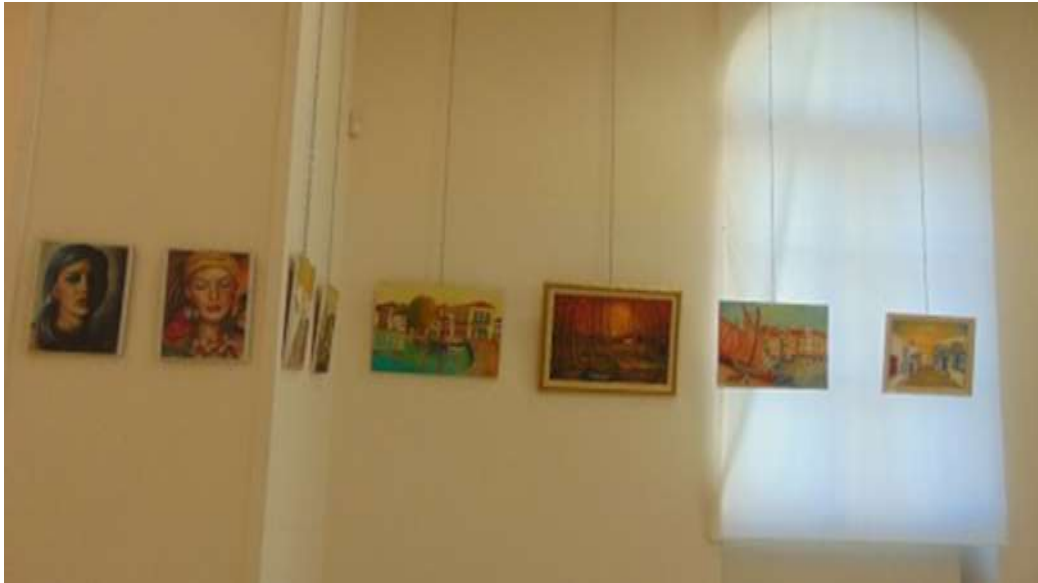
Εικόνα 9. Στους χώρους της Δημοτικής Πινακοθήκης φιλοξενούνται εκθέσεις ζωγραφικής