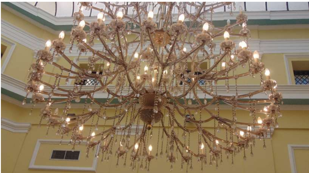
Εικόνα 8. Το Παλιό Ταχυδρομείο μετά την αναστήλωση του ως Δημοτική Πινακοθήκη (β)