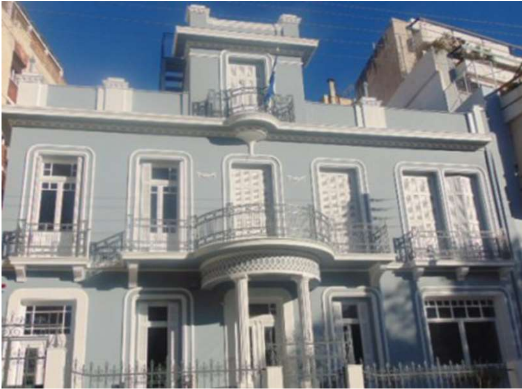
Εικόνα 30. Το ίδιο κτίριο μετά την ανακαίνιση