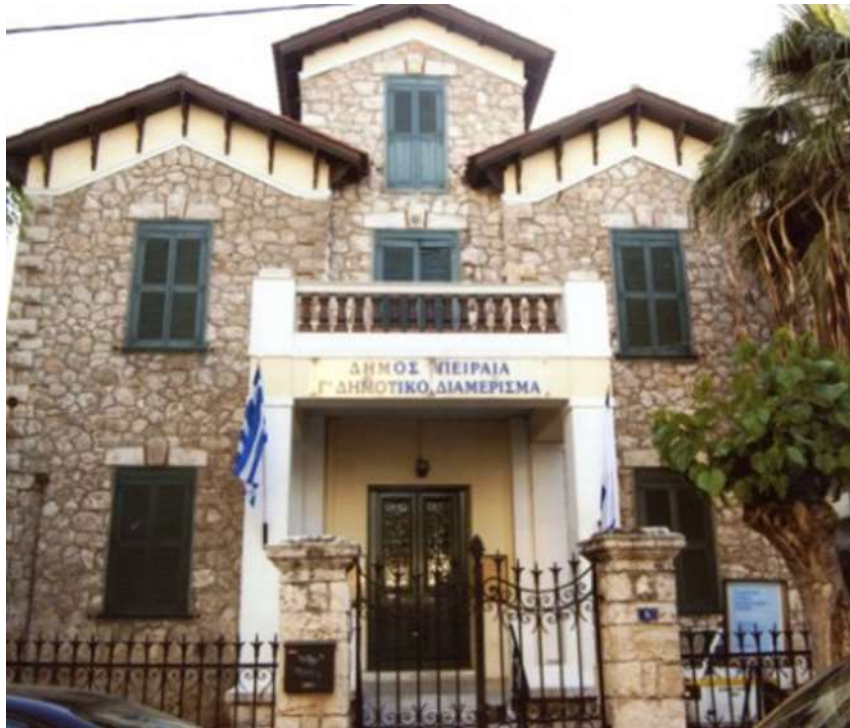
Εικόνα 11. Το ίδιο κτίριο μετά την ανακαίνιση του