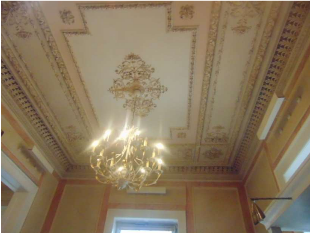
Εικόνα 18. Ο ζωγραφικός διάκοσμος στην οροφή

Ο ζωγραφικός διάκοσμος στην οροφή και στους τοίχους της οικίας Μεταξά ενέπνευσε τον μικρό τότε Γ. Τσαρούχη