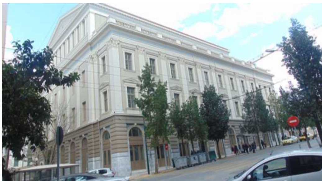
Εικόνα 21. Το Δημοτικό Θέατρο μετά την αναπαλαίωση