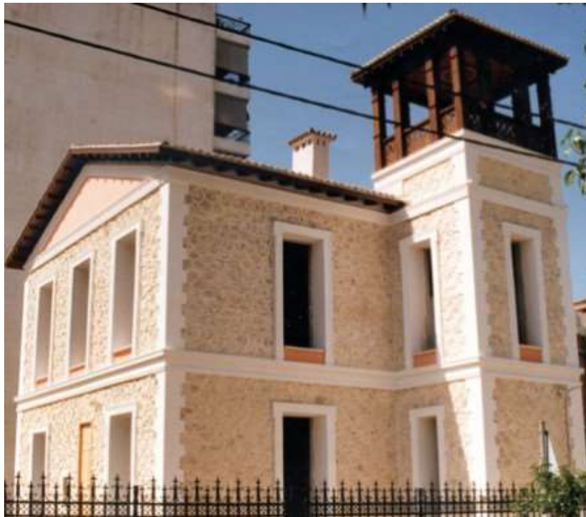
Εικόνα 3. Το ίδιο κτίριο μετά την ολοκλήρωση της ανακαίνισης του