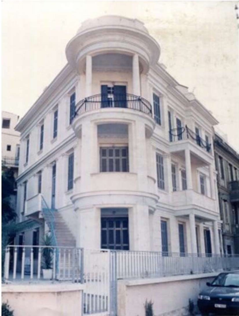
Εικόνα 27. Κτίριο του Μεσοπολέμου επί της Βασιλέως Παύλου, στην Καστέλα, πριν την ανακαίνιση