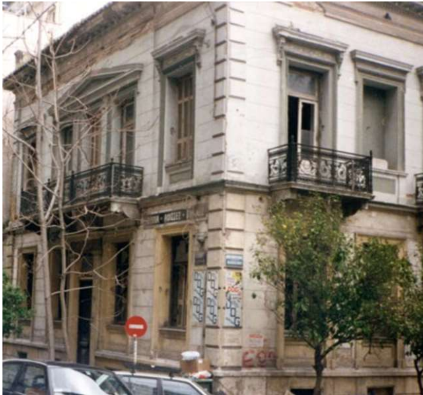
Εικόνα 19. Νεοκλασικό κτίριο, επί των οδών Πραξιτέλους και Μπουμπουλίνας, πριν την αναστήλωση του

Στην αρχή του 2000, όταν αγόρασε το ερειπωμένο τότε κτίριο του Ά. Μεταξά η εταιρεία Γιου, το αναστήλωσε. Η αναστήλωση βασίσθηκε στο σεβασμό της αρχικής του υπόστασης και ανέδειξε τα αυθεντικά στοιχεία της αρχικής αρχιτεκτονικής του σύνθεσης. Στεγάζει δε μέχρι τον Απρίλιο του 2015 επώνυμη αλυσίδα ενδυμάτων και λειτουργεί ως καφετέρια στον υπαίθριο χώρο, η διαμόρφωση του οποίου αποτελούσε ένα από τα γνωρίσματα που χαρακτήριζαν το αστικό αυτό μέγαρο. Από τον Μάιο όμως του 2015 το κτίριο αυτό είναι κλειστό. Οι λόγοι όμως δεν είναι γνωστοί.