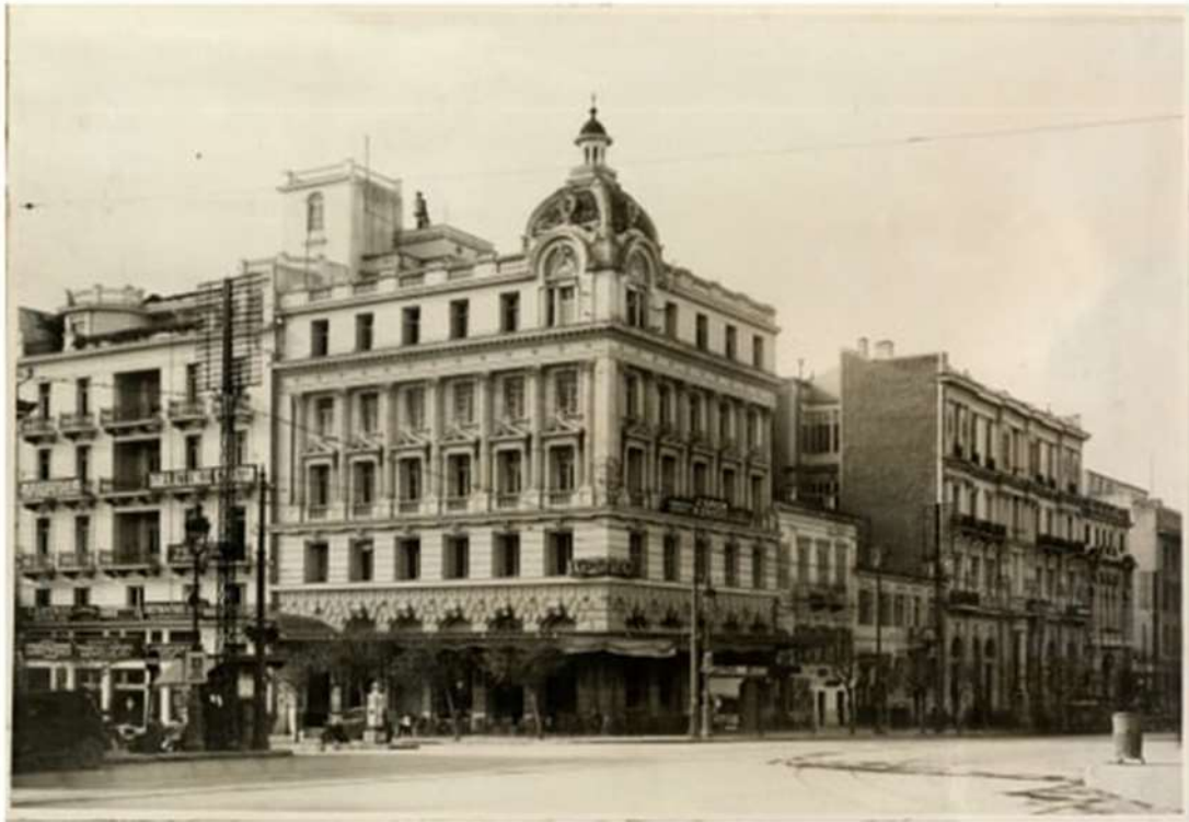
Εικόνα 3. Το κτίριο του αρχιτέκτονα Κ. Κυριακίδη στη γωνία Πανεπιστημίου 37 και Κοραή 2. (περίπου 1931).