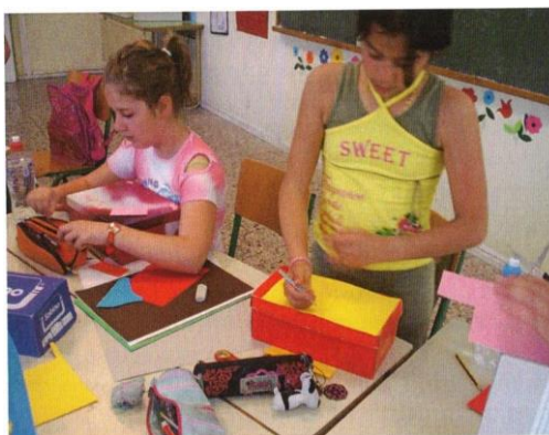
Εικόνα 9. Τα παιδιά του 61 ου Δημοτικού Σχολείου Θεσσαλονίκης κατασκευάζουν το κουτί των αναμνήσεων. Πηγή: Το βιβλίο της Αναγνωστοπούλου, Τ., & Χατζηνικολάου, Σ. (2015). Το πένθος στα παιδιά. Ένας οδηγός για γονείς και εκπαιδευτικούς . Θεσσαλονίκη: Ινστιτούτο Ψυχολογίας και Υγείας.