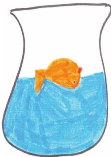
Εικόνα 4. Ζωγραφιά της Κέλης από το 81 ο Δημοτικό Σχολείο Θεσσαλονίκης με θέμα «Το νεκρό χρυσόψαρο». Πηγή: Το βιβλίο της Αναγνωστοπούλου, Τ., & Χατζηνικολάου, Σ. (2015). Το πένθος στα παιδιά. Ένας οδηγός για γονείς και εκπαιδευτικούς . Θεσσαλονίκη: Ινστιτούτο Ψυχολογίας και Υγείας.

Σε αυτήν την ενότητα παρουσιάζονται δραστηριότητες για την κατανόηση από τα παιδιά των εννοιών του θανάτου, της απώλειας και του πένθους. Ο παιδαγωγός μπορεί να συζητήσει με τα παιδιά για τα ταφικά έθιμα και να ζητήσει από τα παιδιά να καταγράψουν τις απώλειες στην οικογένεια τους, ρωτώντας τον παππού και την γιαγιά. Επίσης, ο παιδαγωγός βοηθάει τα παιδιά να διαχωρίσουν τις σοβαρές απώλειες της ζωής από τον μη ρεαλιστικό τρόπο που παρουσιάζεται ο θάνατος στα κινούμενα σχέδια. Επιπρόσθετα, ο παιδαγωγός μπορεί να βοηθήσει τα παιδιά να αναπτύξουν την κριτική τους σκέψη σχετικά με τον τρόπο που παρουσιάζονται οι απώλειες και ο θάνατος μέσα από τις ειδήσεις στην τηλεόραση (βλ. Εικ. 4) (Αναγνωστοπούλου & Χατζηνικολάου, 2015).