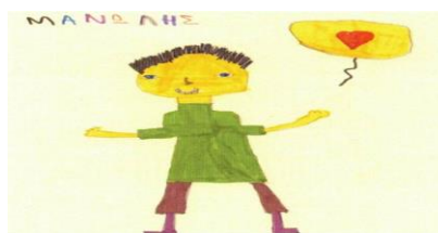
Εικόνα 7. Ζωγραφιά με αποχαιρετιστήριο μπαλόνι από έναν μαθητή του 61 ου Δημοτικού Σχολείου Θεσσαλονίκης.