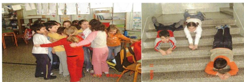
Εικόνα 2. «Σταγονένιες» ζωές στο 31 ο Δημοτικό Σχολείο Θεσσαλονίκης: Ο χορός στο σύννεφο (αριστερά) και το κύλισμα των «σταγόνων» προς τη θάλασσα» (δεξιά).