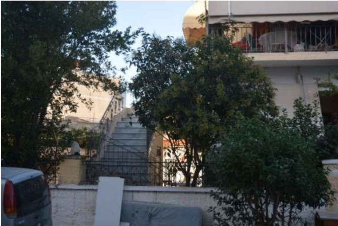
Εικόνα 11: Ελευσίνα