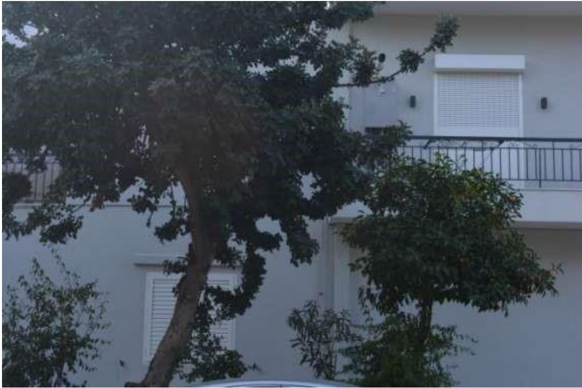
Εικόνα 19: Αιγάλεω