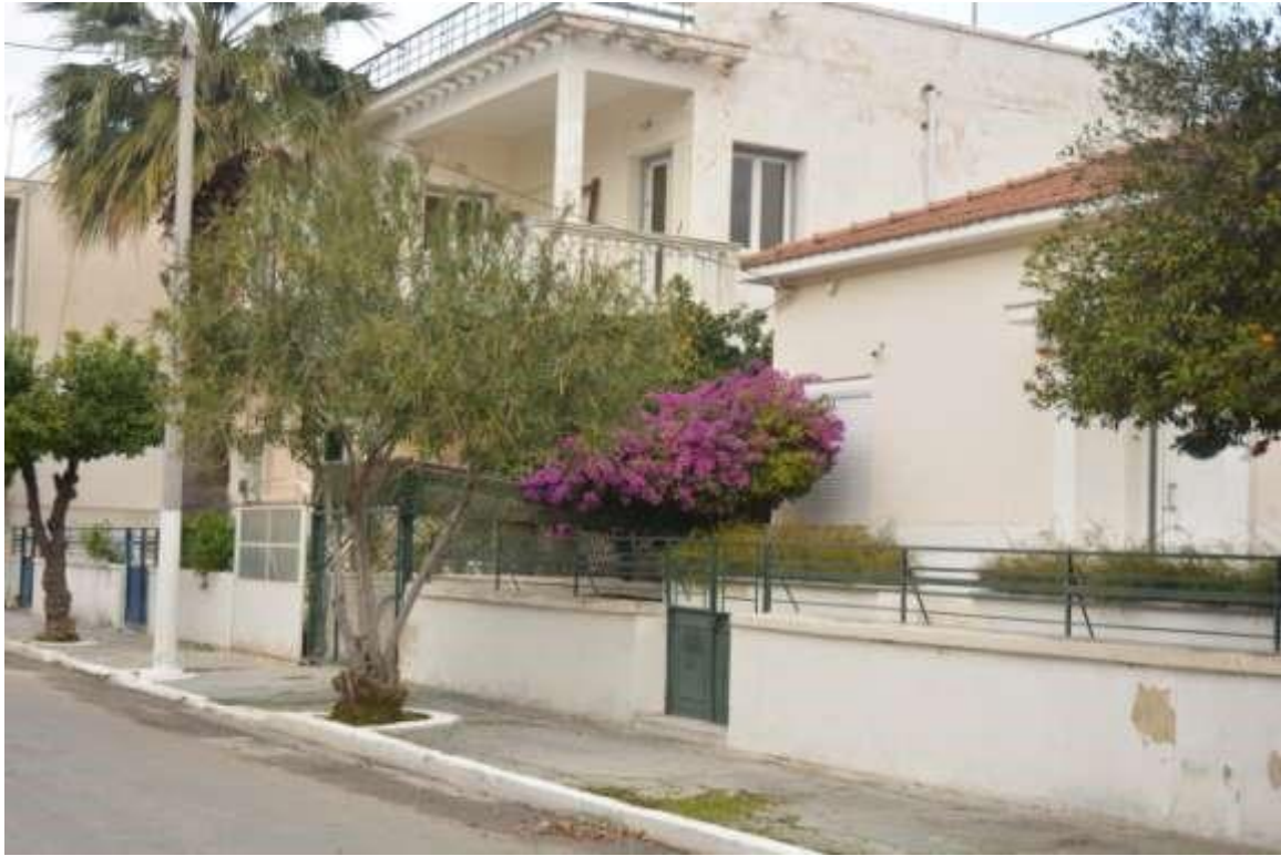
Εικόνα 18: Αιγάλεω