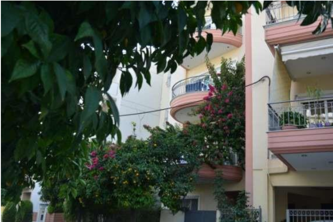
Εικόνα 14: Αιγάλεω