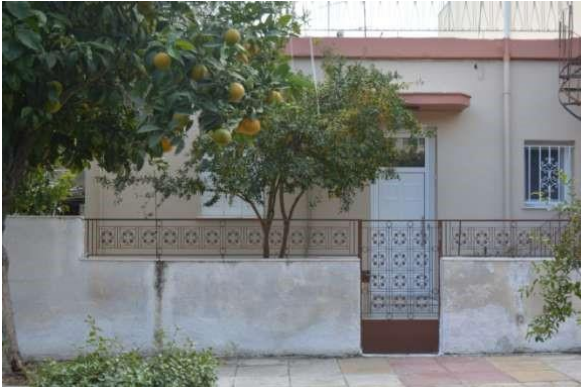
Εικόνα 27: Αιγάλεω