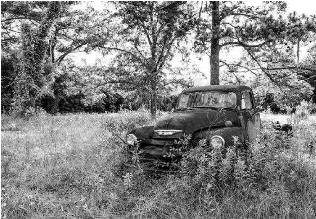
Εικόνα 10 Εγκαταλελειμμένο φορτηγό αντίκα σε ένα χωράφι του αμερικανικού νότου – ασπρόμαυρη φωτογραφία

Παρόλο που ο Keith Dotson, σπάνια αποθανατίζει ανθρώπους, η παρουσία του ανθρωπισμού δεν είναι ποτέ μακριά από τις πόλεις και τα ποικίλα σκηνικά και τοπία καθώς με αυτόν τον τρόπο παρουσιάζει την ύπαρξη του ανθρώπου μέσω των στοιχείων που τραβάει φωτογραφικά.