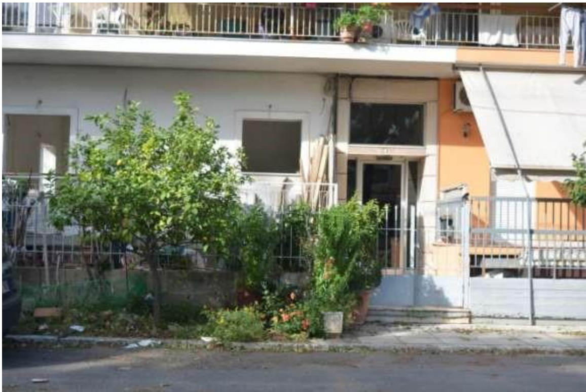
Εικόνα 21: Ελευσίνα