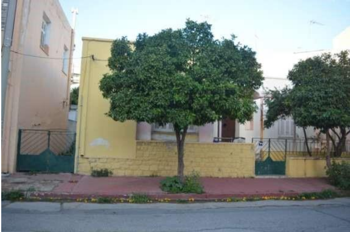
Εικόνα 29: Ελευσίνα