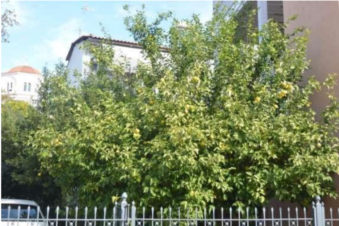
Εικόνα 22: Ελευσίνα