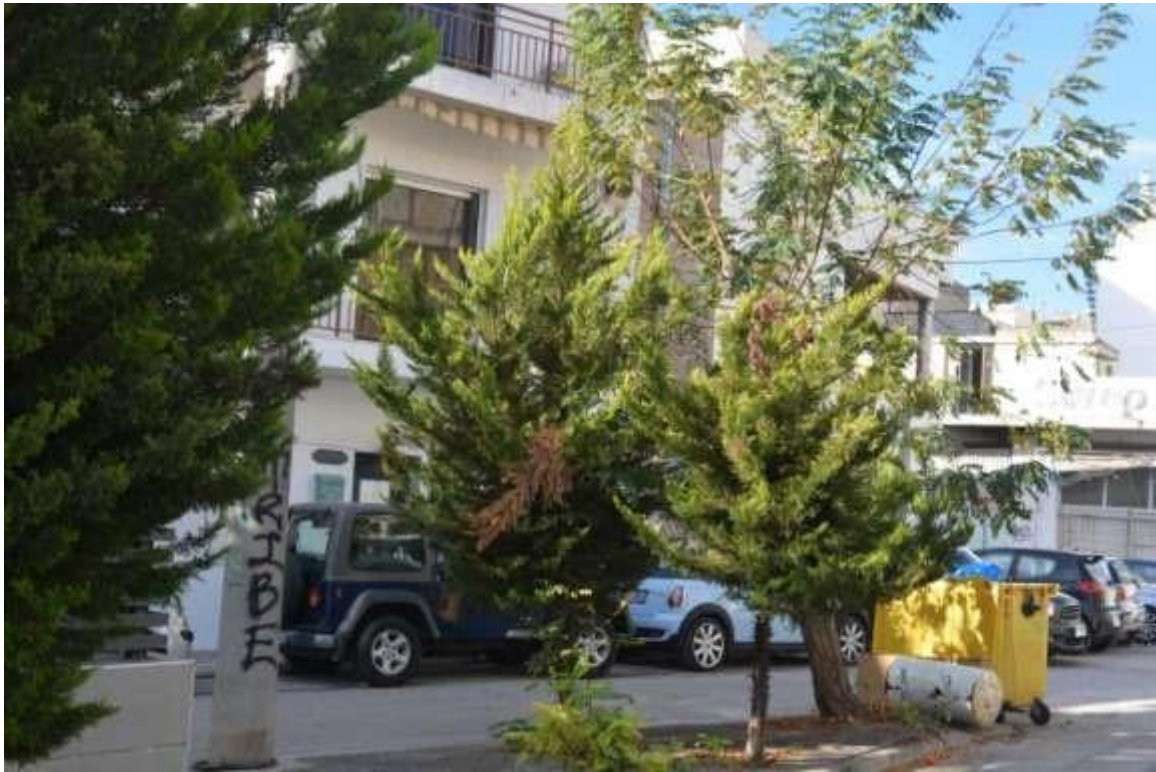
Εικόνα 23: Αιγάλεω