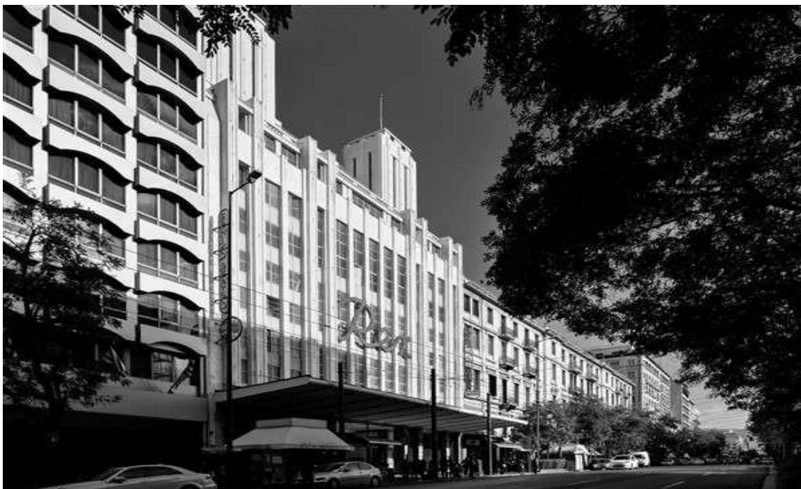
Εικόνα 3: Πανεπιστημίου- Rex (Σγούτσας, 2022)

Επιπροσθέτως, ως αστικό τοπίο μπορούμε να χαρακτηρίσουμε την έννοια της πόλης. Η έννοια αυτή δύναται να οριστεί σε έναν αρκετά μεγάλο βαθμό ως χωρικά προσδιορισμένη της αντίληψή της και έτσι δύναται να περιγραφούν τα ποικίλα φαινόμενα που συμβαίνουν μέσα σε αυτή αρχιτεκτονικά αλλά και πολεοδομικά (Παπαγεωργίου, 2019). Η μεγαλύτερη απόκλιση μεταξύ τους έγκειται στον διαμερισμό όσον αφορά τον χώρο και τον χρόνο και έγκειται στο ότι ο πρώτος αποτελεί μια ευρύτερη οντότητα με αφαιρετικό νόημα, περισσότερο γεωμετρικά καθορισμένη η οποία υπήρχε και εμφάνιζε όλα τα χαρακτηριστικά της εξ' αρχής (a priori) (Παπαγεωργίου, 2019). Από την αντίθετη μεριά, ως τόπος μπορεί να προσδιοριστεί αυτό που εγκυμονεί τόσο τη σημασιολογία του χώρου, καθώς στην προκειμένη περίπτωση αφορά την πόλη γενικά πολύ πριν δημιουργηθεί και συμπερασματικά αναφερόμαστε στο φυσικό περιβάλλον. Επιπροσθέτως, όσον αφορά την ανθρώπινη παρουσία αυτή προσδιορίζεται με την παρεμβατικότητα του ανθρώπινου παράγοντα στο φυσικό τοπίο, δηλαδή την επέμβαση του ανθρώπου στη φύση και τη εγκαθίδρυση ενός καλύτερου δομημένου ή του ανθρωπογενούς περιβάλλοντος.