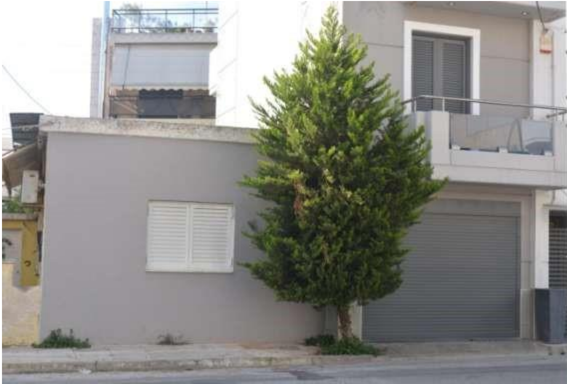
Εικόνα 30: Αιγάλεω