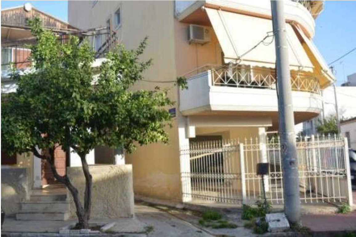
Εικόνα 12: Αιγάλεω