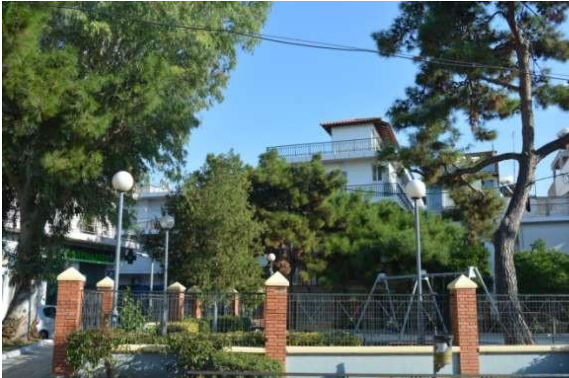
Εικόνα 17: Αιγάλεω