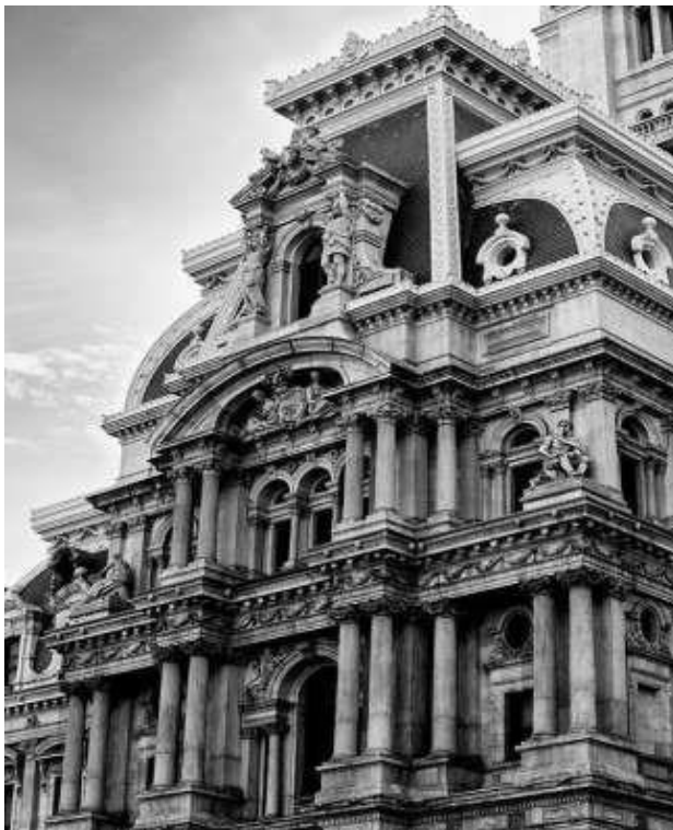
Εικόνα 9 Το δημαρχείο της Φιλαδέλφεια (keithdotson.com, 2024)

Σύμφωνα με τον ίδιο «το τοπίο έχει ένα πνεύμα που διαμορφώνεται από την αισθητική, τον καιρό, τη γεωγραφία, την τοπογραφία, την ιστορία και την ανθρώπινη δραστηριότητα» (keithdotson.com, 2024).