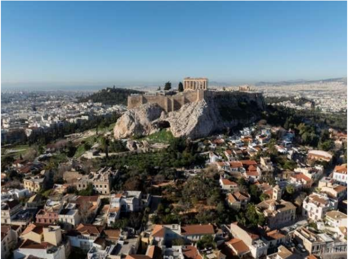
Εικόνα 8 Άποψη της Ακρόπολης