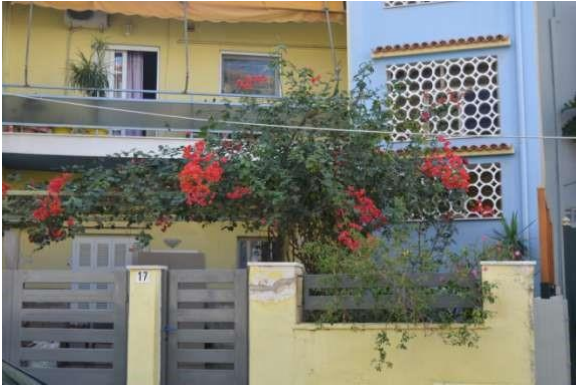
Εικόνα 15: Αιγάλεω