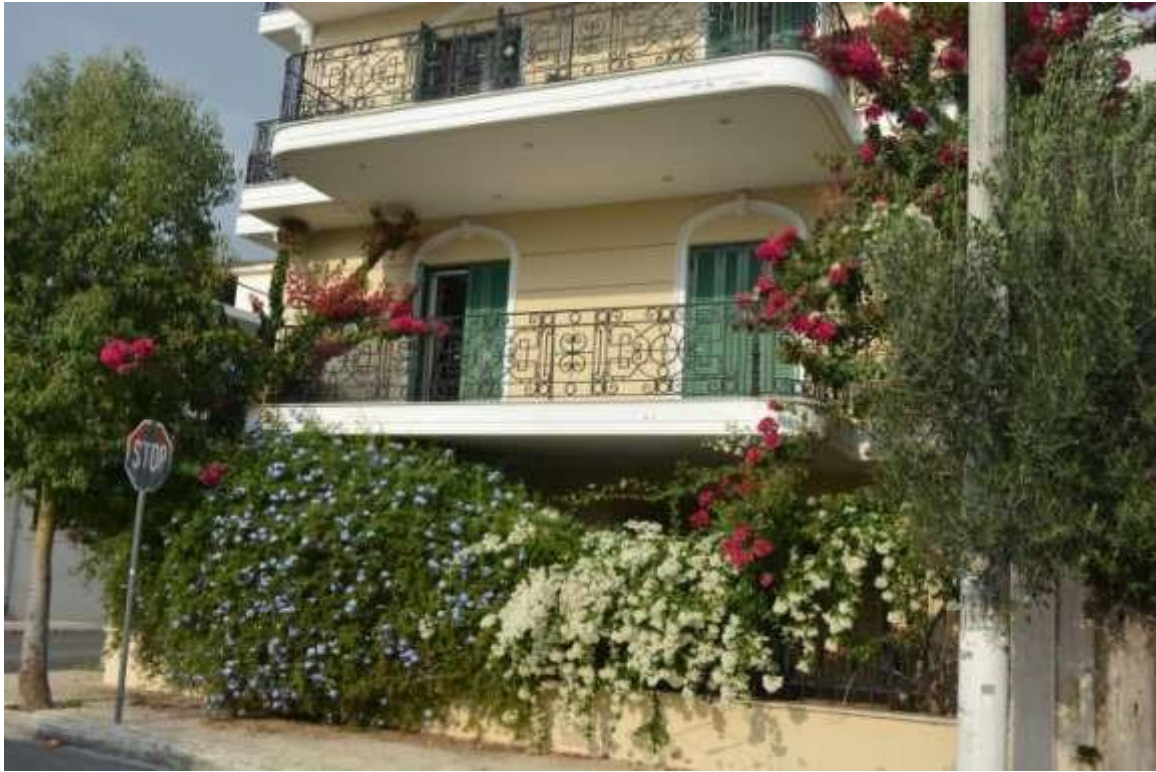
Εικόνα 16: Αιγάλεω