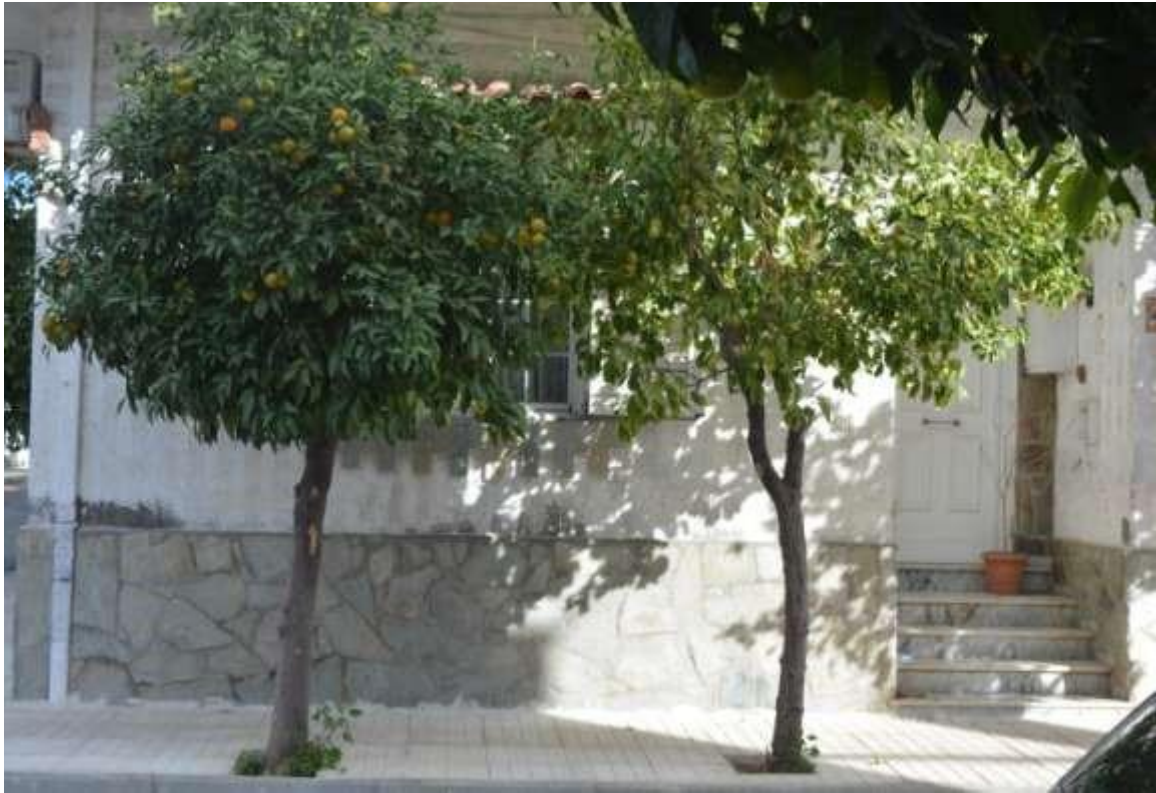
Εικόνα 24: Ελευσίνα