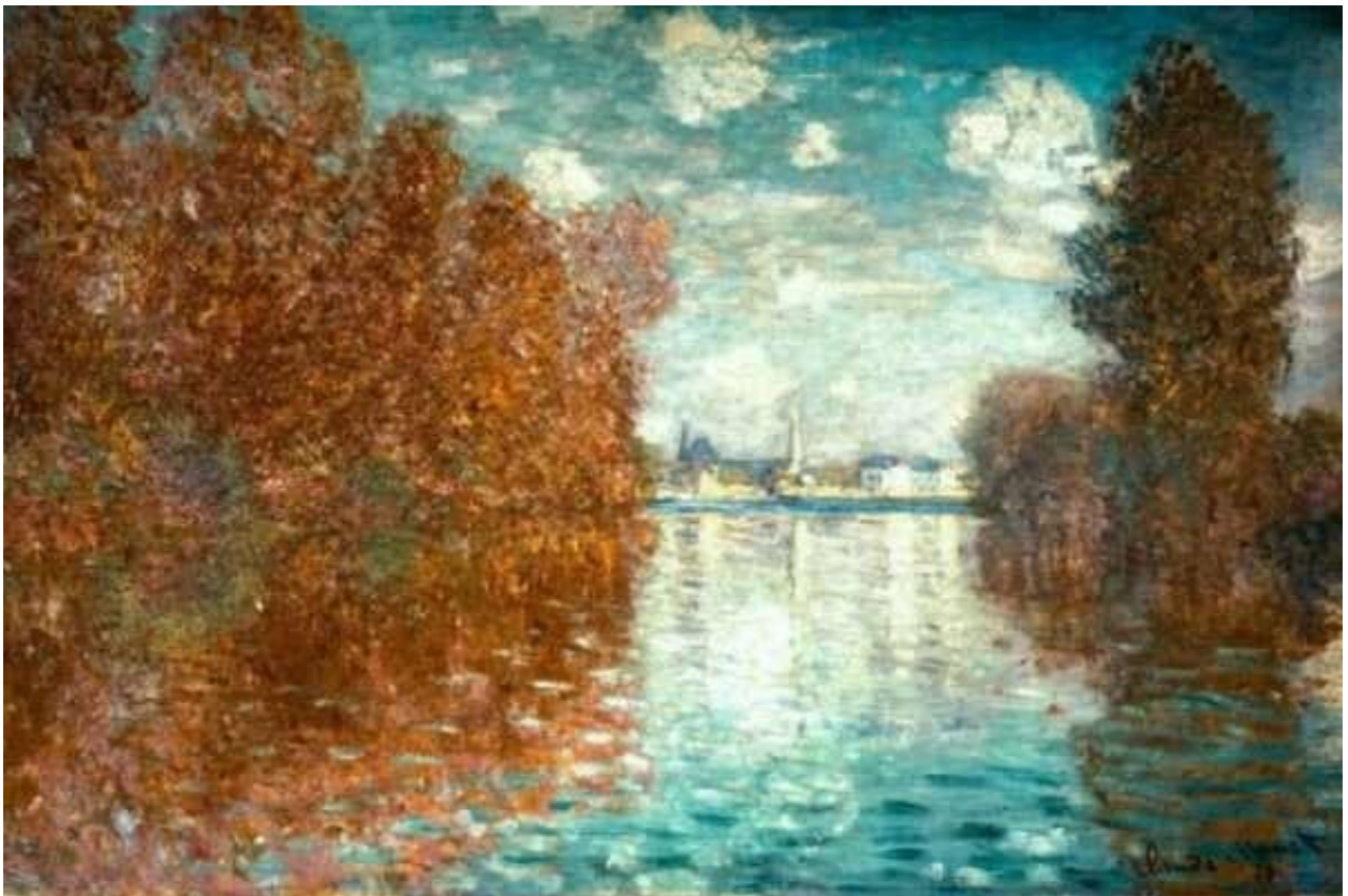
Εικόνα 4 Φθινοπωρινό στο Argenteuil , Claude Monet

Λαμβάνοντας υπόψη όλα τα παραπάνω, το φυσικό τοπίο ανέκαθεν δελέαζε τους ανθρώπους, τους προσέλκυε και τους καλλιεργούσε ποικίλα συναισθήματα, τους γοήτευε και αποτελούσε πηγή έμπειυσης, η οποία αποτυπωνόνταν στα καλλιτεχνικά και αισθητικά καβαλέτα. Πολύ πριν εφευρεθεί η φωτογραφική λήψη, διάφοροι πίνακες ζωγραφικής κοσμούσαν βασιλικά- κοσμικά σαλόνια οι οποίοι αποθανάτιζαν τοπία αρχικά από την ύπαιθρο (με την παρουσία ή μη μορφών) και έπειτα πίνακες οι οποία περιείχαν ανάκτορα ή εκκλησίες.