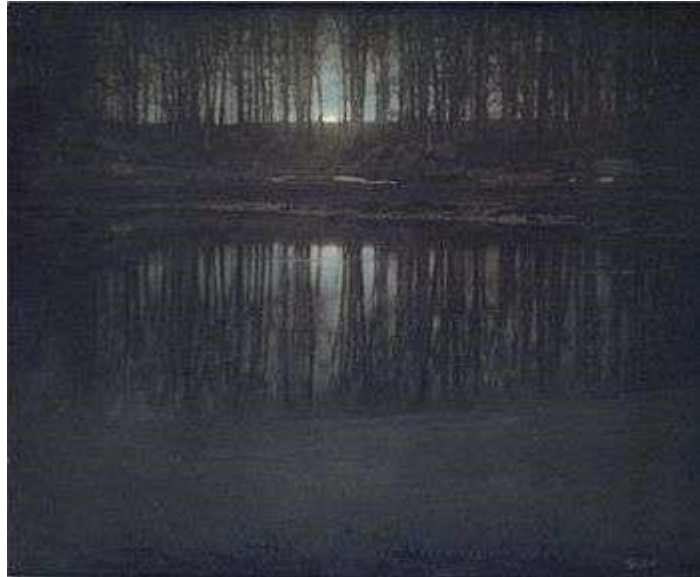
Εικόνα 6 Moonlight: The Pond του Edward Steichen

Σημαντική καινοτομία για την φωτογραφία του τοπίου και ίσως ο ακρογωνιαίος λίθος για την εδραίωσή της, αποτέλεσε και η φωτογραφία “Moonlight: The Pond” του Edward Steichen, όπου αποτυπώνει ένα ατμοσφαιρικό περιβάλλον με αντανακλάσεις δέντρων σε ένα σκοτεινό κάδρο.