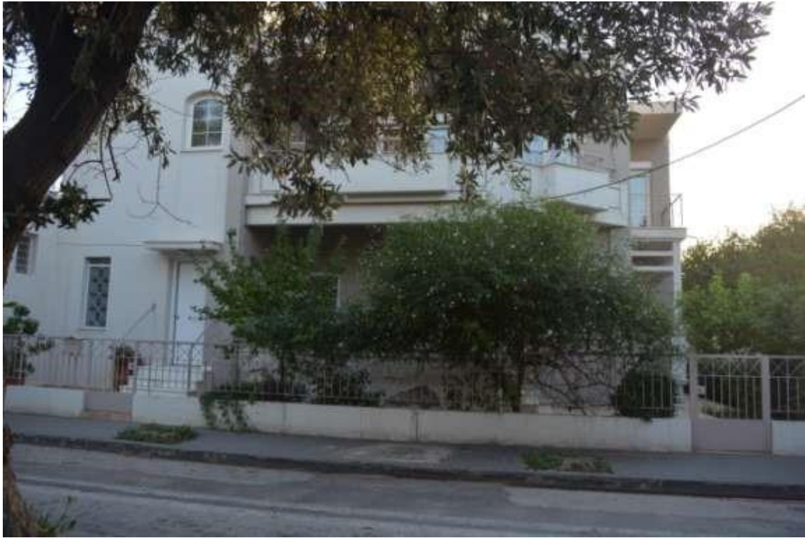
Εικόνα 25: Ελευσίνα