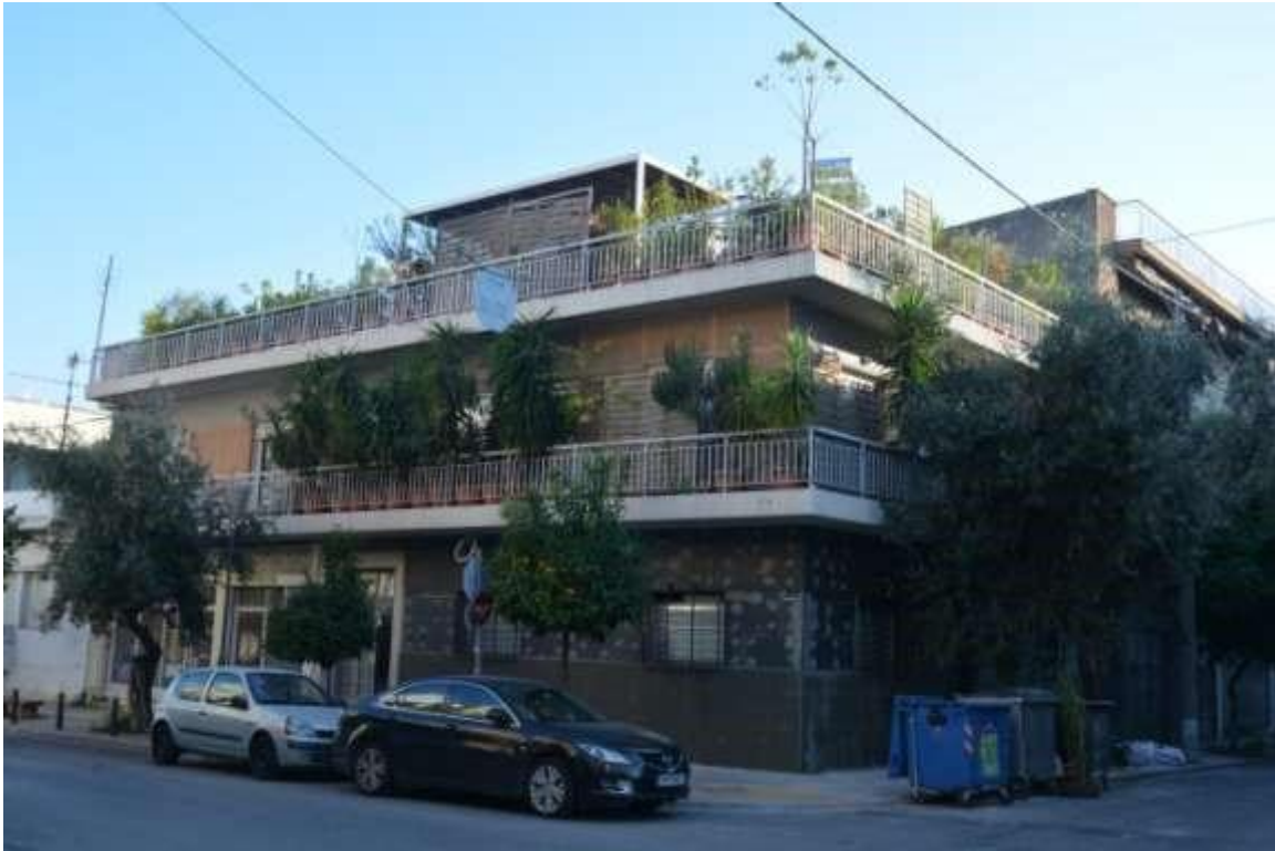
Εικόνα 26: Ελευσίνα