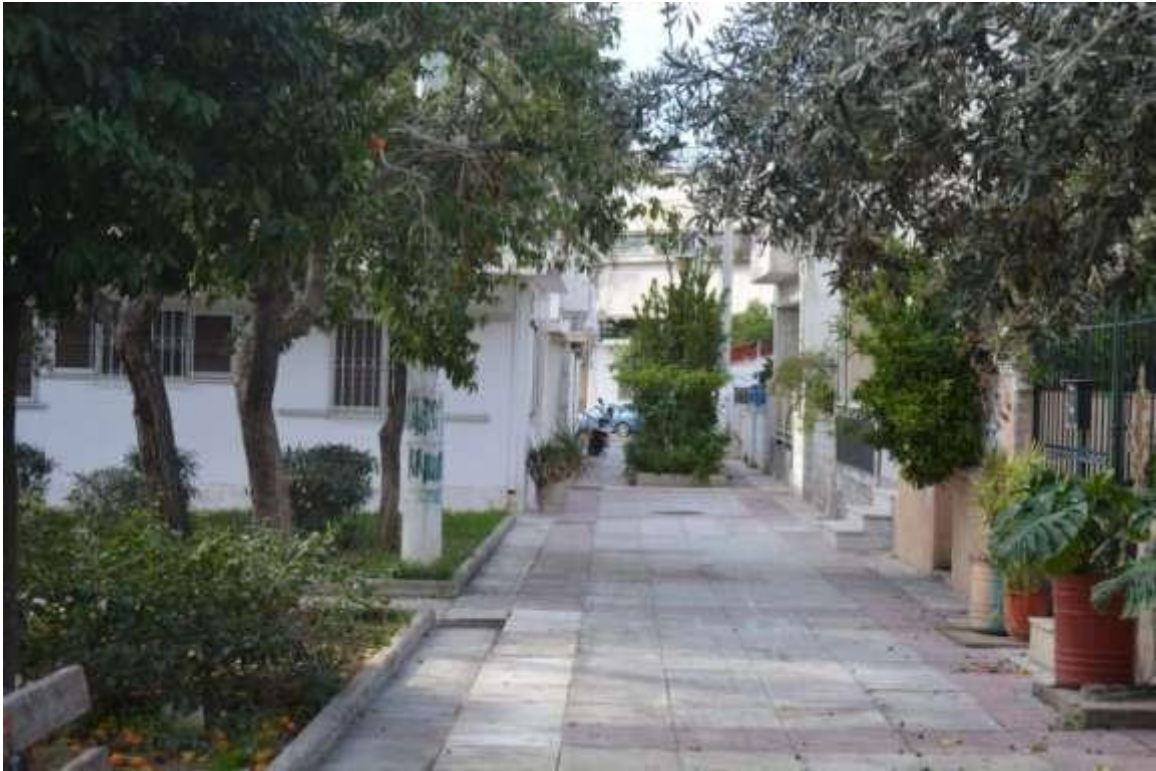
Εικόνα 13: Ελευσίνα