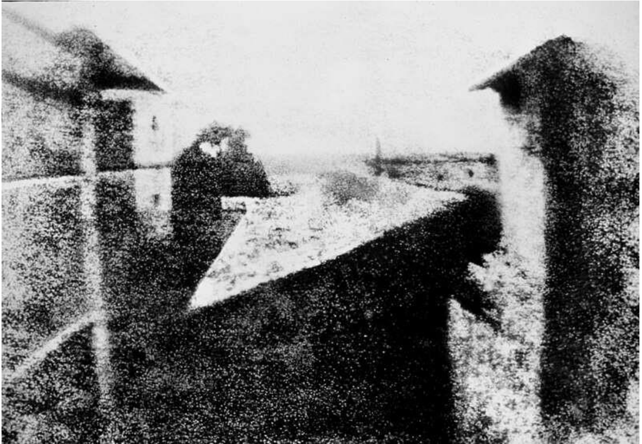
Εικόνα 5 Θέα από το παράθυρο, Nicéphore Niépce ( Britannica )

Καταβάλλοντας προσπάθεια στην έρευνα της Φωτογραφίας, θα μπορούσε να υποθεί ότι είναι αρκετά δύσκολο να εντοπίσουμε την αρχική προέλευση της πρώτης φωτογραφίας τοπίου. Παρόλα αυτά, εντοπίστηκε ότι η πρώτη φωτογραφία που τραβήχτηκε ποτέ και ήταν ένα αστικό τοπίο, το 1826 (ή 1827) από τον Nicéphore Niépce.