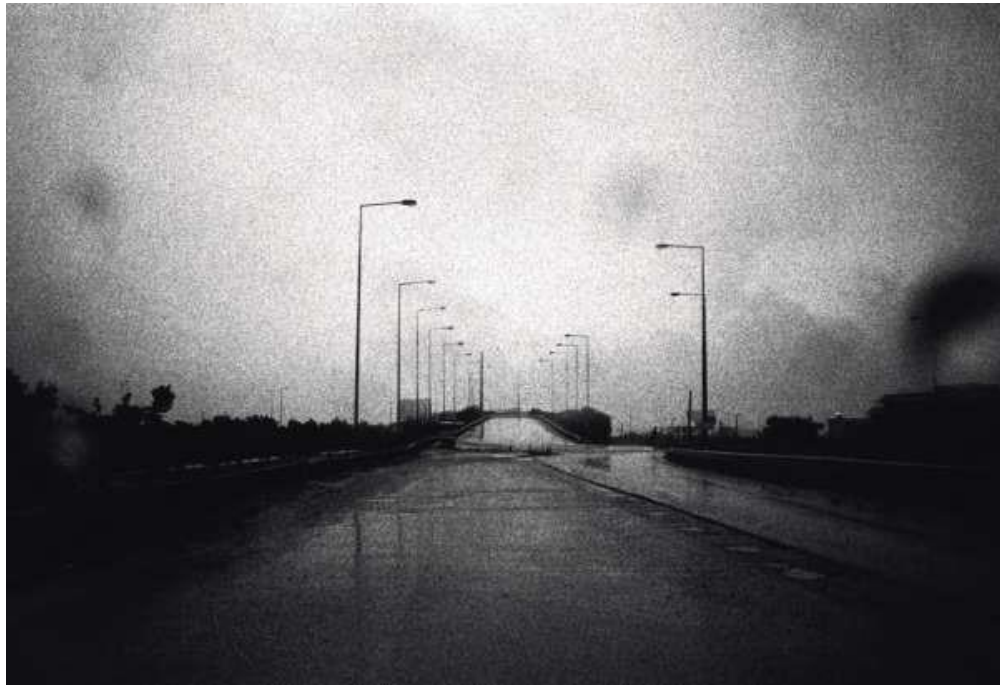
Εικόνα 7 Ατμοσφαιρικότητα – Μάρκου Θ. (Μάρκου, 2014)

Αυτή λοιπόν την παραπάνω σχέση προσπαθεί να αποτυπώσει και η φωτογραφία στο συγκεκριμένο πεδίο δράσης αφού η πηγή έμπνευσης και δημιουργίας πηγάζει από τον κυρίαρχο αστικό «μητρικό» περιβάλλοντα χώρο με διάσπαρτα στοιχεία της φύσης.