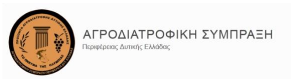
Εικόνα 12 Σήμα ΑΣ Δυτικής Ελλάδας

Η Αγροδιατροφική Σύμπραξη Δυτικής Ελλάδας ιδρύθηκε το 2017 και διοικείται από εννεαμελές (9) Διοικητικό Συμβούλιο με την βοήθεια δεκαπενταμελούς (15) Επιστημονικού Συμβουλίου.