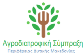
Εικόνα 11 Σήμα ΑΣ Δυτικής Μακεδονίας