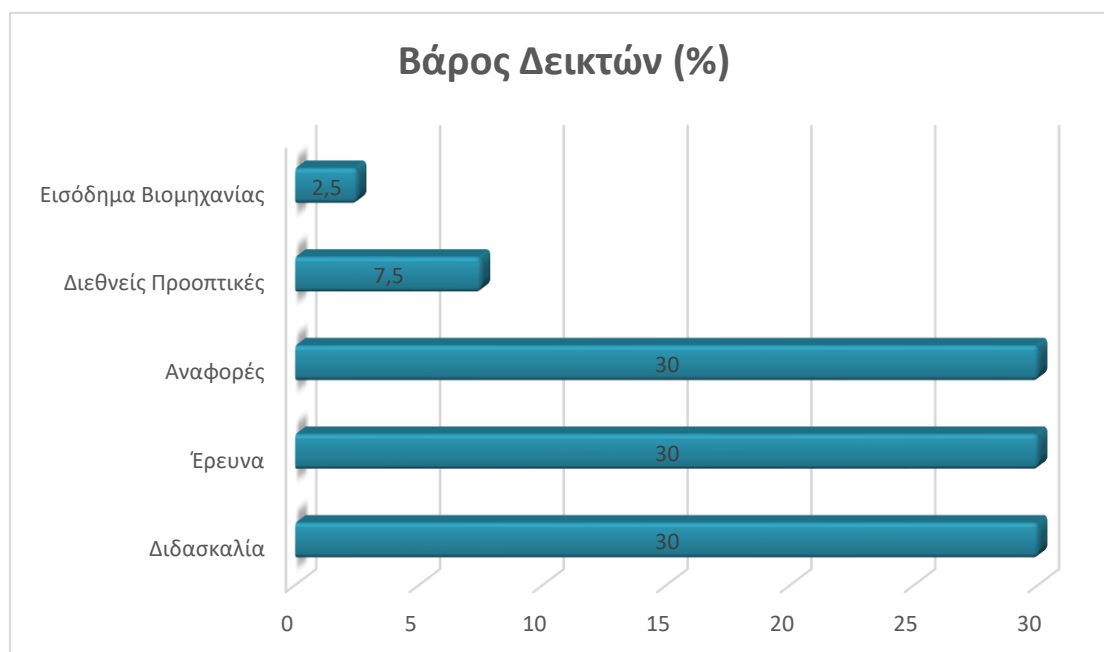
Πίνακας 2 δείκτες απόδοσης και βάρη του Times Higher Education

Μια άλλη ανησυχία προκύπτει από την πιθανή μεροληψία στη στάθμιση των μετρήσεων προς τα πανεπιστήμια με περισσότερους πόρους και χρηματοδότηση. Για παράδειγμα, ο δείκτης Έρευνας έχει συντελεστή στάθμισης 30% και λαμβάνει υπόψη παράγοντες όπως η οικονομική υποστήριξη για την έρευνα, ο αριθμός των δημοσιεύσεων και η τοποθεσία της έρευνας. Αυτό θα μπορούσε να προσφέρει ένα ανταγωνιστικό πλεονέκτημα στα σχολεία με περισσότερους πόρους για να διαθέσουν στην έρευνα, ίσως εις βάρος ιδρυμάτων με χαμηλότερους πόρους, αλλά ακόμα ικανά να παράγουν έρευνα υψηλού επιπέδου. Επιπλέον, πολιτιστικές και γεωγραφικές προκαταλήψεις ενδέχεται επίσης να επηρεάσουν τη στάθμιση των δεικτών. Για παράδειγμα, ο δείκτης International Outlook έχει στάθμιση 7,5% και λαμβάνει υπόψη πτυχές όπως το ποσοστό ξένου προσωπικού και φοιτητών, η διεθνής ερευνητική συνεργασία και η παγκόσμια φήμη των εκπαιδευτικών ιδρυμάτων. Αυτό μπορεί να προσφέρει ανταγωνιστικό πλεονέκτημα σε ιδρύματα που έχουν περισσότερες παγκόσμιες διασυνδέσεις, ίσως εις βάρος ιδρυμάτων που έχουν στενότερη περιφερειακή έμφαση. Προκύπτουν ανησυχίες σχετικά με πιθανές προκαταλήψεις και αθέμιτα πλεονεκτήματα που μπορεί να αποδοθούν σε ορισμένα είδη πανεπιστημίων λόγω της στάθμισης των μετρήσεων στην κατάταξη των Times Higher Education World University Rankings.