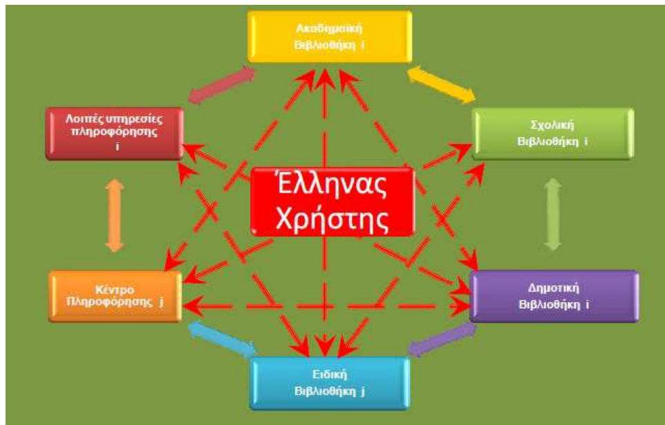
Διάγραμμα 2.2: Συνεργασία των βιβλιοθηκών σε τοπικό, περιφερειακό και εθνικό επίπεδο Πηγή: Τσάφου και συν. (2012)