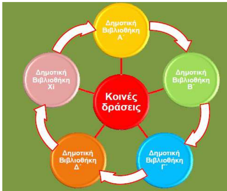
Διάγραμμα 2.1: Μοντέλο συνεργασιών μεταξύ των δημοτικών βιβλιοθηκών, Πηγή: Τσάφου και συν. (2012)

Από την άλλη πλευρά, η συνεργασία των βιβλιοθηκών σε εθνικό επίπεδο αφορά τη συνεργασία μεταξύ δημοτικών, σχολικών, ακαδημαϊκών και ειδικών βιβλιοθηκών με κέντρα πληροφόρησης τα οποία διασυνδέονται μεταξύ τους με τον τρόπο που απεικονίζεται στο διάγραμμα 2.2. Η παρούσα εργασία εστιάζει στις συνεργασίες μεταξύ των δημοτικών βιβλιοθηκών κατά τα πρότυπα του διαγράμματος 2.1.