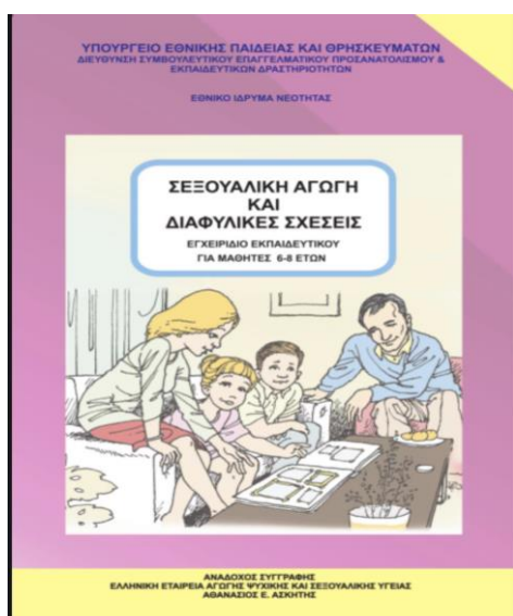
Εικόνα 1: Εγχειρίδιο Εκπαιδευτικού για μαθητές 6-8 ετών

Ήδη πριν από δώδεκα χρόνια 8 το Υπουργείο Παιδείας είχε παραδεχτεί την αναγκαιότητα σεξουαλικής διαπαιδαγώγησης και ανακοίνωσε την εισαγωγή προγραμμάτων Σεξουαλικής Αγωγής τη σχολική χρονιά 2009-2010. Το πρόγραμμα Σεξουαλικής Αγωγής – Διαφυλικών Σχέσεων, σύμφωνα με το Υπουργείο Παιδείας, θα βασιζονταν σε δύο εγχειρίδια (το ένα για ηλικίες 6-8 ετών και το άλλο για ηλικίες 9-12 ετών), τα οποία επιμελήθηκε ο ψυχίατρος Δρ Θάνος Ασκητής 9 με επιλεγμένη ομάδα ειδικών συνεργατών του. Τα σχολικά αυτά εγχειρίδια σύμφωνα με τις οδηγίες της συγγραφικής ομάδας είχαν στόχο την σεξουαλική υγεία των παιδιών και μπορούσαν να αξιοποιηθούν σε διδακτικές ώρες του μαθήματος της Ευέλικτης Ζώνης, παρέμειναν όμως στα γραφεία των υπευθύνων αγωγής υγείας 10 . (Γερούκη, 2011).