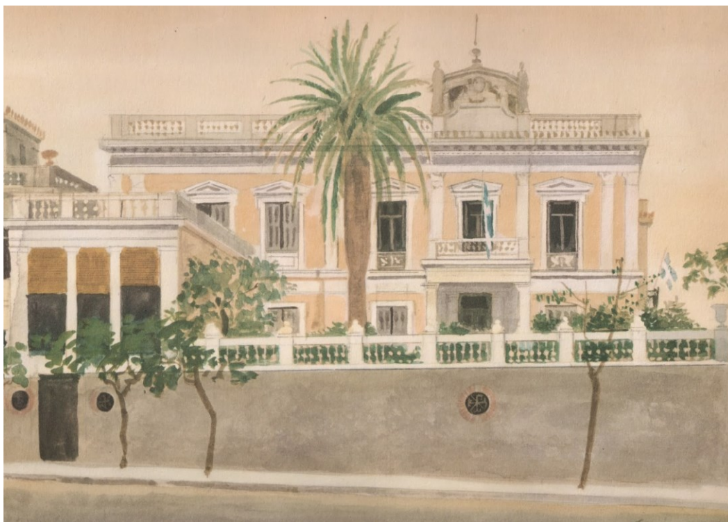
Γιάννης Τσαρούχης, Κατοικία Στρίγκου, 1964. Ακουαρέλα, Ιδιωτική Συλλογή.

Μια τυπική νεοκλασική κατοικία αποτελείτο από ένα υπερυψωμένο υπόγειο, το ισόγειο, ενώ κατά κύριο λόγο υπήρχε ένας ακόμη όροφος και κεραμοσκεπή. Το τρίπτυχο αυτό, υπερυψωμένο υπόγειο – ισόγειο – όροφος, παρατηρείται και στην εξεταζόμενη νεοκλασική κατοικία Στρίγκου.