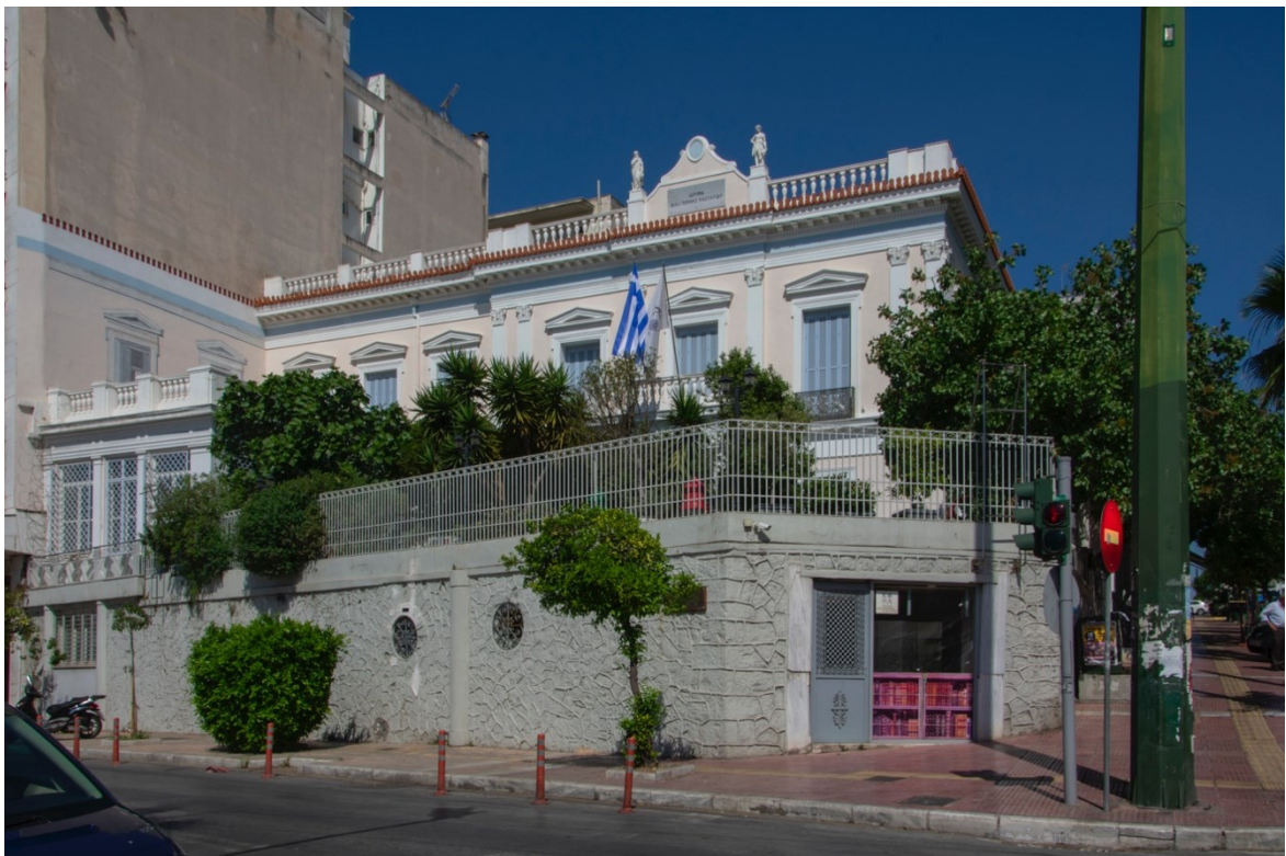
Πρόσψη του Ιδρύματος Αικατερίνης Λασκαρίδη από την Ακτή Μουτσοπούλου.

Αποχαιρετώντας κάποιος επισκέπτης το πρώην Μέγαρο Στρίγκου μπορεί να παρατηρήσει το υπόγειο τμήμα της πρώην κατοικίας ,που την περίοδο του Γαλλικού Ινστιτούτου βρισκόταν σε λειτουργία το διάσημο καφέ-ζαχαροπλαστέιο «Η Μυροβόλος», μια ανάμνηση που θα συνοδεύει για πάντα τους παλαιούς πειραιώτες. 53