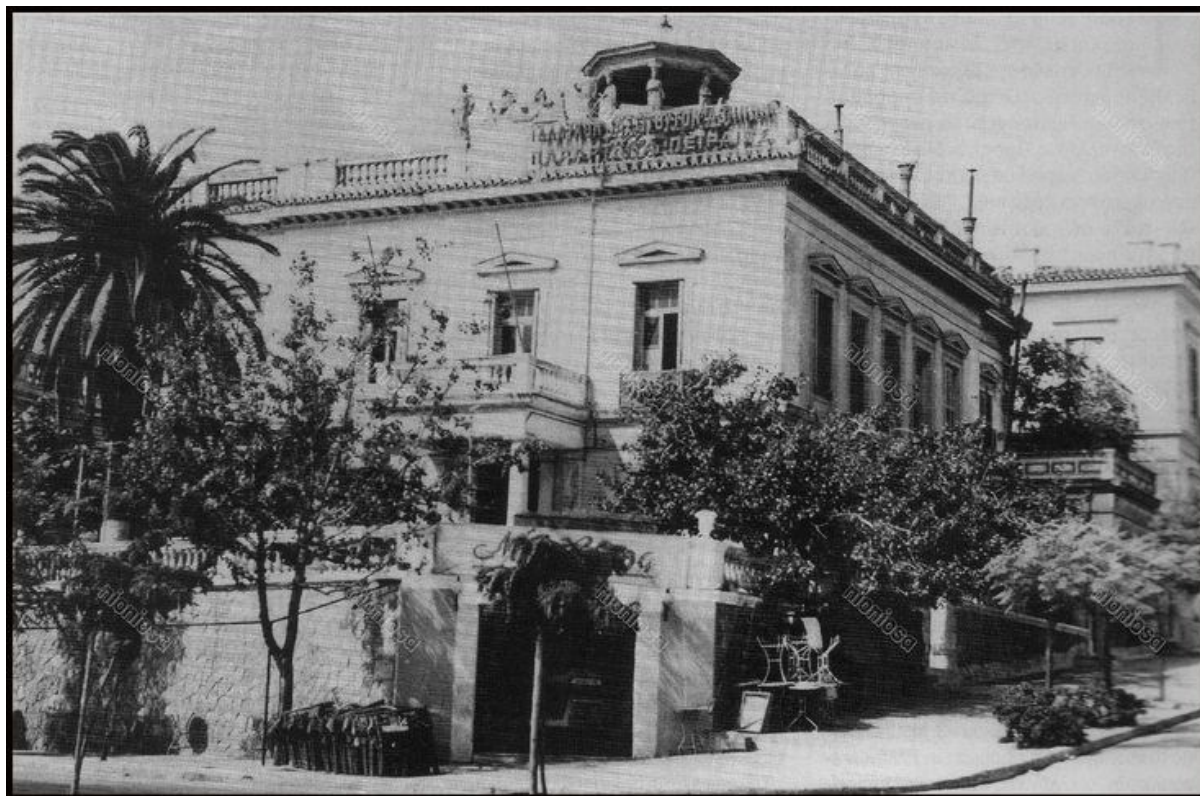
Η πρώην Οικία Στρίγκου

πραγματοποιήθηκε η ανακαίνιση του κτιρίου της Γαλλικής Ακαδημίας, γεγονός που αποτέλεσε αφορμή για να φιλοξενηθεί μια έκθεση 34 έργων του Γιάννη Τσαρούχη στο χώρο της, καθώς επίσης να τυπωθεί ο κατάλογος Le Pirée de Yannis Tsarouchis. Exprodition organisée par l'Institut Français d'Athènes, Annexe du Pirée. la Fontation Yannis Tsarouchis. la Galerie Skoufa. 22 Octobre -5 Novembre 1993 , τόσο στα ελληνικά όσο και στα γαλλικά. 35