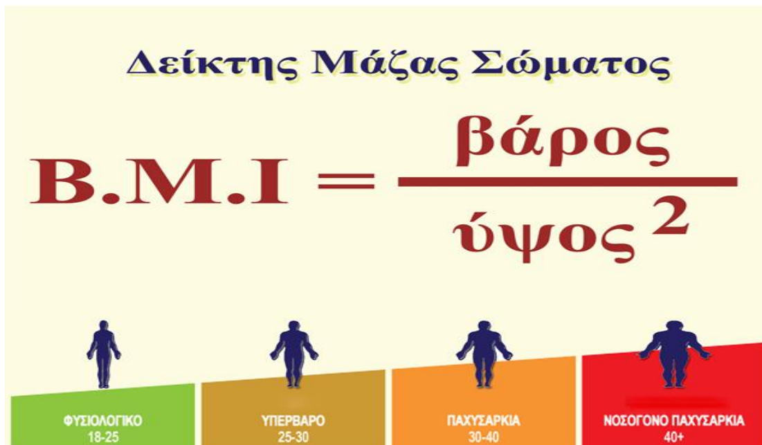
Εικόνα 2: Παγκοσμίως αποδεκτή κατηγοριοποίηση του Δ.Μ.Σ

https://eumorfia.gr/%CE%B4%CE%B5%CE%B9%CE%BA%CF%84%CE%B7%CF%83-%CE%BC%CE%B1%CE%B6%CE%B1%CF%83%CF%83%CF%89%CE%BC%CE%B1%CF%84%CE%BF%CF%83/