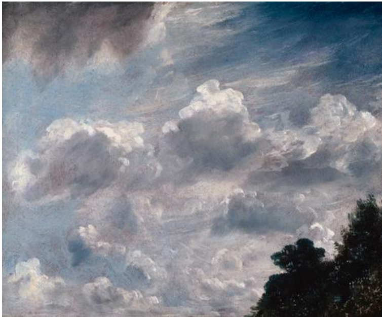
Εικόνα 1. John Constable, cloud study, Tree at right, 1821, Royal Academy of Arts, London

Ο Constable υπήρξε Άγγλος τοπιογράφος ο οποίος αναδείχθηκε κατά τον 19ο αιώνα και αποτέλεσε έναν από τους πιο σημαντικούς εκπροσώπους του Ρομαντισμού. Ασχολήθηκε κυρίως με την φύση, την εξοχή και γενικά με το φυσικό τοπίο που πρωταγωνιστεί στα έργα του. Οι πίνακες του λειτουργούν ως μια μετεωρολογική έρευνα αλλά και ως μια παρατήρηση της φύσης.