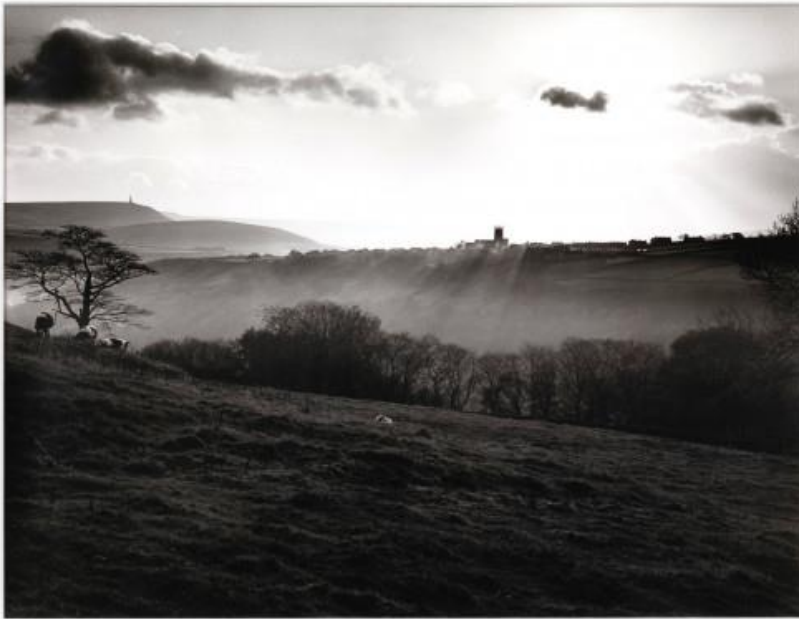
Εικόνα 8. Fay Godwin, Hepstonstall, Calder Valley, 1972

την αίσθηση ενός γραφικού τοπίου και το χρώμα απουσιάζει σε αυτές τις φωτογραφίες και επίσης αποτυπώνει την ανθρώπινη παρέμβαση στο τοπίο που πραγματεύεται.