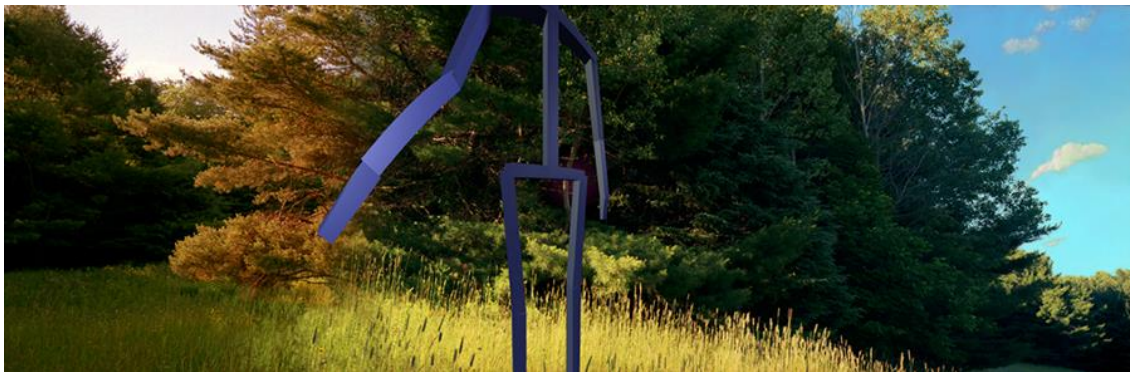
Εικόνα 15. The Blue Shepherd, Arcadian Landscape , 1998

Παίρνοντας ως σημείο αναφοράς το έργο του Poussin δημιουργούν διάφορες αναπαραστάσεις πάνω σε πάνελ. Ακόμη, δημιουργούν εγκαταστάσεις σε τοπία γύρω από το θέμα της Αρκαδίας. Οι εικόνες δείχνουν τους βοσκούς να έχουν περικυκλώσει τον τάφο όπου υπονοείται ότι ο θάνατος συμβαίνει και στην Αρκαδία 24 .