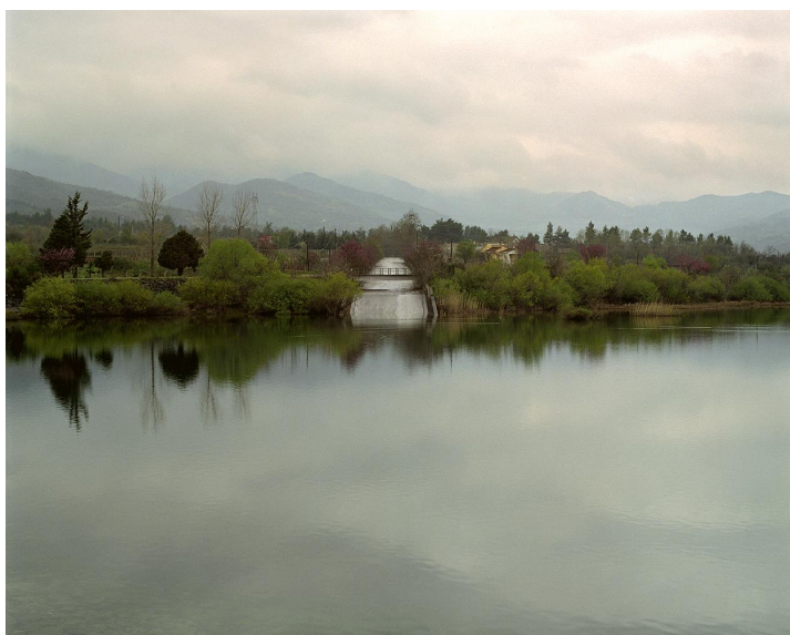
Εικόνα 13. Πάρις Πετρίδης, Θεσσαλία,, Ελλάδα , 2005

Επίσης, τα τοπία δίνουν σε μεγάλο βαθμό την αίσθηση της εξορίας. Τα ζώα στις φωτογραφίες, ο τρόπος που κοιτούν και στέκονται δίνουν ακόμη πιο πολύ την εντύπωση της αποστασιοποίησης και λειτουργούν συμβολικά.