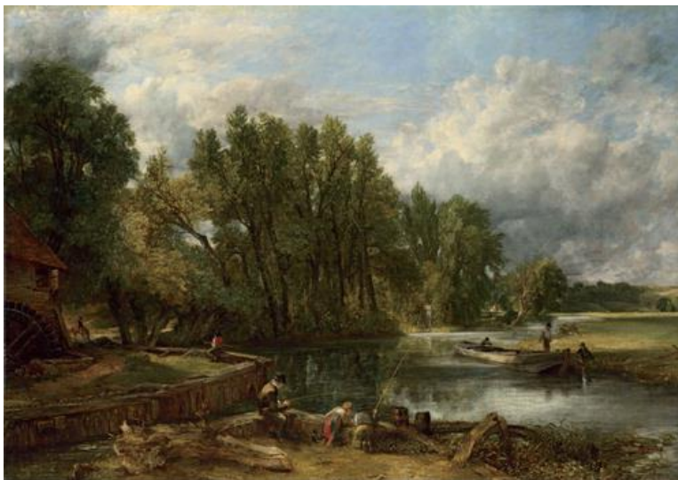
Εικόνα 2. John Constable, Stratford Mill, 1820, National Gallery , London

Ο Constable μελετούσε την κατεύθυνση και την ένταση του φωτός που συχνά ενσωμάτωνε στα έργα του. Το Φθινόπωρο ήταν η εποχή που τον ενδιέφερε περισσότερο . Το φως του ουρανού εκείνη την εποχή περιείχε ποικίλους τόνους χρωμάτων. Ως προς τα χρώματα μπορούμε να πούμε ότι είναι ποικιλόμορφα και αποδίδονται ανάλογα με την εποχή και είναι συχνά, αρκετά έντονα και φωτεινά. Με τους πίνακές του αποσκοπούσε ακόμη να απεικονίσει όλο το φάσμα των χρωμάτων με ισορροπημένο τρόπο.