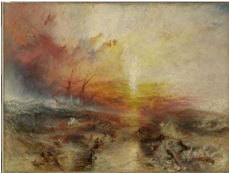
Εικόνα 4. James Mallord William Turner, Slave Ship , 1840 , Museum of Fine Arts , Boston

Οι εικόνες που δημιούργησε ο Turner ανοίγουν ένα πλαίσιο συζητήσεων και ευαισθητοποιούν τα ανθρώπινα δικαιώματα. Κατά συνέπεια, εδώ η ανθρώπινη ιστορία και το φυσικό τοπίο γίνονται ένα.