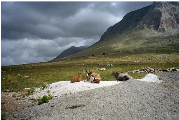
Εικόνα 12. Πάρις Πετρίδης, Πελοπόννησος, Ελλάδα , 2000