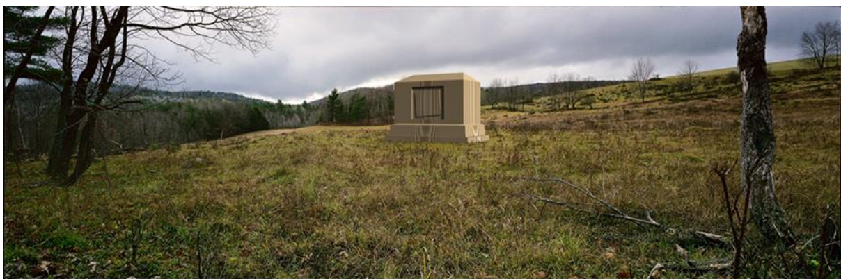
Εικόνα 17. The Pastoral Tradition, Arcadian Landscape , 1998