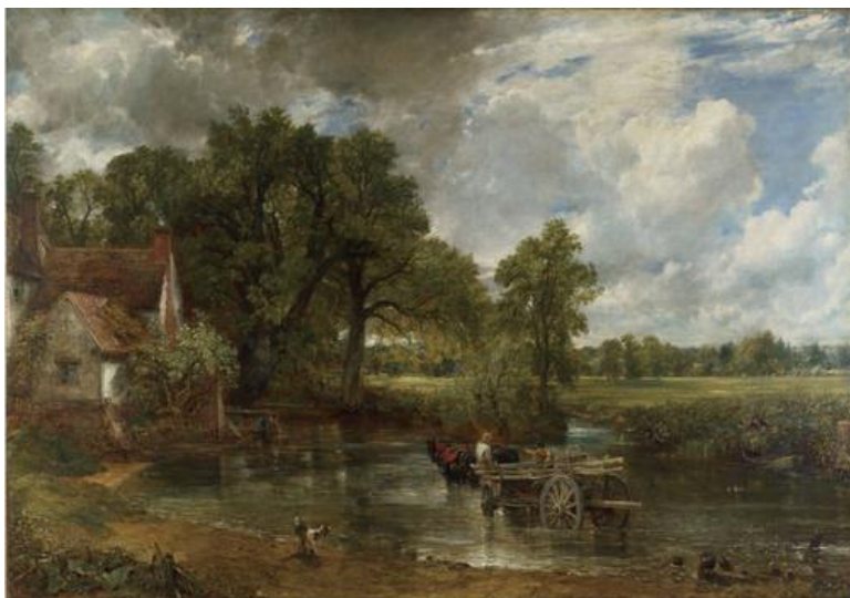
Εικόνα 3. John Constable, The Hay Wain , 1821, National Gallery, London

Πρόκειται για ένα στιγμιότυπο της αγγλικής εξοχής, το οποίο αποπνέει ηρεμία και αντιτίθεται στο πνεύμα της Βιομηχανικής Επανάστασης. Οι ανθρώπινες φιγούρες στα τοπία αυτά ωραιοποιούνται και είναι τοποθετημένες προσεκτικά. Ως αποτέλεσμα, αυτό δημιουργεί μια άρτια σύνθεση η οποία λειτουργεί αρμονικά, ο θεατής αντικρύζοντάς την, νιώθει πως βλέπει μια γνώριμη σκηνή. Τίποτα απροσδόκητο ή αφύσικο δεν συμβαίνει στη σύνθεση, όλα λειτουργούν αρμονικά και ισορροπημένα.