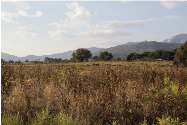
Εικόνα 7. Κατσιάνου Θάλεια, Τοπία, 2022

Η ανάδειξη αυτών των τοπίων επιτυγχάνεται μέσα από τη φωτογραφική αναπαράσταση μικρών λόφων και πεδιάδων που μοιάζουν αχρονικά.