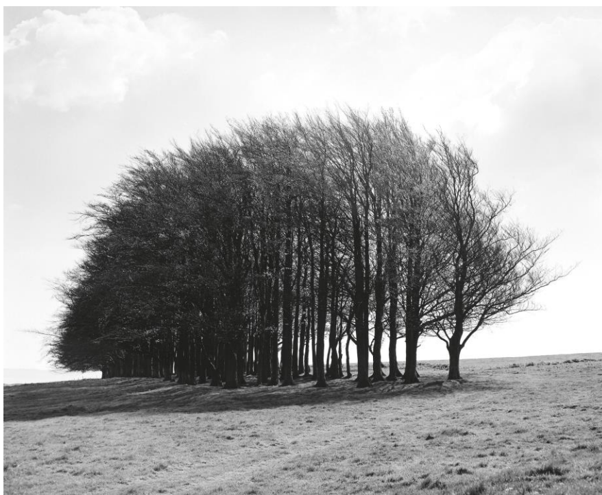
Εικόνα 10. Fay Godwin, Barbary Castle clump, spring , 1974

Οι φωτογραφίες του Πάρι Πετρίδη αφορούν τοπία της ελληνικής επαρχίας όπου κεντρικό θέμα είναι ο δρόμος και συνδέονται με το ίδιο το ταξίδι. Ο Πετρίδης μέσα από τις περιπλανήσεις του στην ενότητα Notes at the Edge of the Road (2006), αναδεικνύει τα τοπία που συχνά αγνοούμε μιας αποστασιοποιημένης Ελλάδας, τα οποία συνδέονται με τη γεωγραφία. Όσον αφορά, το τίτλο διαδραματίζει μείζων ρόλο στο έργο αυτό, διότι δίνει την αίσθηση ότι τα τοπία αυτά που απεικονίζονται έχουν τύχει να είναι εκεί και έρχονται σε αντίθεση με το τρόπο που εκπροσωπούνται τα συγκεκριμένα μέρη 21 .