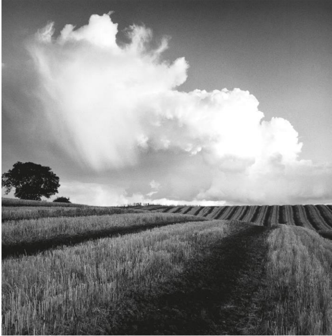
Εικόνα 9. Fay Godwin, Large white cloud near Bilsington , 1981

Το παραπάνω τοπίο, φανερώνει την πρόθεση της Godwin να αποτυπώσει ένα τοπίο απόλυτα ισορροπημένο και ήρεμο. Ως προς τη σύνθεση, παρατηρείται ότι υφίσταται ισορροπία και αυτό αποδίδεται στο γεγονός ότι όλα είναι σε πλήρη αρμονία μεταξύ τους, δηλαδή το δέντρο βρίσκεται στην άκρη, ο αγρός είναι στο κέντρο και τα σύννεφα βρίσκονται στο πίσω μέρος δημιουργώντας βάθος στη φωτογραφία. Ως αποτέλεσμα, το τοπίο αυτό προσεγγίζει αρκετά μια δομή ενός γραφικού τοπίου με έντονες επιρροές από το κίνημα του Ρομαντισμού. Με λίγα λόγια, λειτουργεί ως μια εικόνα ευχαρίστησης για το μάτι του θεατή.