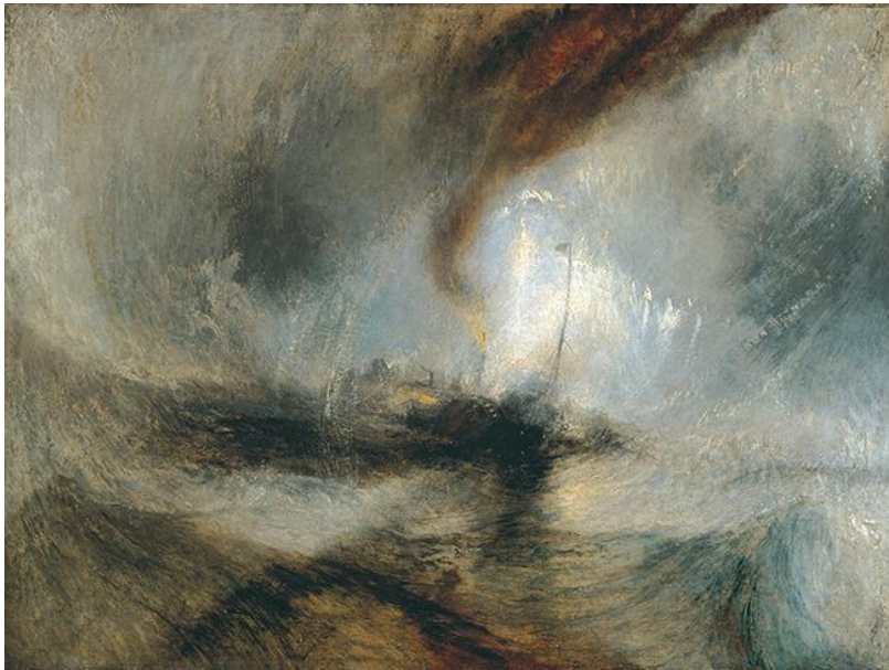
Εικόνα 5. James Mallett William Turner, Snow Storm , 1842, Tate Britain, London

χρησιμοποιεί, βοηθούν να αποκτήσει το τοπίο χαρακτηριστικά του υψηλού.