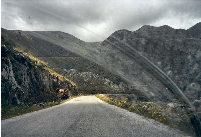
Εικόνα 11. Πάρις Πετρίδης, Πελοπόννησος, Ελλάδα , 2000

Το Notes at the Edge of the Road ξεκινάει με πρωταγωνιστή το δρόμο όπου το ταξίδι του συνεχίζεται από το Kath' Odon . Τα τοπία είναι ερημικά και απομακρυσμένα, απουσιάζουν οι άνθρωποι, όπου τα μόνα έμφυχα όντα είναι τα ζώα, χωρίς να υπόκεινται σε συγκεκριμένο χρόνο.