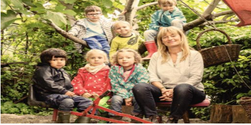
Εικόνα 10. Rudolf Steiner Schule Zürich