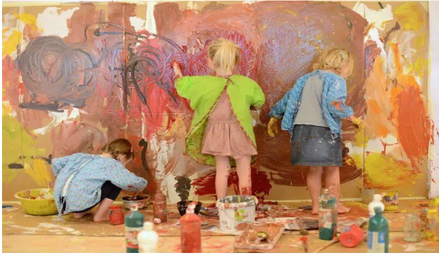
Εικόνα 8. Swiss school inspired by Reggio Emilia

Συνοψίζοντας, η μέθοδος Reggio Emilia και η μέθοδος Waldorf αντιμετωπίζουν τα παιδιά ως ενεργούς και δημιουργικούς συμμετέχοντες στη διαδικασία της μάθησης (Steiner, 1995), (Gandini, Lynn Hill , Louise Cadwell, & Charles Schwall, 2005).