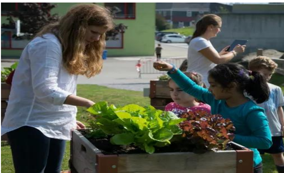
Εικόνα 5. Δημιουργία Ζωντανών Οικοσυστημάτων ως αίθουσες διδασκαλίας

Επιπλέον, οι παιδικοί σταθμοί στην Ελβετία συχνά συνεργάζονται με ειδικούς διατροφής για να εξασφαλίσουν ότι η διατροφή των παιδιών πληροί τις απαιτήσεις τους για βιταμίνες, μέταλλα και άλλα θρεπτικά συστατικά. Ακόμα, παρέχουν μαθήματα μαγειρικής για τα παιδιά, προωθώντας έτσι την υγιεινή διατροφή και τη συνείδηση για τη διατροφή. Στοχεύουν στην προώθηση της υγιεινής διατροφής και της κατανάλωσης τοπικών και οργανικών τροφίμων, που συχνά συμπεριλαμβάνουν προϊόντα όπως το σοκολατένιο γάλα και άλλες παραδοσιακές ελβετικές λιχουδιές.