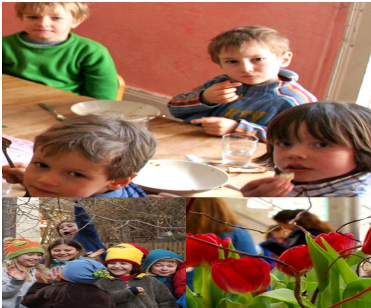
Εικόνα 9. Rudolf Steiner Schule Zürich