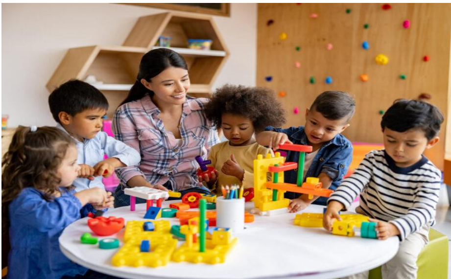
Εικόνα 2. Παιχνίδι στον παιδικό σταθμό

Στη γενικότερη έννοια, οι παιδικοί σταθμοί έχουν ως στόχο τη φροντίδα, την ανάπτυξη και την εκπαίδευση των παιδιών κατά τη διάρκεια της προσχολικής ηλικίας τους, παρέχοντας ένα ασφαλές και υγιεινό περιβάλλον για την ανάπτυξη των δεξιοτήτων και των κοινωνικών σχέσεων των παιδιών (Wikipedia, 2023), (Άρθρο 12: Παιδικοί και βρεφονηπιακοί σταθμοί).