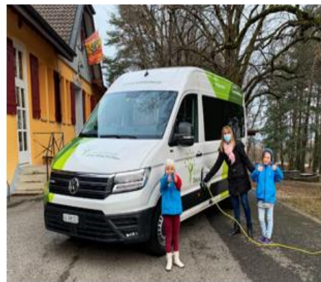
Εικόνα 6. Μοντεσσοριανό σχολείο στην Ελβετία

Από την άλλη πλευρά, η θεωρία του Piaget εστιάζει στην ανάπτυξη της κατανόησης του κόσμου από το παιδί, μέσω της διαδικασίας της γνωστικής ανάπτυξης. Ο Piaget πίστευε ότι η γνώση δεν απορρέει απλά από την εμπειρία, αλλά είναι αποτέλεσμα της δραστηριότητας του ατόμου που αντιλαμβάνεται τον κόσμο. Συγκεκριμένα, η θεωρία του Piaget περιλαμβάνει την ανακάλυψη και την ανάπτυξη των δομών της σκέψης, που