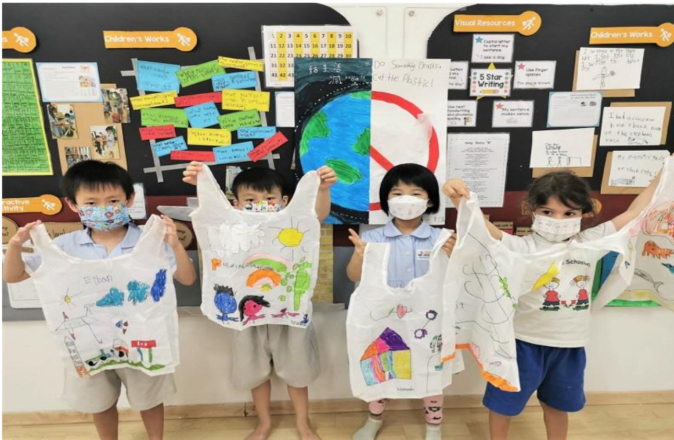
Εικόνα 4. Αειφορία στον παιδικό σταθμό