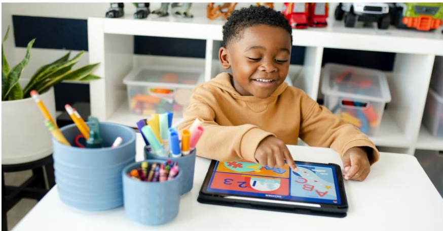
Εικόνα 3. Η Τεχνολογία στον παιδικό σταθμό

ηλεκτρονικούς υπολογιστές για να βοηθήσουν τα παιδιά να εξοικειωθούν με την τεχνολογία και να μάθουν νέες δεξιότητες, αυτά τα προγράμματα μπορούν να προσαρμοστούν στις ανάγκες και τα ενδιαφέροντα των παιδιών και να παρέχουν εκπαιδευτικό υλικό σε μια πιο διασκεδαστική μορφή. Επιπλέον, η τεχνολογία χρησιμοποιείται και για την επικοινωνία μεταξύ των γονέων και των εκπαιδευτικών, με εφαρμογές που δίνουν στους γονείς πρόσβαση σε πληροφορίες σχετικά με την καθημερινή δραστηριότητα του παιδιού τους (Λαμπριανίδου, 2018), (Καζαντζή, Δογκάκης, & Χατζηγιαννάκης, 2018).