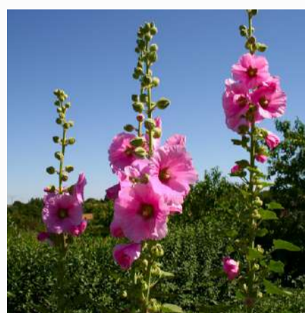
Althaea 2,00 €