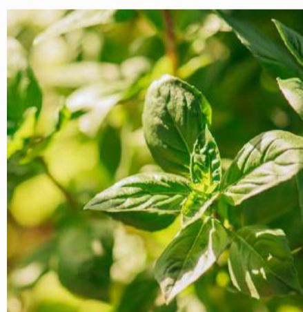
Basil 2,00 €