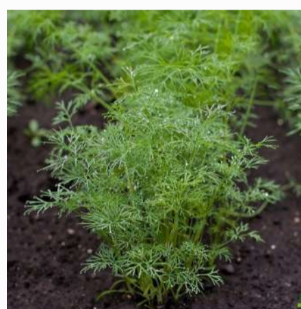
Dill 2,00 €