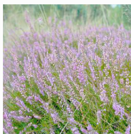
Lavender 2,00 €