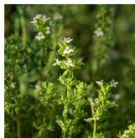
Thymus 2,00 €