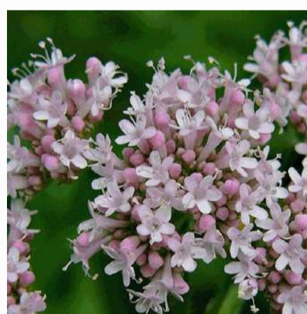
Valerian 2,00 €