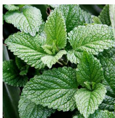
Mint 2,00 €