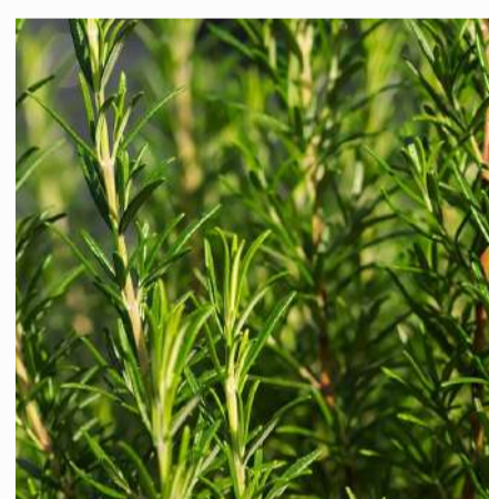
Rosemary 2,00 €