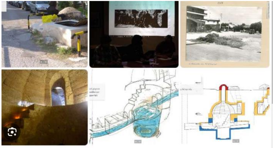
Εικόνα 4 4

Το Αδριάνειο υδραγωγείο πρόκειται για ένα σύστημα υδροδότησης που χτίστηκε κατά την περίοδο του Ρωμαϊκού Αυτοκρατορικού Κράτους, κατά τον 2ο αιώνα μ.Χ., από τον αυτοκράτορα Αδριανό. Ο σκοπός αυτού του υδραγωγείου ήταν να παρέχει νερό στην αρχαία Αθήνα, καλύπτοντας τις ανάγκες της πόλης σε πόσιμο νερό. Η ολοκληρωμένη χωρική επένδυση του Αδριανείου υδραγωγείου περιλαμβάνει την αποκατάσταση, τη συντήρηση και την προστασία του ιστορικού αυτού μνημείου. Πρόκειται για μια πολυδιάστατη προσπάθεια που απαιτεί την συνεργασία των αρχαιολόγων, των μηχανικών, των αρχιτεκτόνων και άλλων ειδικευμένων επαγγελματιών (Sargentis, Defteraios, Lagaros & Mamassis, 2022).