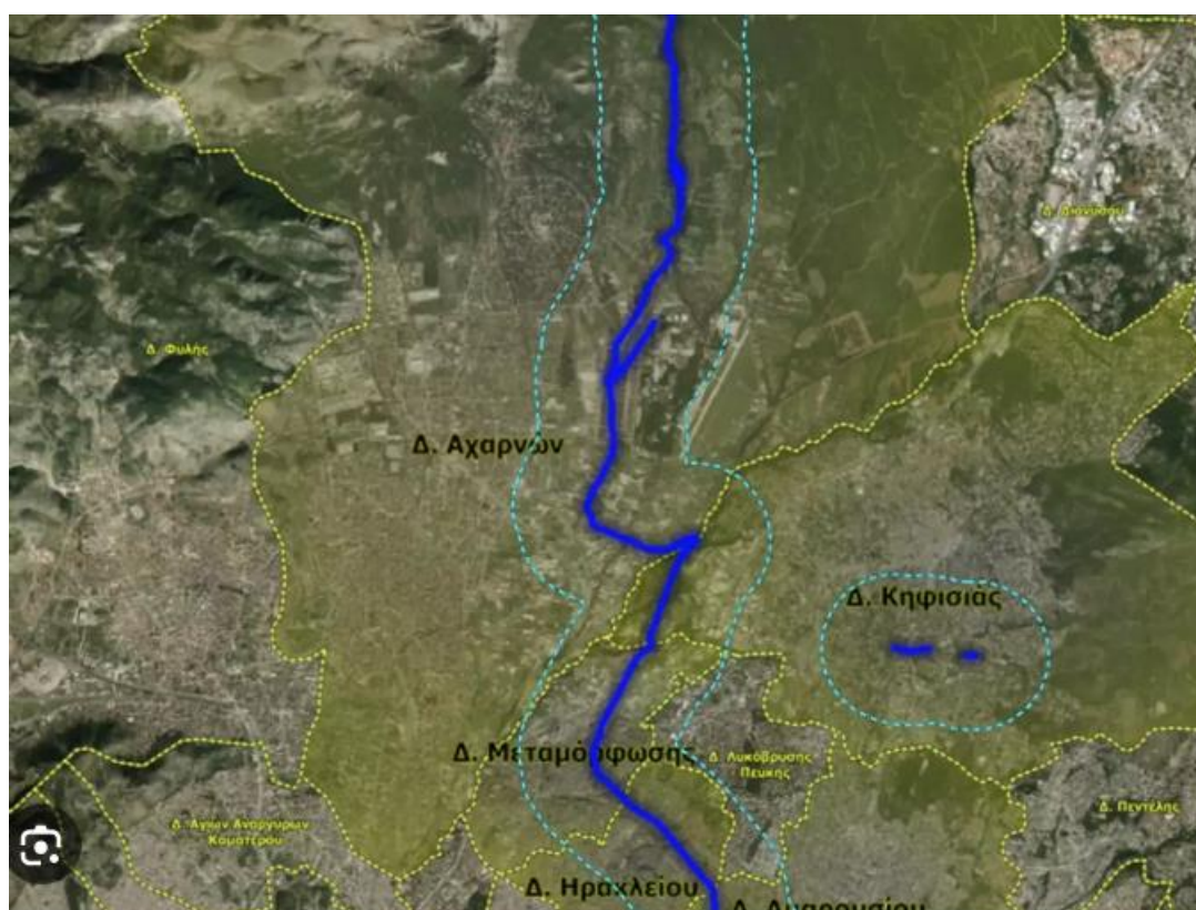
Εικόνα 1 2

Το Αδριάνειο Υδραγωγείο είναι το μεγαλύτερο αειφόρο και ταυτόχρονα λειτουργικό έργο στην Ευρώπη. Έχει μήκος 20 χιλιομέτρων από την Πάρνηθα έως την Δεξαμενή διατρέχει συνολικά 8 Δήμους της Αττικής. Οι Δήμοι που διαπερνά είναι οι Αχαρνές, η Κηφισιά, η Μεταμόρφωση, το Ηράκλειο, το Μαρούσι, το Χαλάνδρι, το Νέο Ψυχικό και οι Αμπελόκηποι. Το Υδραγωγείο αυτό χτίστηκε στην αρχαιότητα και παραμένει μια εντυπωσιακή μαρτυρία της πολιτιστικής κληρονομιάς και της τεχνολογικής επιδεξιότητας της εποχής. Το Αδριάνειο υδραγωγείο θα αποτελέσει μια ολοκληρωμένη χωρική επένδυση με μεγάλη σημασία για την προστασία των υδάτινων πόρων και τη βελτίωση της ζωής για τους κατοίκους της περιοχής (Νέα Μητροπολιτική Αττική, 2022).