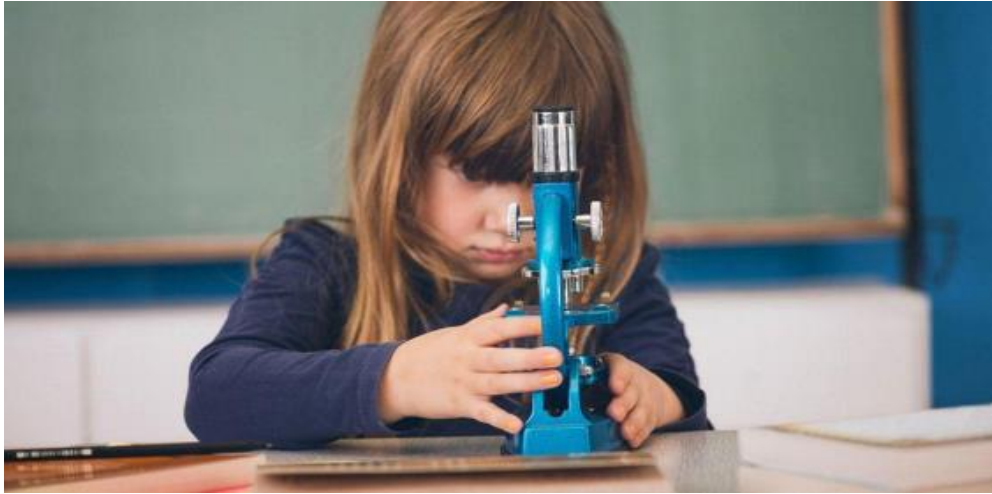
Εικόνα 1. Ανάπτυξη των ικανοτήτων.