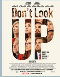
Don't Look Up (2021)

Μια δραματοποίηση της καταστροφής τον Απρίλιο του 2010, όταν το υπεράκτιο γεωτρήσιμο Deepwater Horizon εξερράγη, με αποτέλεσμα τη χειρότερη πετρελαιοκηλίδα στην αμερικανική ιστορία.