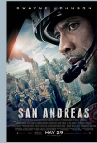
San Andreas (2015)

Δύο αστρονόμοι χαμηλού επιπέδου πρέπει να κάνουν μια γιγαντιαία περιβόια στα μέσα ενημέρωσης για να προσκοπισθούν την ανθρωπότητα για έναν κομήτη που «πλησιάζει και θα καταστρέψει τον πλανήτη Γη».