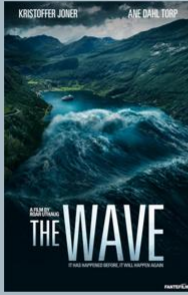
The Wave (2015)

Αν και αναμνημένο, κανείς δεν είναι πραγματικά έτοιμος όταν το ορατό παράσιτο πέσει από το νεφελικό, στην κορυφή του Gullfanger, καταρρέει και θραύεται στα βίαια ποταμιά θανάτου έξι μέτρων. Έτσι, γυαλίος ένα ένας από αυτούς που βράζουν στη μέση.