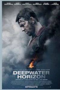
Deepwater Horizon (2016)

Αν και αναμνημένο, κανείς δεν είναι πραγματικά έτοιμος όταν το ορατό παράσιτο πέσει από το νεφελικό, στην κορυφή του Gullfanger, καταρρέει και θραύεται στα βίαια ποταμιά θανάτου έξι μέτρων. Έτσι, γυαλίος ένα ένας από αυτούς που βράζουν στη μέση.