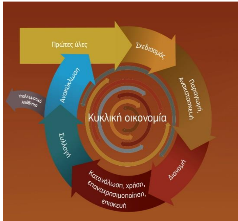
Σχήμα 3. Εθνική στρατηγική.

τεχνολογιών αιχμής για τη διαχείριση αποβλήτων στο πλαίσιο της Εθνικής Στρατηγικής Έρευνας και Καινοτομίας για την Έξυπνη Εξειδίκευση. (Ναυτεμπορική, 2019).