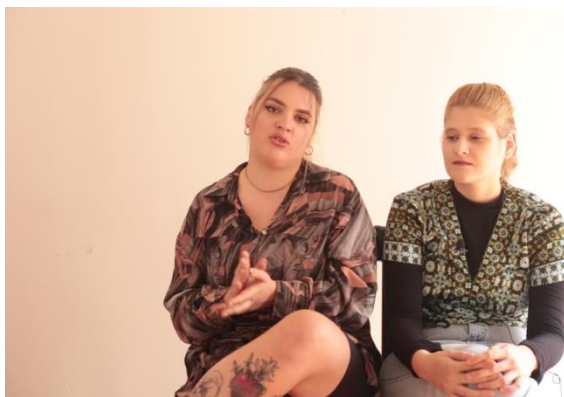
Εικόνα 4: Στιγμιότυπο από συνέντευξη 2 ατόμων