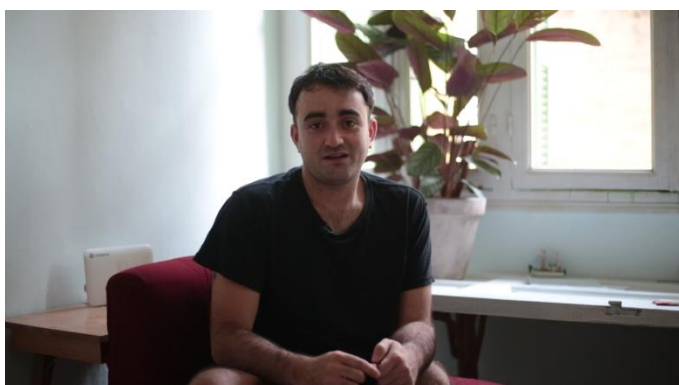
Εικόνα 5 : Στιγμιότυπο από συνέντευξη

Τα άτομα εμφανίζονται είτε μόνα τους μπροστά στην κάμερα είτε σε ζευγάρια. Στην δεύτερη περίπτωση, κατά τη διάρκεια της συνέντευξης, υπήρχε διάλογος γύρω από τις απαντήσεις τους. Αυτή η αίσθηση του διαλόγου, αποτέλεσε στοιχείο της οργάνωσης του υλικού και του τελικού μοντάζ.