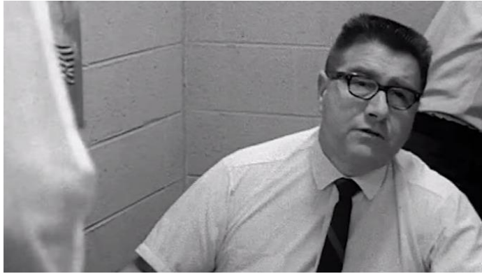
Εικόνα 2 : Στιγμιότυπο από την ταινία High School(1968) του Frederick Wiseman