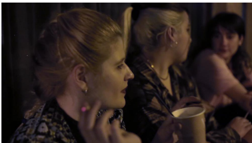
Εικόνα 6 :Στιγμιότυπο από τη 1 η σκηνή

Η κάμερα στρέφεται προς το άτομο που παρουσιάζει για εμένα το μεγαλύτερο ενδιαφέρον τη δεδομένη στιγμή. Άλλοτε κινείται με βάση το ποια είναι η πρωταγωνίστρια της δράσης (π.χ. ποια μιλάει), άλλοτε κινείται με βάση τις αντιδράσεις που προκύπτουν από τα όσα λέγονται. Και άλλοτε, απλά προσπαθεί να αποδώσει την ατμόσφαιρα της στιγμής, στην οποία βρίσκονται τα άτομα. Σε αντίθεση με τις σεκάνς των συνεντεύξεων, οι συγκεκριμένες σκηνές αποτελούνται σχεδόν αποκλειστικά από πολύ κοντινά πλάνα. Εμπεριέχονται δηλαδή στο έργο, με σκοπό να προσθέσουν ένταση στα όσα λέγονται και να προσφέρουν την εγγύτητα της εμπειρίας. Να δημιουργήσουν την αίσθηση ότι βρίσκεσαι και εσύ εκεί σαν μέλος της παρέας που συζητά. Ο τρόπος καταγραφής των σκηνών είναι επηρεασμένος από το cinema verité 17 . Τέλος, στην ταινία περιλαμβάνονται ορισμένες σκηνές δραματοποίησης και κάποια γραφιστικά στοιχεία illustration , (εικονογράφηση) που είτε λειτουργούν επεξηγηματικά, με στόχο να γίνουν κατανοητές οι ερωτήσεις στις οποίες απαντούν οι πρωταγωνίστριες, είτε ως αισθητικές επιλογές που επιδιώκουν να δώσουν έμφαση και μορφή στις ερωτήσεις και τις απαντήσεις των εικονιζόμενων.