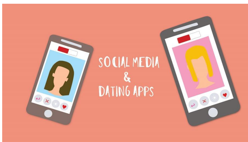
Εικόνα 9. Εικονογράφηση