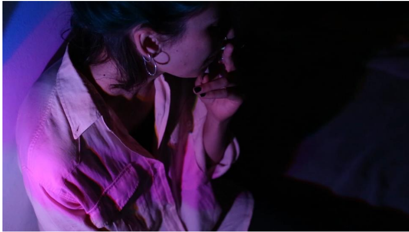
Εικόνα 7. Στιγμιότυπο από την ταινία