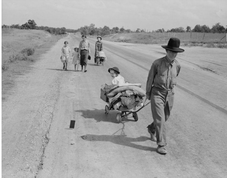
Εικόνα 1. Dorothea Lange June 1938 Family walking on highway-five children. Started from Idabe, Oklahoma,

παραγωγής στις Ηνωμένες πολιτείες. Εντούτοις, οι φωτογράφοι συχνά δεν παρέδιδαν το αναμενόμενο αποτέλεσμα 5 ).