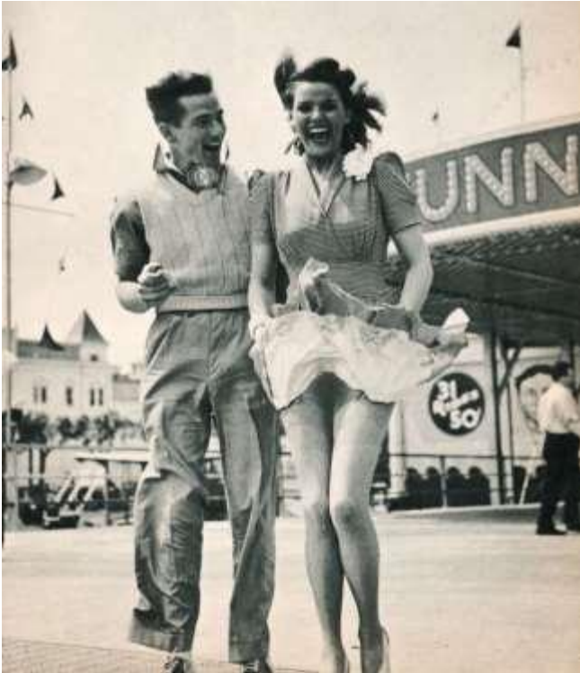
Άγνωστος Φωτογράφος, “Ζευγάρι στο λούνα πάρκ”, Δεκαετία του 1940.

Στις αρχές τις δεκαετίας του '40, λόγω του Β' Παγκοσμίου Πολέμου η μόδα δεν απασχολούσε τους ανθρώπους. Άνδρες και γυναίκες φορούσαν πρακτικά ρούχα και στολές ραμμένα ακριβώς για τον πόλεμο. Η μόδα αυτήν την δεκαετία δεν εξελίχθηκε πολύ, καθώς και μετά το τέλος του πολέμου, το 1945, οι άνθρωποι φορούσαν τα ρούχα που υπήρχαν κατά την διάρκεια του πολέμου, σε μία λίγο πιο εξελιγμένη μορφή. Οι άνδρες φόραγαν κουστούμια (μακρύ παντελόνι, πουκάμισο, γραβάτα και σακάκι) και οι γυναίκες φούστα μήκους κάτω από το γόνατο, και σακάκι που υπογράμμιζε το γυναικείο σώμα. Επίσης, υλικά όπως το τζιν και το κρεπ χρησιμοποιήθηκαν για την παραγωγή γυναικείων ρούχων μετά πολέμου, καθώς το απόθεμα υλικών όπως το μετάξι και το μαλλί είχαν περιοριστεί. 11