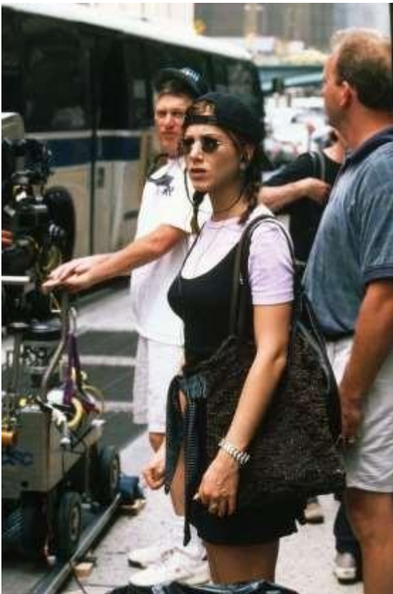
Τζένιφερ Άνιστον, Δεκαετία του '90