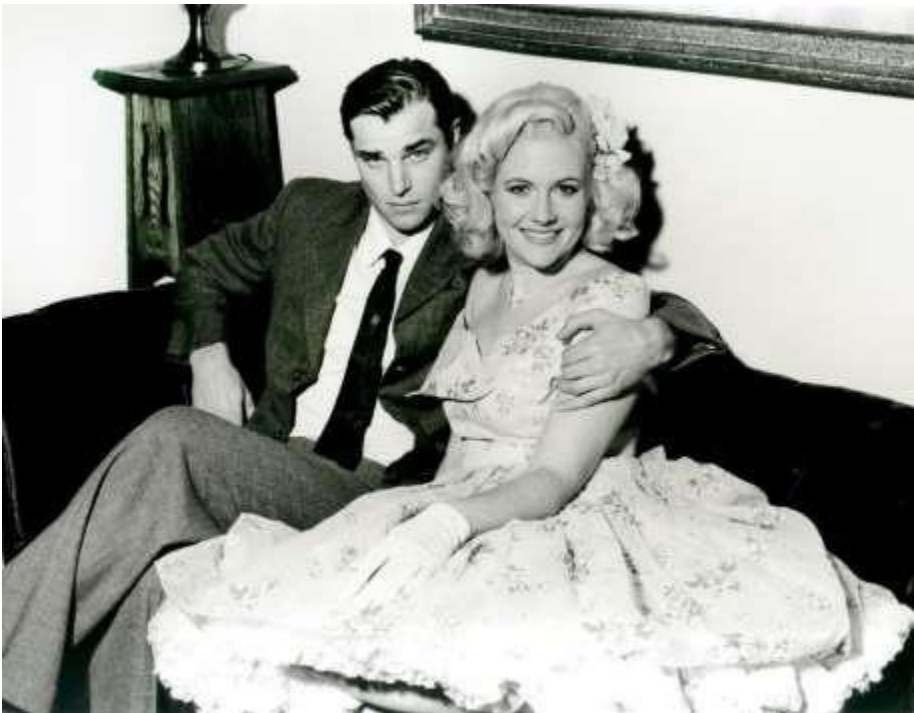
Άγνωστος Φωτογράφος, Μόδα του '50, γύρω στο 1950.

Τη δεκαετία του '50 η ανδρική μόδα πήρε στροφή προς την ανεπισημότητα και την προχειρότητα καθώς επηρεάστηκε από την μεσαία εργατική τάξη όπου τα πιο στενά παντελόνια, τα t-shirts και τα δερμάτινα πανωφόρια ήταν από τις συχνότερες επιλογές. Επιρροή στην ανδρική ενδυμασία είχαν οι ταινίες με τα επαναστατικά «κακά» αγόρια ( James Dean, Marlon Brando). Αντίθετα, οι γυναίκες ενστερνίστηκαν την επίσημη ενδυμασία και την θυληκότητά τους. Καθ'όλη την διάρκεια της ημέρας, οι γυναίκες ήταν χτενισμένες και βαμμένες και καλοντυμένες. Τα αξεσουάρ και ο σωστός συνδυασμός τους ξεκίνησαν να παίζουν σημαντικό ρόλο και εμφανίστηκαν και τα cocktail dresses (βραδυνά φορέματα). 12