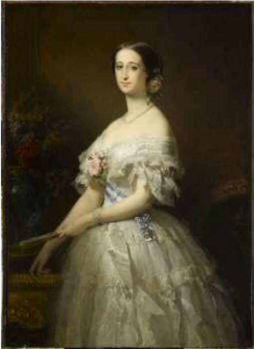
Edouard Dubufe « Eugenie de Montijo de Guzman, Empress of the French », 1854, Versailles: Chateau de Versailles.

το κίνημα της μαζικής παραγωγής έτοιμων ρούχων. 7 Μέχρι πριν τα ρούχα φτιαχόντουσαν πάνω στον πελάτη από μοδίστρες ή οι νοικοκυρές τα έφτιαχναν σπίτι. Έτσι όταν εμφανίστηκαν οι βιτρίνες πουλώντας έτοιμα ρούχα, αυτή η ανάγκη αφαιρέθηκε από τον οικιακό φόρτο εργασίας.