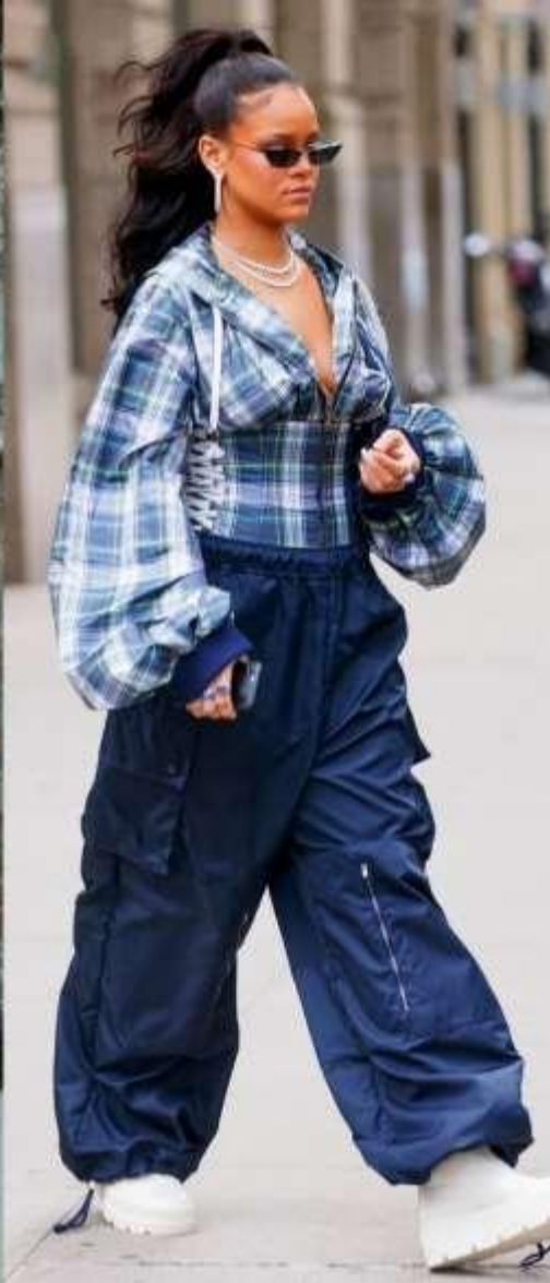
Getty Images, "Rihanna".

Τα κάργκο παντελόνια ανήκουν στην δεκαετία του '90 καθώς τα φαρδιά παντελόνια ήταν τότε της μόδας και έτσι γρήγορα υιοθετήθηκε και από τα δύο φύλα. Σήμερα, έχουν ξανα «μπει» και στην ανδρική και στην γυναικεία μόδα όπως φαίνεται και στην δεξιά φωτογραφία.