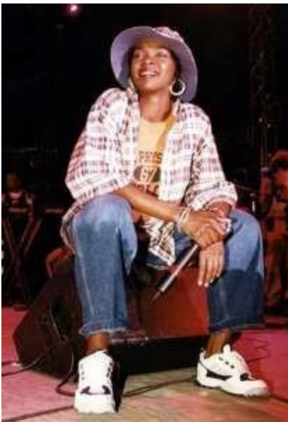
Lauryn Hill σε συναυλία στην Αϊτή το 1997

Με την άνοδο της διαφήμισης και των διασημοτήτων (celebrities), η μόδα αυτήν τη δεκαετία απέκτησε μία ελευθερία που δεν υπήρχε παλιότερα και άνοιξε την «πόρτα» σε μεγαλύτερο φάσμα πληθυσμού με αποτέλεσμα περισσότεροι άνθρωποι ξεκίνησαν να ασχολούνται και να παρακολουθούν τις εξελίξεις της μόδας, κάνοντας τη δεκαετία του '90 μία από τις πιο δημοφιλείς δεκαετίες.