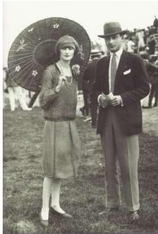
Γαλλία, Ιπποδρομία, 1926.