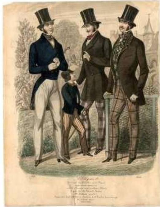
Άγνωστος Καλλιτέχνης « L'Elegant: Men's Fashion Plate », June 1852, Νέα Υόρκη: The Metropolitan Museum of Art.

Στις αρχές του 20 ου αιώνα, η μόδα παίρνει μεγάλη στροφή καθώς οι άντρες από παντελόνια με μάκρος μέχρι τα γόνατα, ξεκινούν να φορούν παντελόνια μέχρι τον αστράγαλο. Οι γυναίκες, από την άλλη μεριά, φοράνε πιο λεπτές και κοντές φούστες, τα φορέματα είναι επίσης πιο λεπτά, ενώ οι κορσέδες και υλικά όπως το μετάξι και το σιφόν χαρακτήριζαν τους πλούσιους της εποχής. Ακολούθησε, έπειτα, ο Α' Παγκόσμιος Πόλεμος που άλλαξε την καθημερινότητα των ανθρώπων και συνεπώς την μόδα. Ακολούθησε η εποχή που περιγράφεται και ως The Roaring 20s, όπου ήταν μια περίοδος στην ιστορία των δραματικών κοινωνικών και πολιτικών αλλαγών. Για πρώτη φορά, περισσότεροι Αμερικανοί