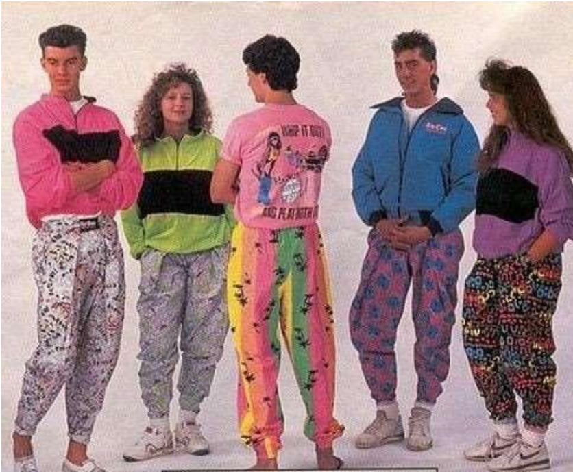
hammer pants, Δεκαετία του '80.

Η δεκαετία του '80, όπως προαναφέρθηκε, έδωσε βάση στην αθλητική ενδυμασία και πέρα από τα φαρδιά αθλητικά ρούχα, οι γυναίκες φορούσαν ακόμα κολάν σε συνδυασμό με κορμάκι. Λόγω της τοποθέτησης των γυναικών σε υψηλόβαθμες δουλειές, τα γυναικεία κουστούμια (το λεγόμενο power dress, για να παρθούν στα σοβαρά οι γυναίκες σε ένα πατριαρχικό περιβάλλον) ήταν επίσης μία τάση που υιοθέτησαν και μεγάλοι οίκοι μόδας. Τις γυναικείες τάσεις στην μόδα τότε ακολούθησε και η ανδρική μόδα, καθώς οι οίκοι μόδας άρχισαν να περιλαμβάνουν και τα ανδρικά ρούχα. Προς τα τέλη της δεκαετίας και με την επιρροή από την μουσική και τον πολιτισμό, τα σκισμένα τζιν, οι πόλο μπλούζες, τα καπέλα του μπίτζμπολ, τα «ξεπλυμένα» τζιν και οι μπότες Dr Martens. 15