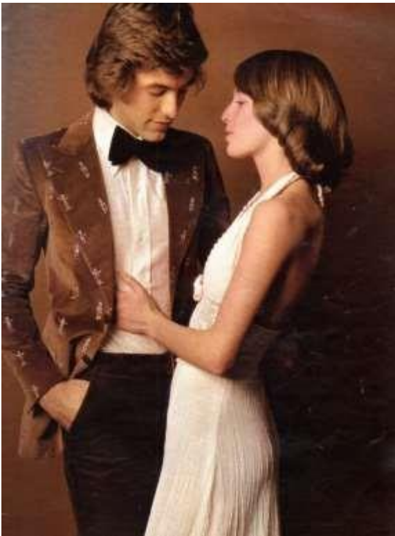
Άγνωστος Φωτογράφος, Jours de France (περιοδικό), Jours de France Fashion , 1974.

Η δεκαετία του '70 ήταν μία συνέχεια της μόδας του '60 καθώς τα χρώματα, τα έντονα σχέδια και το χίπι στυλ κυριάρχησαν. Υπήρξαν επιρροές από παλιότερες δεκαετίες ('30-'40) και τα πιο στενά ρούχα φορέθηκαν και από τα δύο φύλα. Στενά παντελόνια, κολλητές μπλούζες και ζιβάγκο, κουστούμια βλέπουμε πως τόσο άνδρες όσο και γυναίκες τα επιλέγουν στην καθημερινή ενδυμασία. Οι γυναίκες για επίσημες εκδηλώσεις, συνέχισαν τα πιο θυληκά και εφαρμοστά φορέματα, ενώ η εμφάνιση των κρουαζέ φορεμάτων πρόσφεραν άνεση στην καθημερινότητα. Προς τα τέλη της δεκαετίας, αυξήθηκε η δημοτικότητα αθλητικών ρούχων και παπουτσιών σε πιο φαρδιές γραμμές για άνδρες και γυναίκες, μία τάση που θα χαρακτηρίσει και την μόδα της επόμενης δεκαετίας. 14