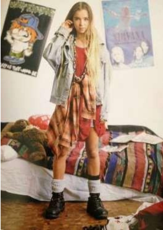
Δεκαετία του '90