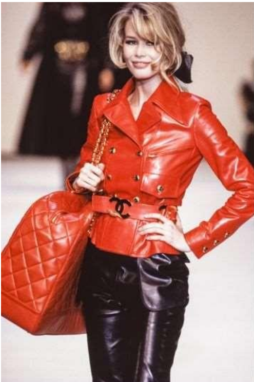
Victor Virgile, gettyimages. 2020.

Από την παραπάνω ανάλυση της ιστορίας της μόδας, έγινε φανερό πως διάφορες τάσεις της μόδας από διάφορες δεκαετίες κάνουν την εμφάνισή τους και σε μετέπειτα δεκαετίες, είτε ίδιες και απaráλλαχτες, είτε με μία μικρή τροποποίηση για την προσαρμογή με την νέα μόδα. Για παράδειγμα, όπως προαναφέρθηκε στο κεφάλαιο με την ιστορία της μόδας, την δεκαετία του '70 η μόδα είχε στοιχεία από τις δεκαετίες του '30 και του '40. Η δεκαετία του '90 είναι μία από τις περιόδους μόδας όπου διάφορα στοιχεία της, επανέρχονται τόσο από τους μεγάλους οίκους μόδας, όσο και από μικρές εταιρείες, ηθοποιούς, τραγουδιστές και διασημότητες γενικότερα. Ρούχα ή συνδυασμός ρούχων, χρώματα, σχέδια, αξεσουάρ, παπούτσια που αγαπήθηκαν το '90 κάνουν την επανεμφάνιση τους την δεκαετία του 2010 αλλά και, όπως φαίνεται, στην δεκαετία του 2020. Αυτό γίνεται φανερό από τα παρακάτω παραδείγματα όπου διασημότητες αποδίδουν φόρο τιμής στην μόδα αυτής της δεκαετίας και αποδεικνύουν την διαχρονική επιρροή της στην σημερινή μόδα.