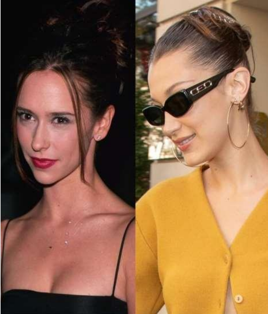
Getty Images, “Jennifer Love Hewitt”. Getty Images, “Bella Hadid”.

Τέλος, ένα ακόμη παράδειγμα της επιρροής του '90, είναι και τα διάφορα χτενίσματα και αξεσουάρ για τα μαλλιά που «επέστρεψαν» στην μόδα. Τα μεγάλα κοκαλάκια για τα μαλλιά (claw clips) βρίσκονται ακόμα στα αξεσουάρ όλων των γυναικών και συνδυάζονται και με κοσμήματα της ίδιας δεκαετίας (κρίκοι) όπως βλέπουμε στην δεξιά φωτογραφία ενός μοντέλου της εποχής μας.