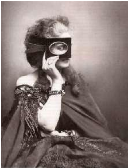
Pierre-Louis Pierson, "COUNTESS OF CASTIGLIONE", Virginia Oldoini Verasis, Contessa di Castiglione, γύρω στο 1860.

Μέχρι τα μέσα του 1800, ορισμένοι εμπορικοί φωτογράφοι έγιναν γνωστοί για πορτρέτα που εστίαζαν σε αριστοκρατικές και μοντέρνες γυναίκες, μια πρακτική που έδωσε μετέπειτα το πρότυπο για την ανάπτυξη της φωτογραφίας μόδας. Αν και οι πρώτες γνωστές φωτογραφίες της μόδας χρονολογούνται από τη δεκαετία του 1850, η Κόμισσα ντι Καστιλιόνε Βιρτζίνια Όλντονι, ερωμένη του αυτοκράτορα Ναπολέοντα Γ' και διασημότητα του δικαστηρίου, έγινε, στην πραγματικότητα, το πρώτο μοντέλο μόδας όταν, το 1856, άρχισε να συνεργάζεται με τον φωτογράφο Pierre Louis Pierson. Η συνεργασία τους (η Countess ή η La Castiglione, όπως ήταν πιο γνωστή, έπαιξε ενεργό ρόλο στο σχεδιασμό των φωτογραφιών, στην επιλογή θεατρικών σεναρίων και στο ντύσιμο για διάφορους ρόλους) διήρκεσε τέσσερις δεκαετίες και είχε ως αποτέλεσμα περίπου 800 εικόνες, συμπεριλαμβανομένων των φωτογραφιών της μοντελοποιεί το φτιαγμένο κατά παραγγελία φόρεμα "Queen of Hearts". Έτσι θεωρείται το πρώτο δείγμα φωτογραφίας μόδας.