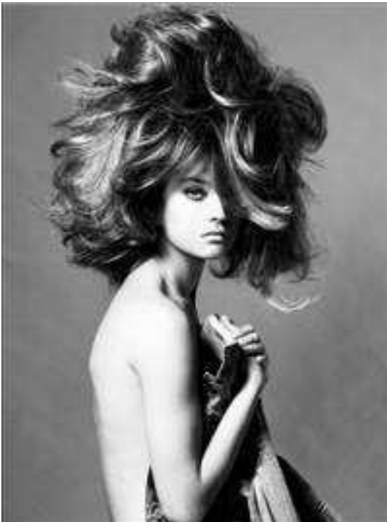
Steven Meisel, “Untitled”, Δεκαετία του '90.

Ο Steven Meisel (Αμερικανός φωτογράφος) είναι φωτογράφος μόδας και έγινε γνωστός από το photobook του με τίτλο “Sex” με μοντέλο την Μαντόνα το 1992 και από το φωτογραφικό του έργο για την Αμερικάνικη και Ιταλική Vogue. Οι φωτογραφίες του, όπως τις χαρακτηρίζει και ο ίδιος, είναι πιο ελεύθερες και δυναμικές. Η δημιουργικότητα και η συχνή αλλαγή στο στυλ του, τον κατέστησαν έναν από τους πιο περιζήτητους φωτογράφους και το έργο του από τα πιο δημιουργικά, επηρεάζοντας βαθιά την φωτογραφία μόδας. 23