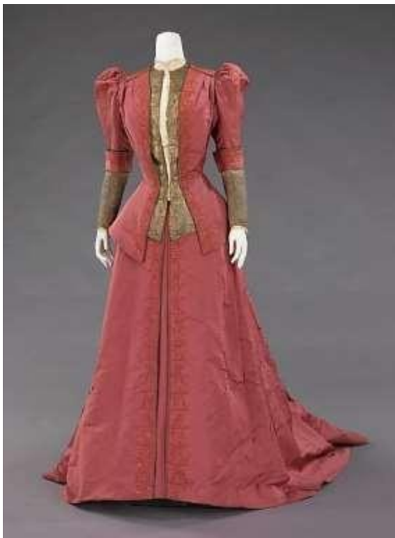
Jean-Philippe Worth “ Dinner dress ”, περίπου 1900. Μετάξι, μέταλο, στρας. Νέα Υόρκη: Brooklyn Museum Costume Collection στο Metropolitan Museum of Art.

ζούσαν σε πόλεις παρά σε αγροκτήματα. Ο συνολικός πλούτος του έθνους υπερδιπλασιάστηκε μεταξύ 1920 και 1929 και αυτή η οικονομική ανάπτυξη οδήγησε σε μία καταναλωτική και έντονα κοινωνικο-πολιτισμική κοινωνία. Χάρη στην ανάπτυξη της διαφήμισης (εφημερίδες) και της βιομηχανίας, οι άνθρωποι μαζικά είχαν πρόσβαση στα ίδια προϊόντα, άκουγαν την ίδια μουσική, έκαναν τους ίδιους χορούς και ακόμα χρησιμοποίησαν την ίδια αργκό. Ο κόσμος απελευθερώθηκε και πνευματικά και αυτό φαίνεται και στην ένδυση καθώς η απλότητα αλλά και τα πολύπλοκα ρούχα και αξεσουάρ κυριαρχούσαν. 8 9