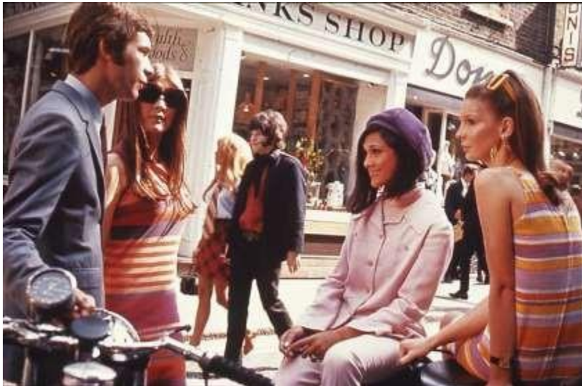
Άγνωστος Φωτογράφος, «Swinging London. Teenagers in London's Carnaby Street», 1969, The National Archives UK.