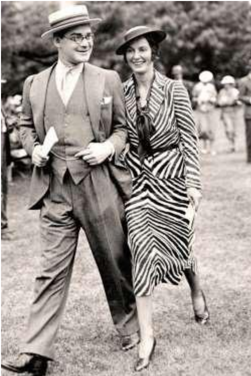
Άγνωστος Φωτογράφος, Μέσα του 1930 σχέδιο ζέβρας, Δεκαετία του '30.

Τη δεκαετία του 1930, τα γυναικεία ρούχα άρχισαν να γίνονται πιο θυληκά και εφάρμοζαν στο σώμα ώστε να αναδείξουν την γυναικεία φιγούρα. Φορούσαν φορέματα κάτω από το γόνατα που υπογράμμιζαν την γραμμή του σώματος αλλά και πιο ρομαντικά. Αυτήν την περίοδο, τα σχέδια στα φορέματα (πουά, φλοράλ, καρό και με σχέδια ζώων) ήταν στην προτίμηση των γυναικών. Οι άνδρες φορούσαν κουστούμια (το λεγόμενο white collar style) ή για πιο απλό ντύσιμο, πουλόβερ και κοντομάνικα μπλουζάκια. Η γραβάτα έπαψε να είναι υποχρεωτική ενώ οι φανέλες σιγά σιγά σταμάτησαν να φοριούνται. Υλικά όπως το sharkskin (είδος υφάσματος που χρησιμοποιείται συχνά στα θαλάσσια αθλήματα) έκαναν την εμφάνισή τους. Τα ρούχα δεν καθόριζαν πια την κοινωνική τάξη του καθένα αλλά ο καθένας μπορούσε να φοράει ότι ήθελε. Έδω να αναφερθεί και το γεγονός πως οι ταινίες και οι διαφημίσεις απέκτησαν μεγάλη επιρροή στην μόδα καθώς ήταν το μέσο προβολής των ρούχων και ανάδειξης των νέων τάσεων. 10