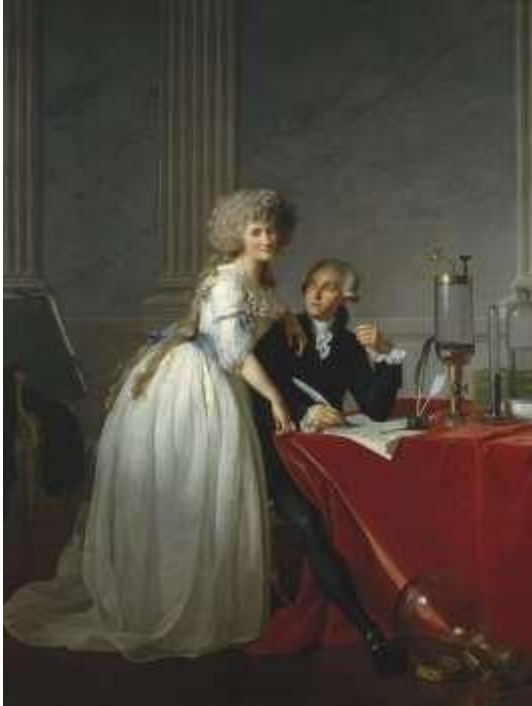
Jacques-Louis David, «Πορτραίτο του Antoine-Laurent Lavoisier και της γυναίκας του», 1788, Νέα Υόρκη, Metropolitan Museum of Art.

ακριβά υλικά όπως μετάξι και σατέν. Οι άνδρες φορούσαν κολάν και κουστούμια και οι γυναίκες μακριά φορέματα και καπέλα. Τέλη του 18 ου αιώνα, τα φορέματα από ογκώδη έγιναν πιο λεπτά, κομψά και ψηλόμμεσα.