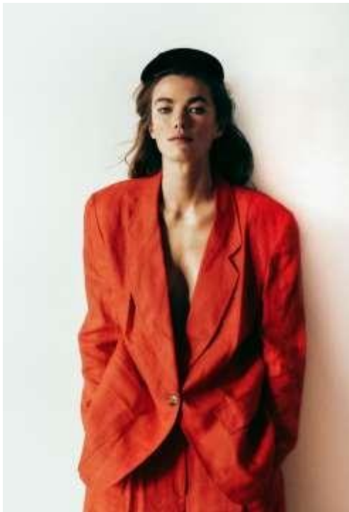
Will Vendramini, "Untitled", Mathilde Brandi, Δεκαετία του '90.

Ο Will Vendramini (Ιταλός φωτογράφος) είναι γνωστός για τις φωτογραφίες μόδας κατά την διάρκεια της δεκαετίας του '90 και όχι μόνο, οι οποίες έχουν δημοσιευτεί σε μεγάλα περιοδικά μόδας όπως Harper's Bazaar και Elle. Η διαχείριση του φωτισμού στις φωτογραφίες του είναι εξαιρετική και το αποτέλεσμα ακόμα και σε φωτογραφίες στούντιο είναι σαν φυσικό. Τα μοντέλα του τα φωτογραφίζει με έναν καθηλωτικό τρόπο που οδηγεί τον θεατή να χαζεύει τις εικόνες του για ώρα.